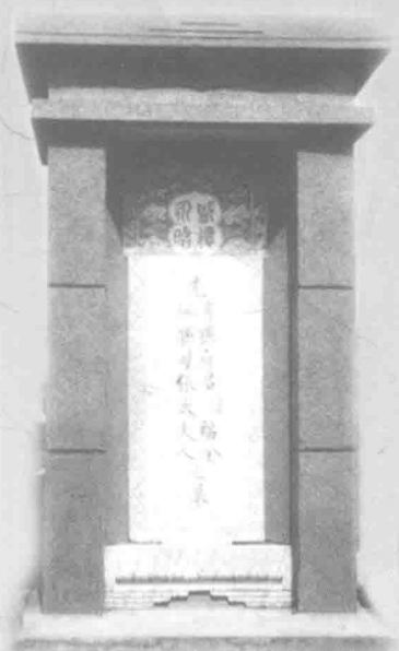
右图 孙禄堂先生墓碑 下图 孙禄堂先生陵墓