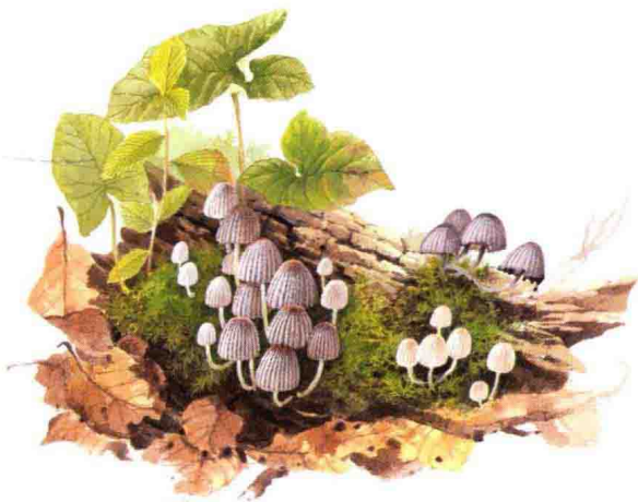
■ 鬼伞科……见第 90 页