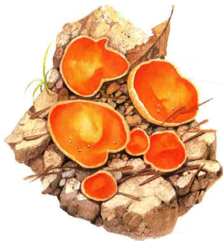
■ 火丝菌科……见第 182 页