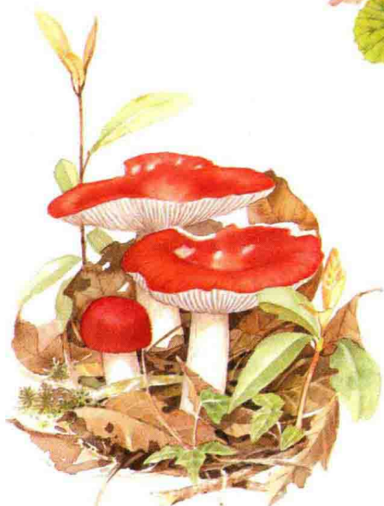
■ 红菇科……见第 106 页