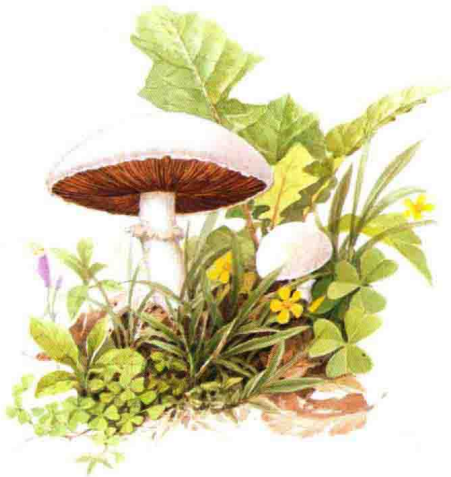
■ 伞菌科……见第 86 页