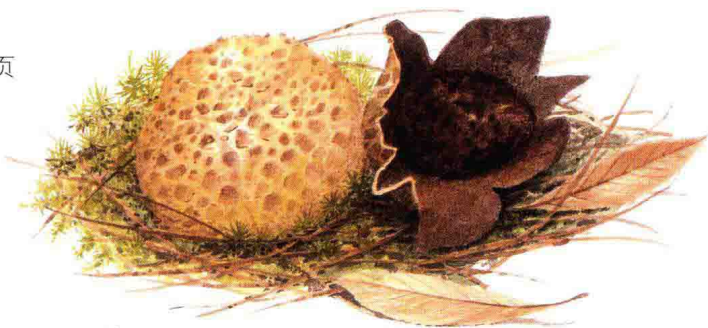
■硬皮马勃科……见第166页