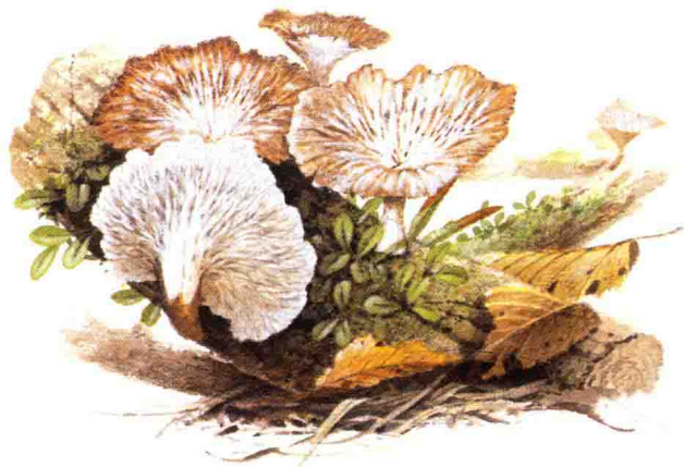
■柄杯菌科……见第 138 页