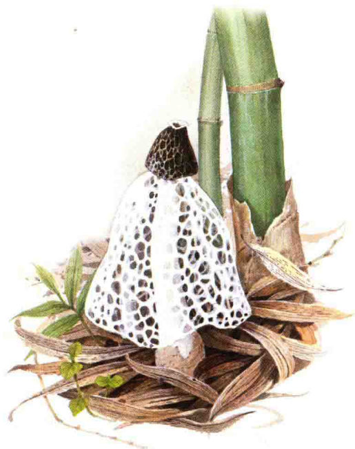
■ 鬼笔科……见第 170 页