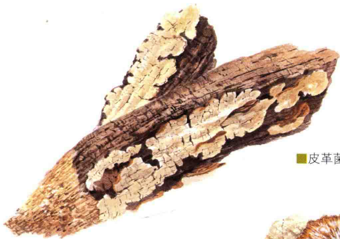
■皮革菌科……见第 134 页