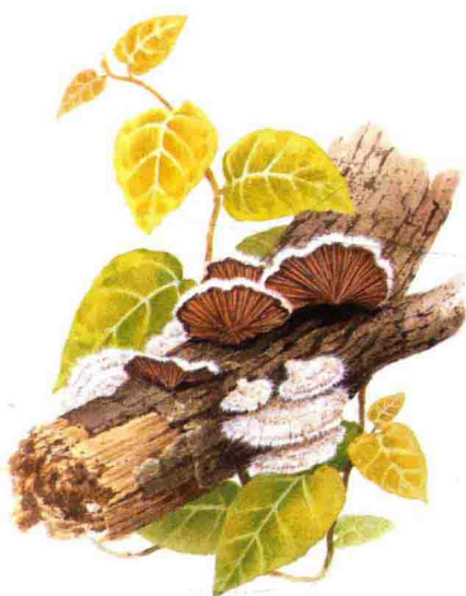
■ 裂褶菌科……见第 114 页