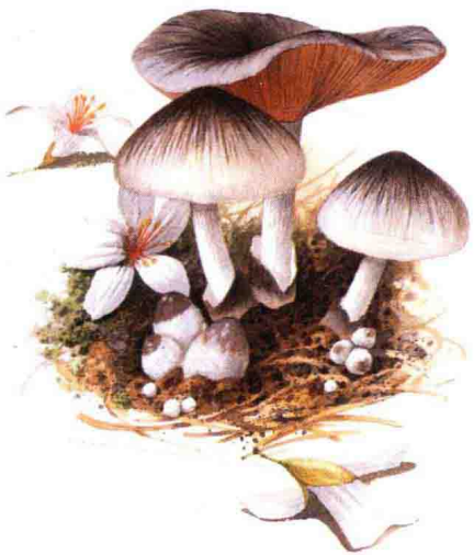
■ 光柄菇科……见第 78 页