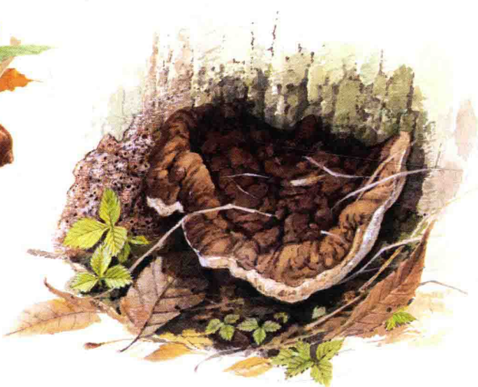
■刺革菌科……见第 140 页