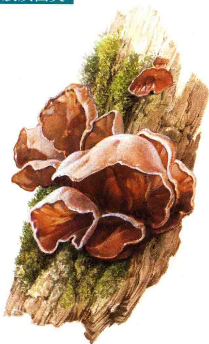
■ 木耳科……见第 174 页