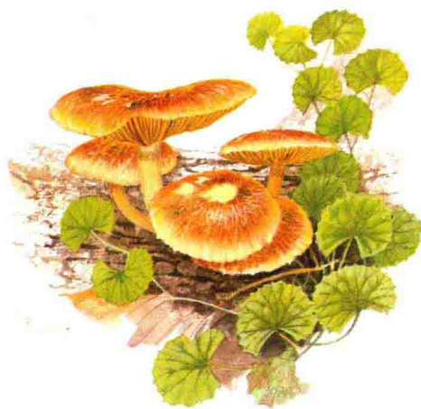
■ 丝膜菌科……见第 102 页