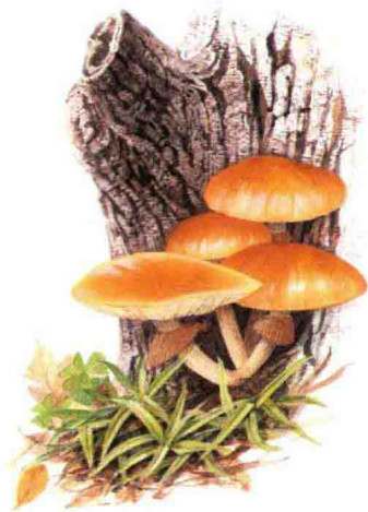
■ 粪伞科……见第 94 页