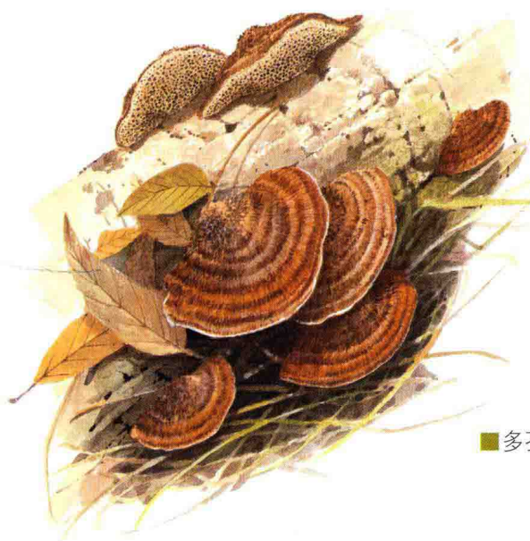
■多孔菌科……见第 124 页