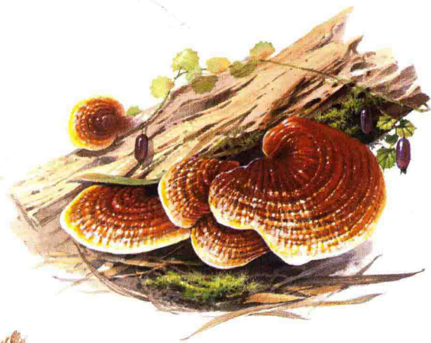
■灵芝科……见第 120 页