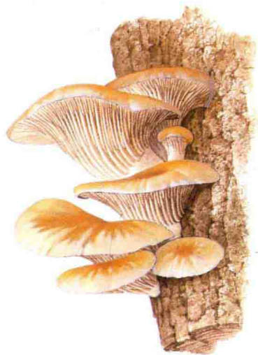
■ 侧耳科……见第 110 页