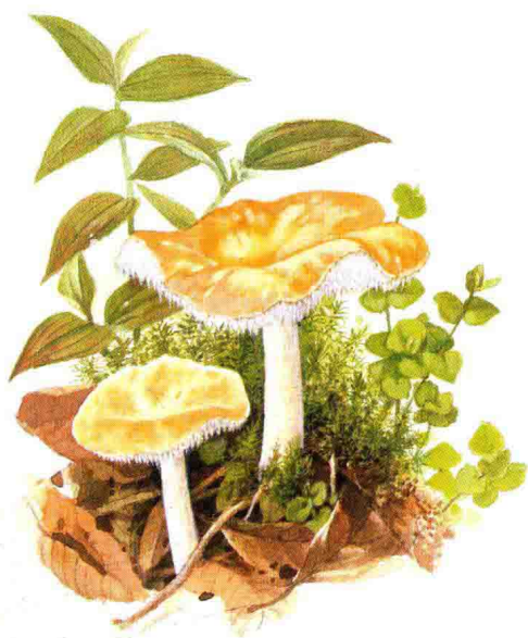
■齿菌科……见第 130 页