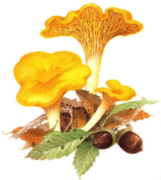
■鸡油菌科……见第 146 页