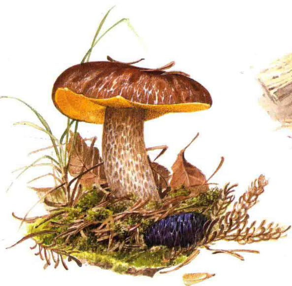
■牛肝菌科……见第 116 页