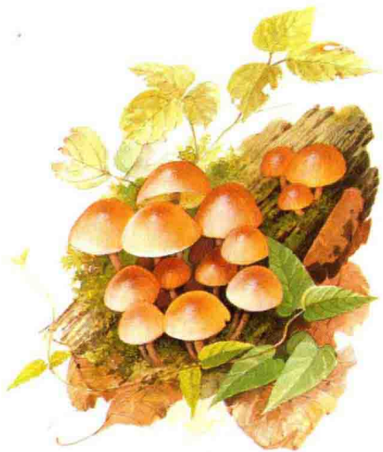
■ 球盖菇科……见第 98 页