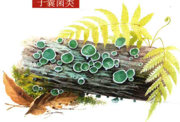
■ 柔膜菌科……见第 178 页