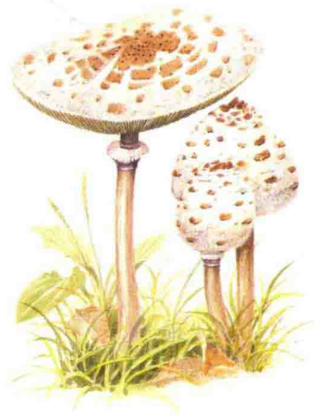
■ 环柄菇科……见第 82 页