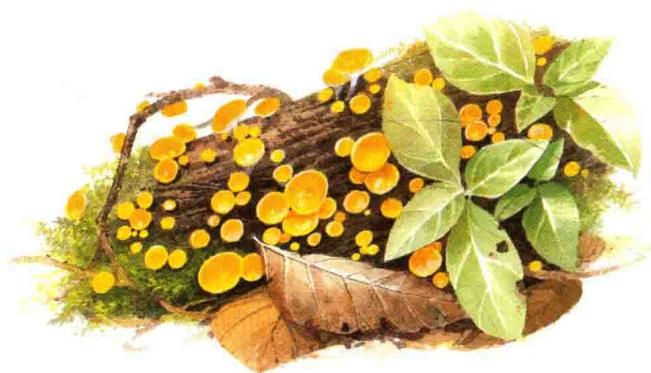
■ 核盘菌科……见第 180 页