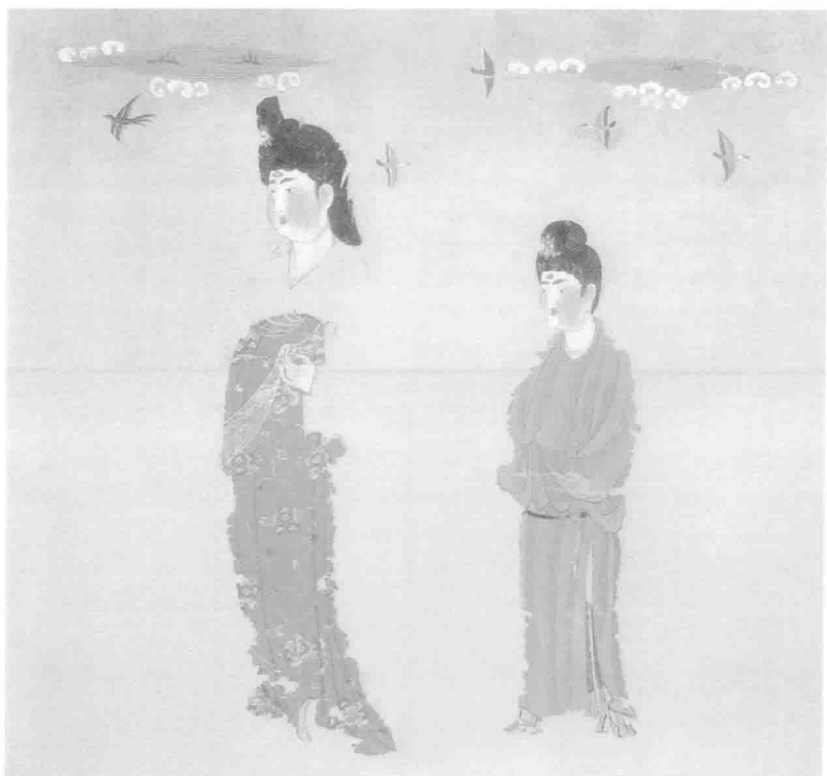
图2 彩绘双人仕女图(绢画)，唐代，新疆阿斯塔那187号墓出土