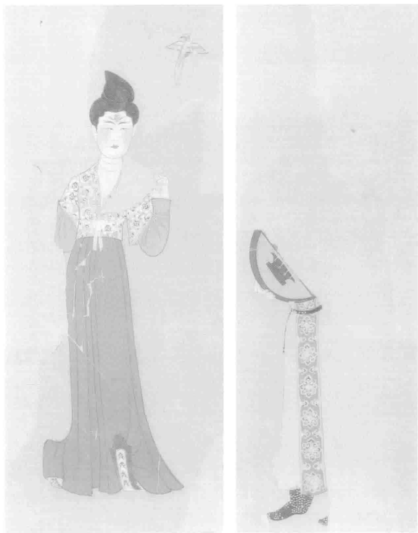
图 1 舞伎图(绢画), 新疆阿斯塔那 230 号墓出土

绢画中舞者头梳朝天髻。上身穿翻领红袖衫, 外罩半臂衫, 下身穿拖地长裙, 足穿翘头履, 右手执扇。唐代武周长安三年(703)下葬的张礼臣墓出土。