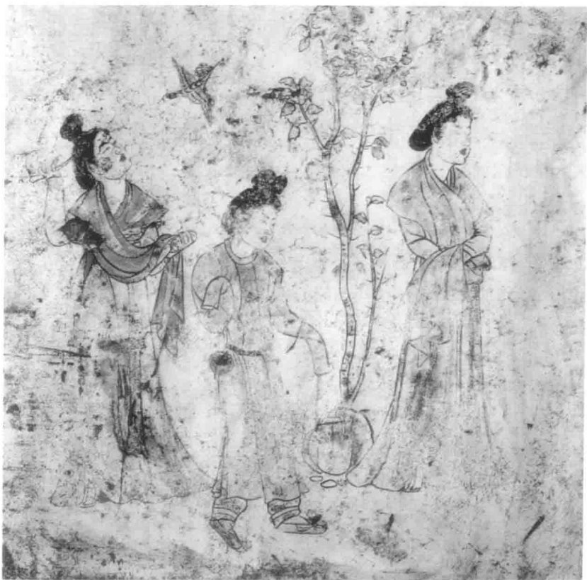
图5 观蝉捕鸟图 章怀太子李贤墓壁画

这是一幅以宫怨为题材的著名作品。画面中人、鸟、树三者动静交错，其艺术构思令人叫绝，在中国古代美术史有着显赫的地位。