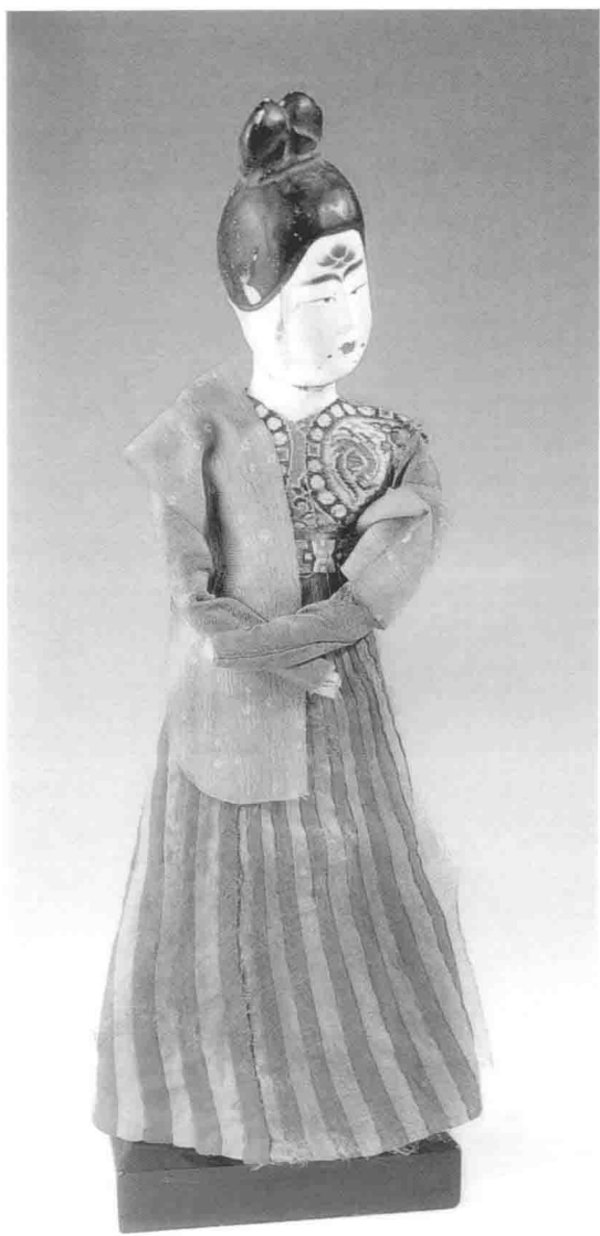
图8 女子俑 新疆阿斯塔纳206号墓出土 绢衣木俑，眉宇间颇有神采。花钿生色，半臂斜披。 一副华丽有趣的贵妇形象。