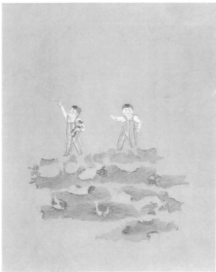
图3 双童图(绢画),唐代,新疆阿斯塔那187号墓出土