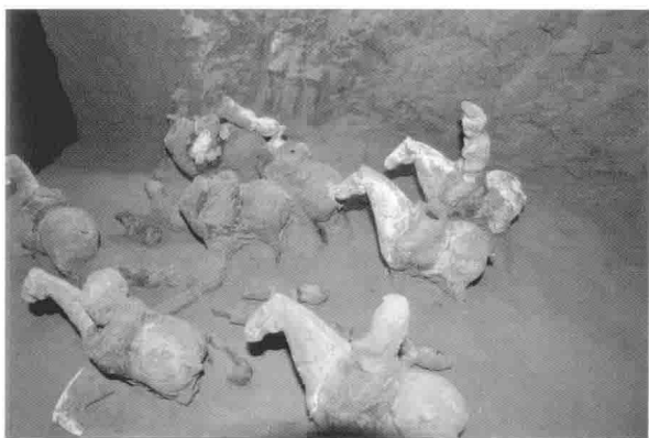
图7 上官婉儿墓墓盖、上官婉儿墓葬内景

2013年9月，位于陕西省咸阳市渭城区的一座唐代墓葬因为建设施工重见天日。墓葬被盗严重，幸运的是墓志保存完整，这座唐墓的主人便是上官婉儿。墓志揭开了上官婉儿更多的秘密。