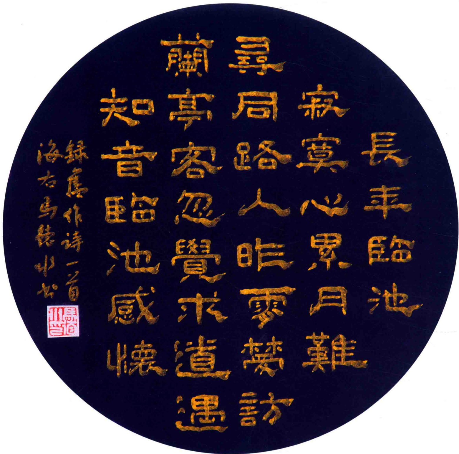
隶书团扇：自作诗《临池感怀》 68cm×68cm 1999年