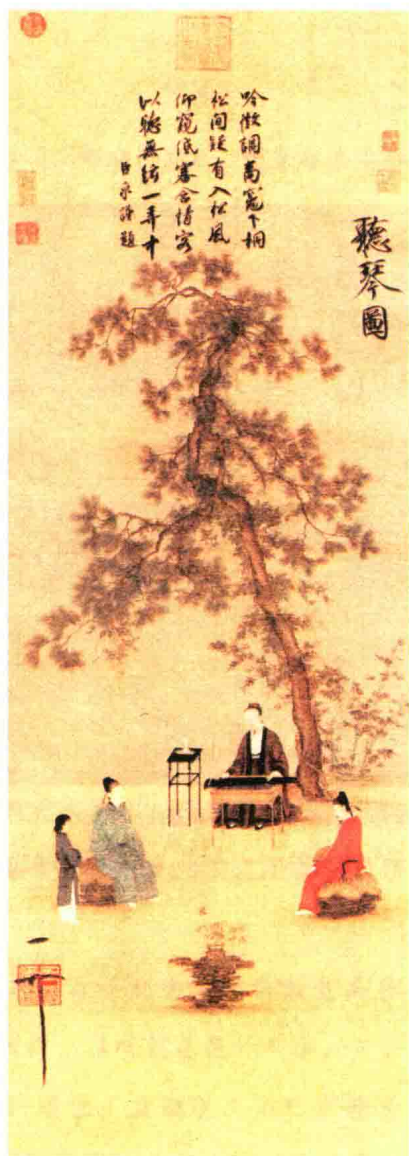
宋 赵佶 听琴图