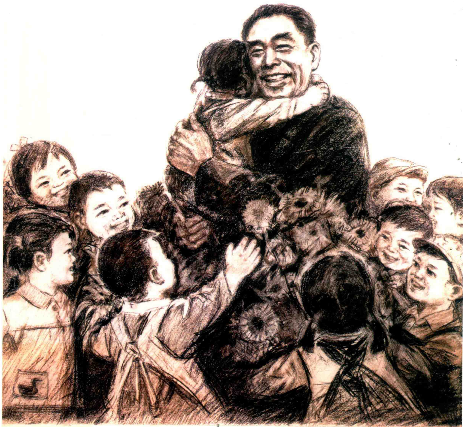
周总理和孩子们 1976年