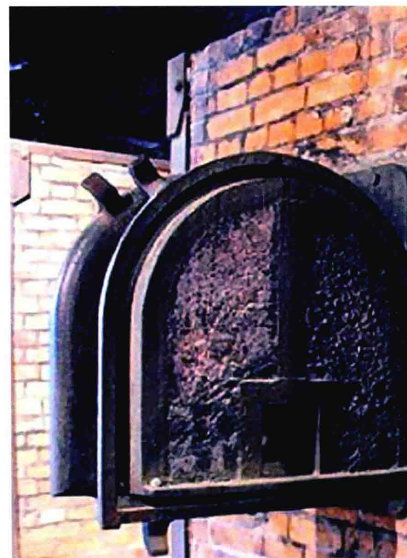
上海新兴的4D体验馆