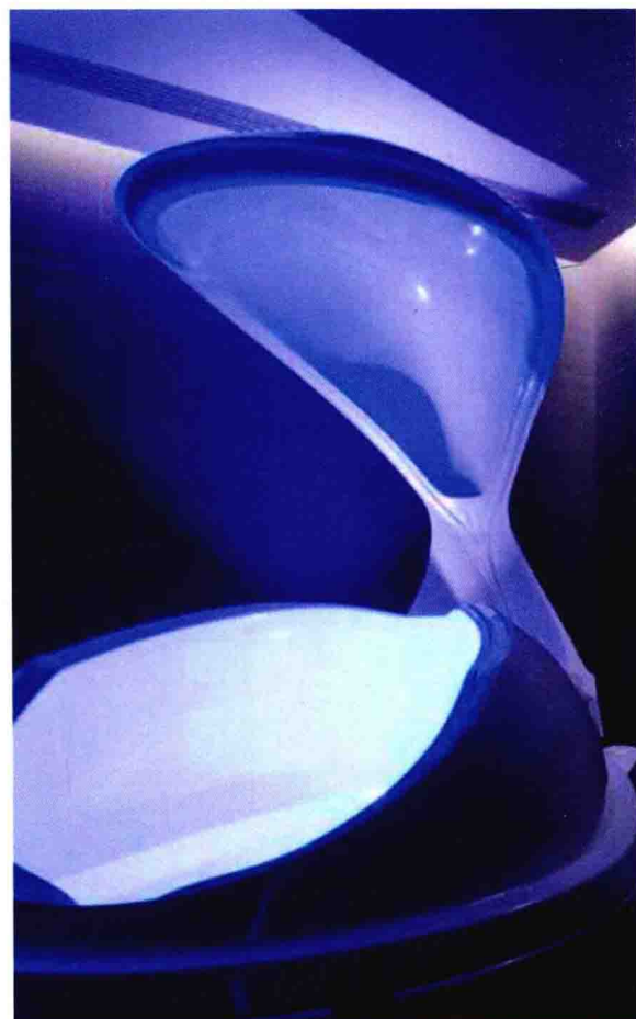
上海新兴的漂浮体验馆让人体验一种完全与世隔绝的状态