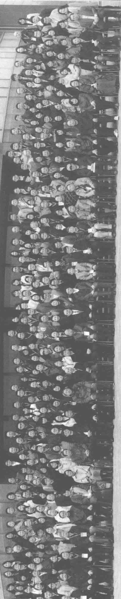
年会大合影第一排就坐嘉宾