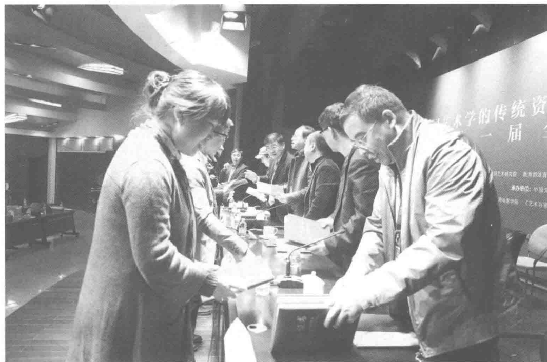
年会优秀论文颁奖仪式