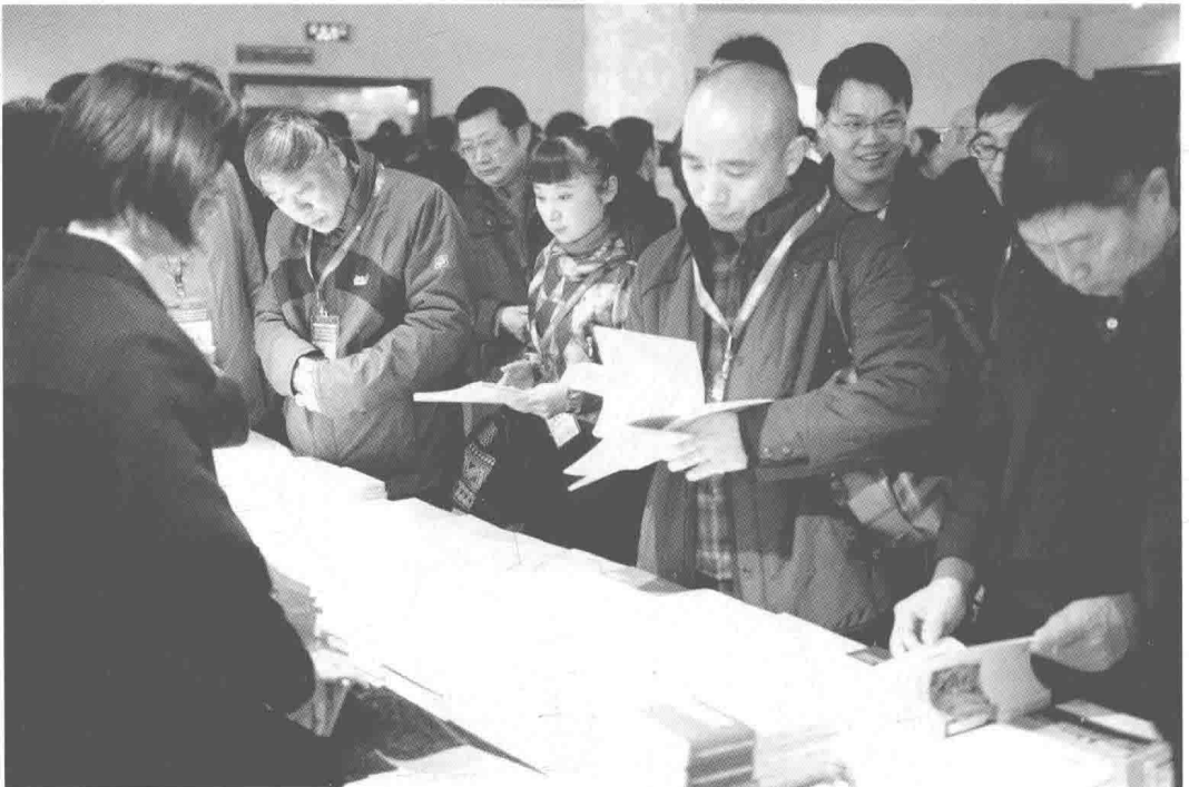
文联社《中国艺术学文库》图书引起参会代表的浓厚兴趣