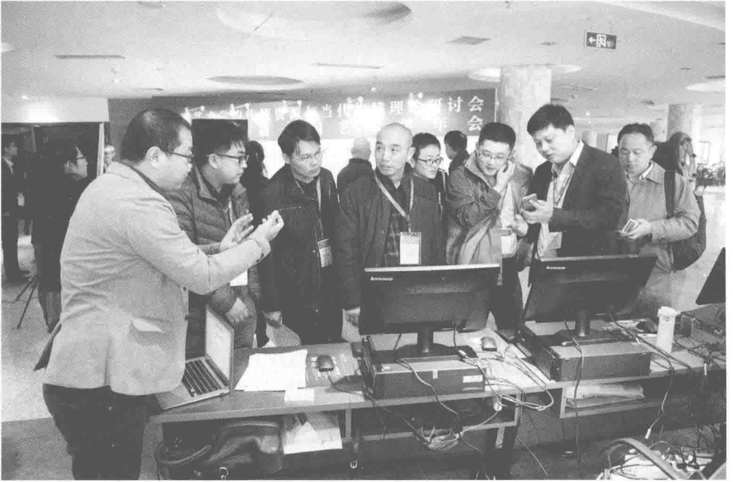
参会代表了解、体验文联社数字平台