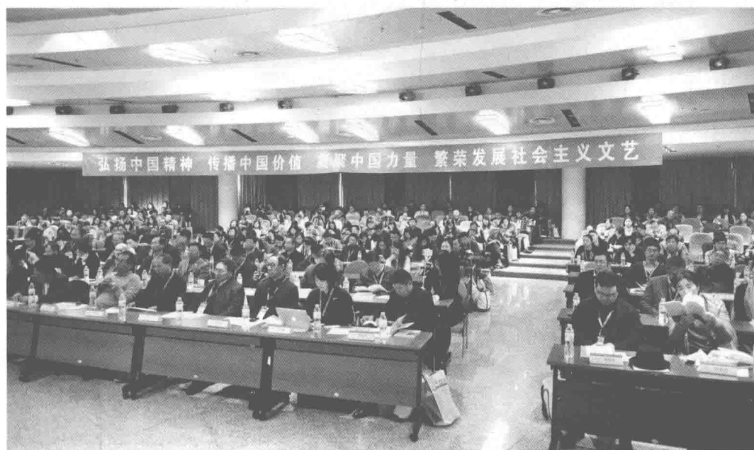
开幕式现场参会代表