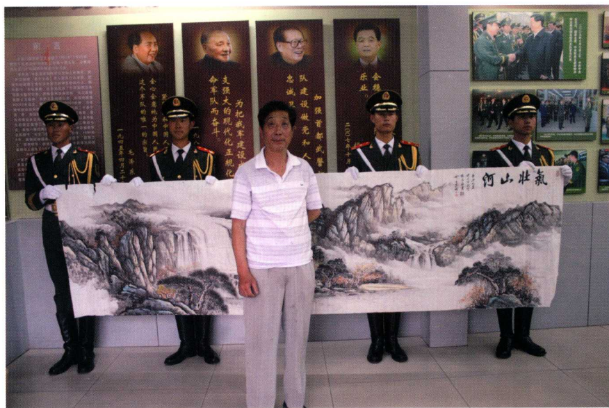
与天安门国旗护卫队合影