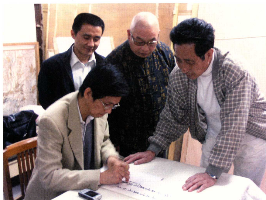
与著名画家何家英先生合影