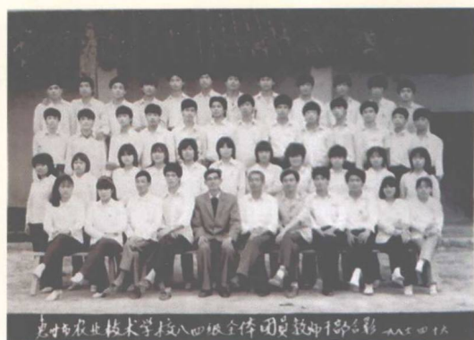
▲ 农校八四届毕业生与教师合照, 作者前排左七 (1984)