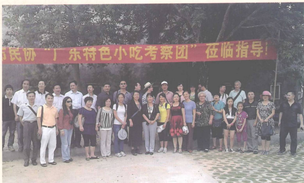
▲ 到惠阳秋长采风与众民协会会员合照，作者前排左一（2013-9）