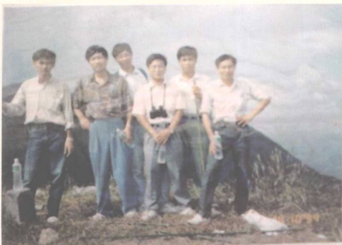
▲ 与东平开发公司员工 登上罗浮主峰飞云顶 的留影，作者右一 (1994)