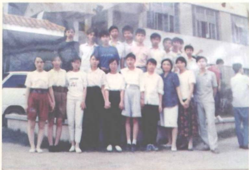
▲与七中初中五班部分师生留影（1991）