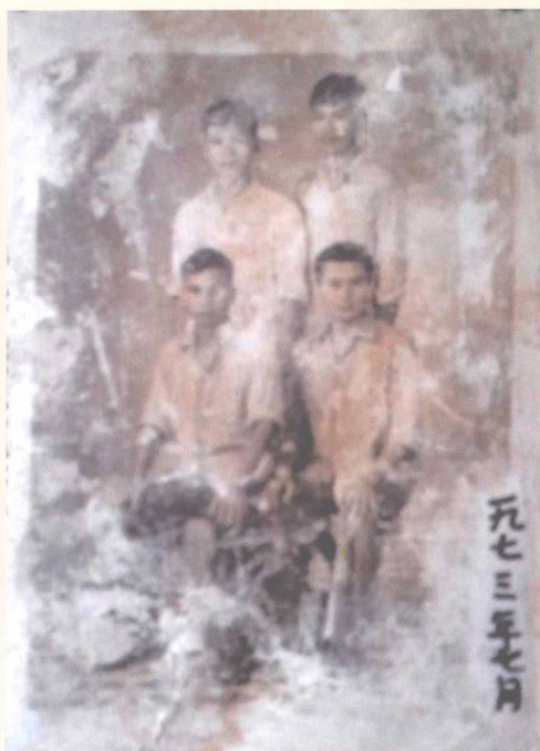
▶ 高中毕业作者 (前右一) 与同学合照 (1973)