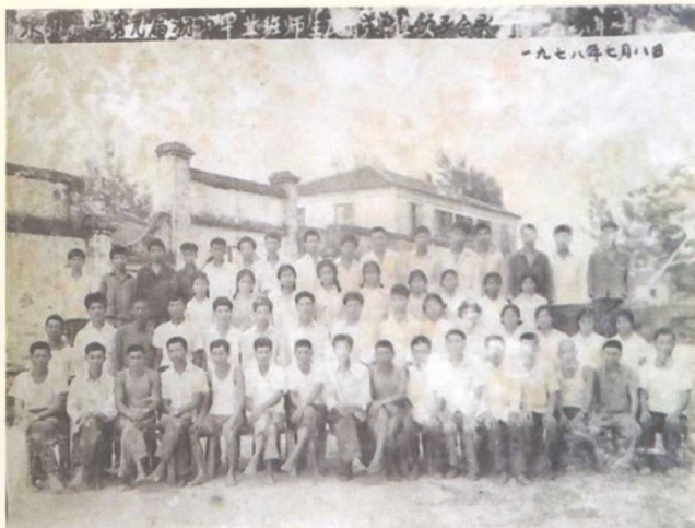
▲ 当民办教师与水北附设初中毕业生、教师、 村官合照 (1978) 作者: 前二排左八