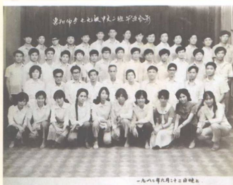
▲ 惠阳师专毕业同班师生合照, 作者后排左十 (1982)