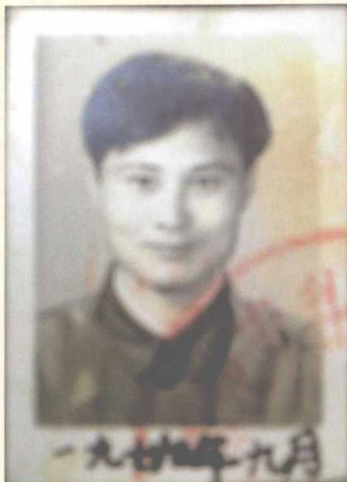
▲ 作者高考入学照片 (1979)