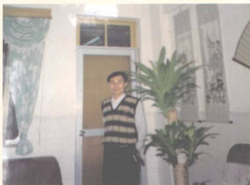
▲ 作者在指挥部办公室留影 (1994)