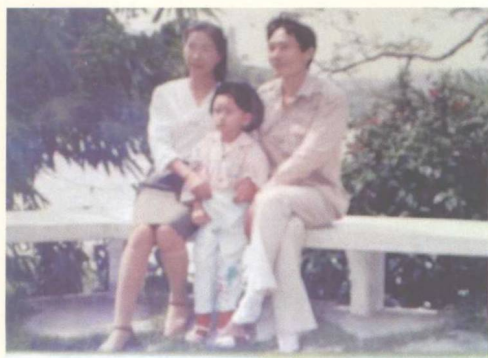
▶ 作者与妻、儿的合影 (1987)