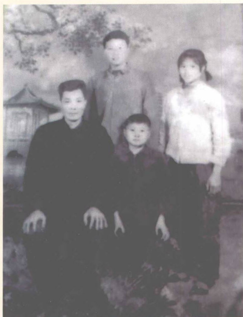
◀ 与家人合影 (1968)