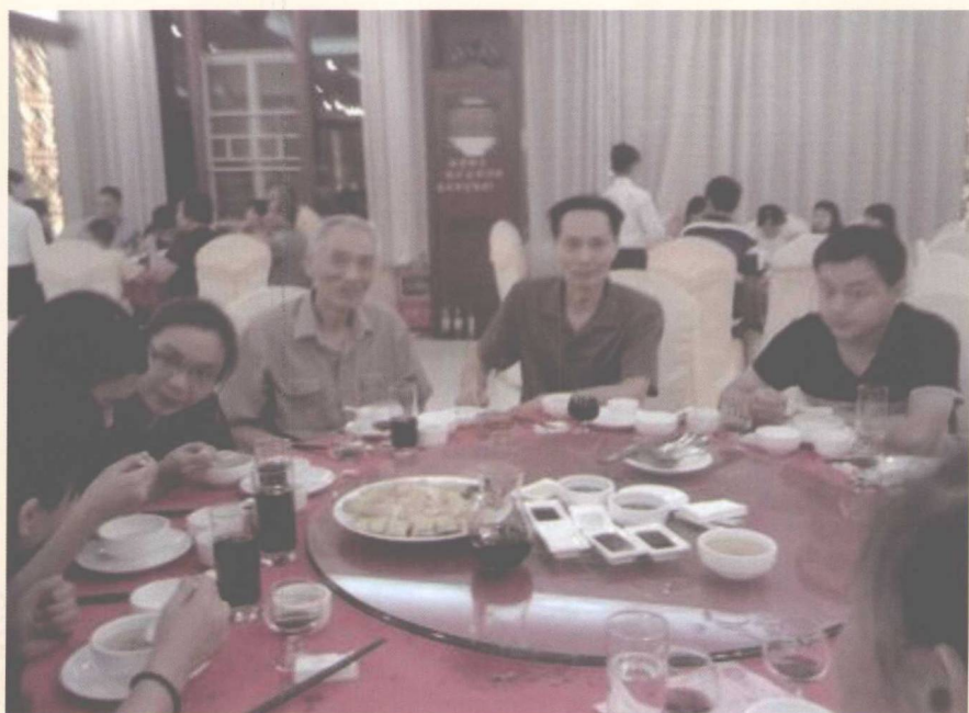
▲ 参加惠州地方特色的亲友婚宴，作者与大兄（左四）、堂弟（右一）留影（2013-10）