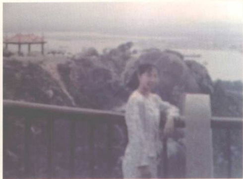
▲ 妻子生前照片 (1992)