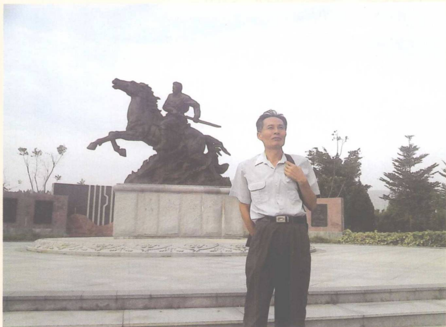
▲ 作者近照（2013-9于惠阳秋长叶挺将军纪念园）