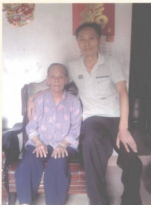
▶ 作者与二姑合照 (2013)