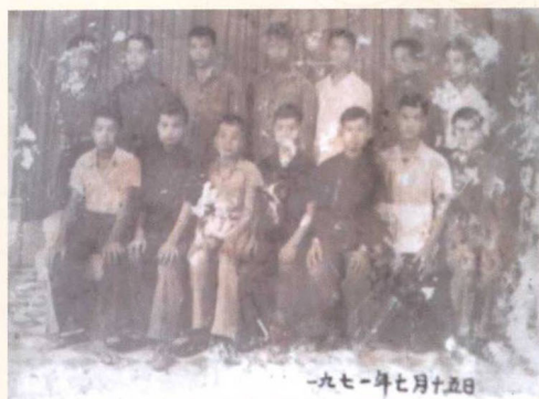
▼ 初中毕业合影 (1971) 前左二