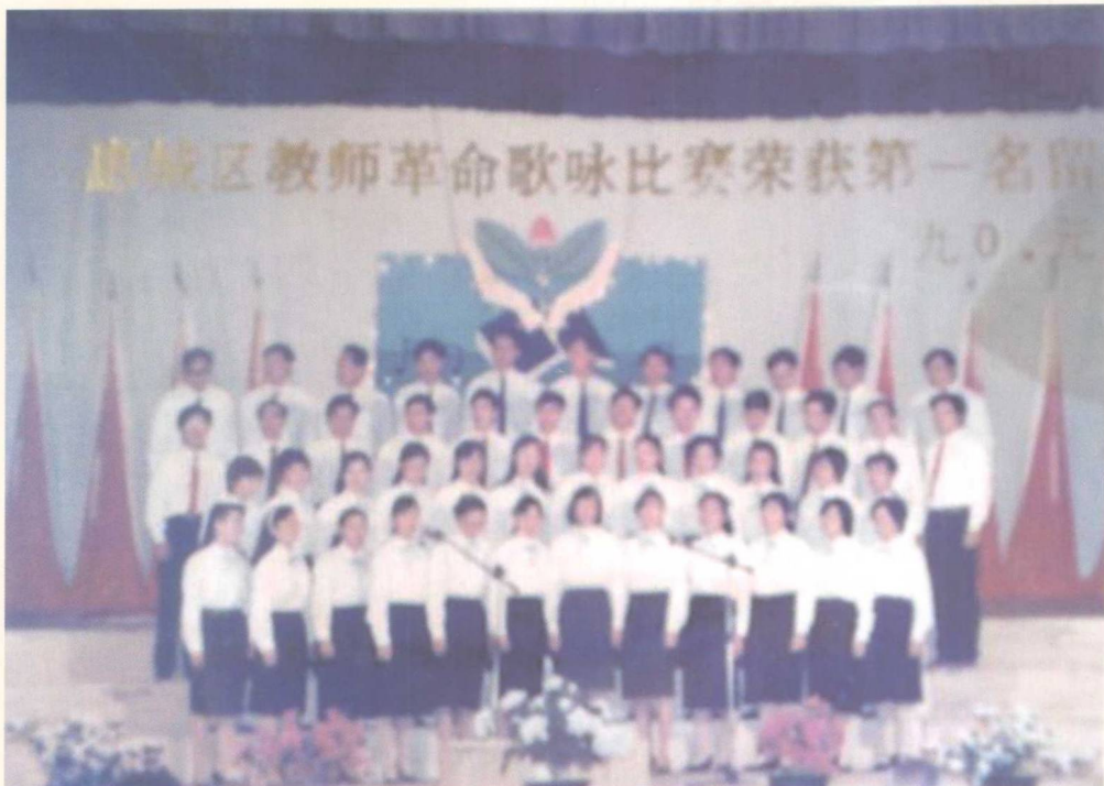
▲与市七中教师同参加比赛获奖合影（1990），作者前三排左六