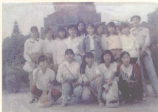
▲ 与市七中初中五班女生的留影 (1991)