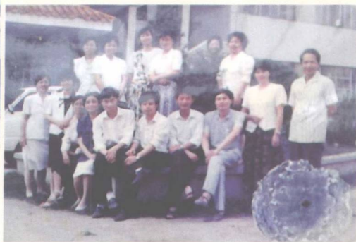
▲与七中初三级教师合影，作者前右一（1991）