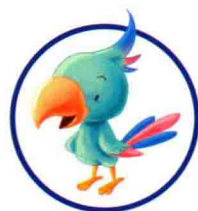
yīng wǔ 鹦鹉