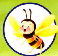
kūn chóng 昆虫