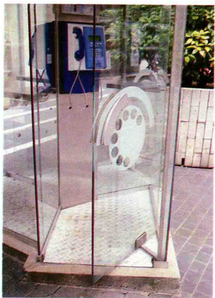
图 1.18 电话亭