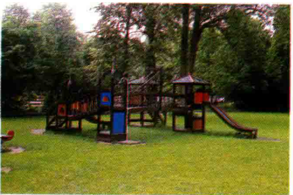
图 1.21 儿童游乐设施