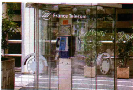
图 1.16 电话亭