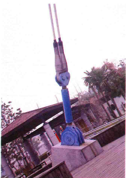
图 1.20 悬锁桥