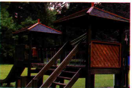
图 1.22 儿童游乐设施