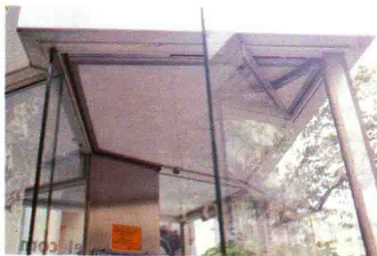
图 1.15 电话亭

由于公共环境设施是城市文化载体,体现了城市文明,同时工业化也体现了一个国家和地区的现代化的发展水平,现代技术的高精度的构件组合、新材料的运用,最好地体现出时代精神(图1.15~1.23)。