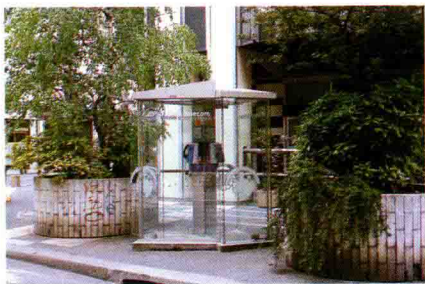
图 1.23 电话亭