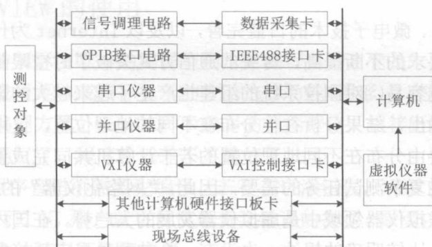
图 1-2 虚拟仪器结构框图

2) I/O 接口设备主要完成被测输入信号的放大、调理、模数转换、数据采集。可根据实际情况采用不同的 I/O 接口硬件设备，如数据采集卡(DAQ)、GPIB 总线仪器、VXI 总线仪器、串口仪器等。虚拟仪器构成方式有 5 五种类型，如图 1-3 所示。无论哪种 VI 系统，都是通过应用软件将仪器硬件与通用计算机相结合。