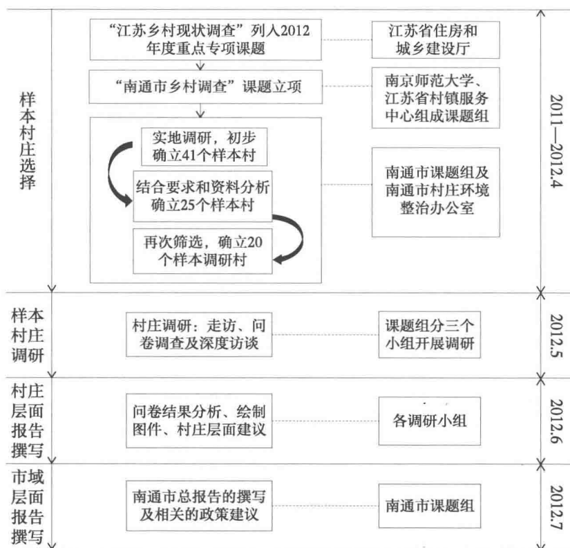
图1-1 南通市乡村调查课题组工作步骤

市域层面报告撰写阶段：通过县志、统计年鉴等资料进一步了解南通市乡村发展的现状，并在各个样本村庄报告的基础上，撰写南通市域层面的乡村人居环境发展报告，反映南通市村庄发展的历史沿革、人居环境特征及村民人居环境改善意愿等，并提出适合南通市乡村人居环境改善的策略建议。