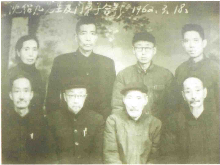
(此照片现藏成都中医药大学博物馆)