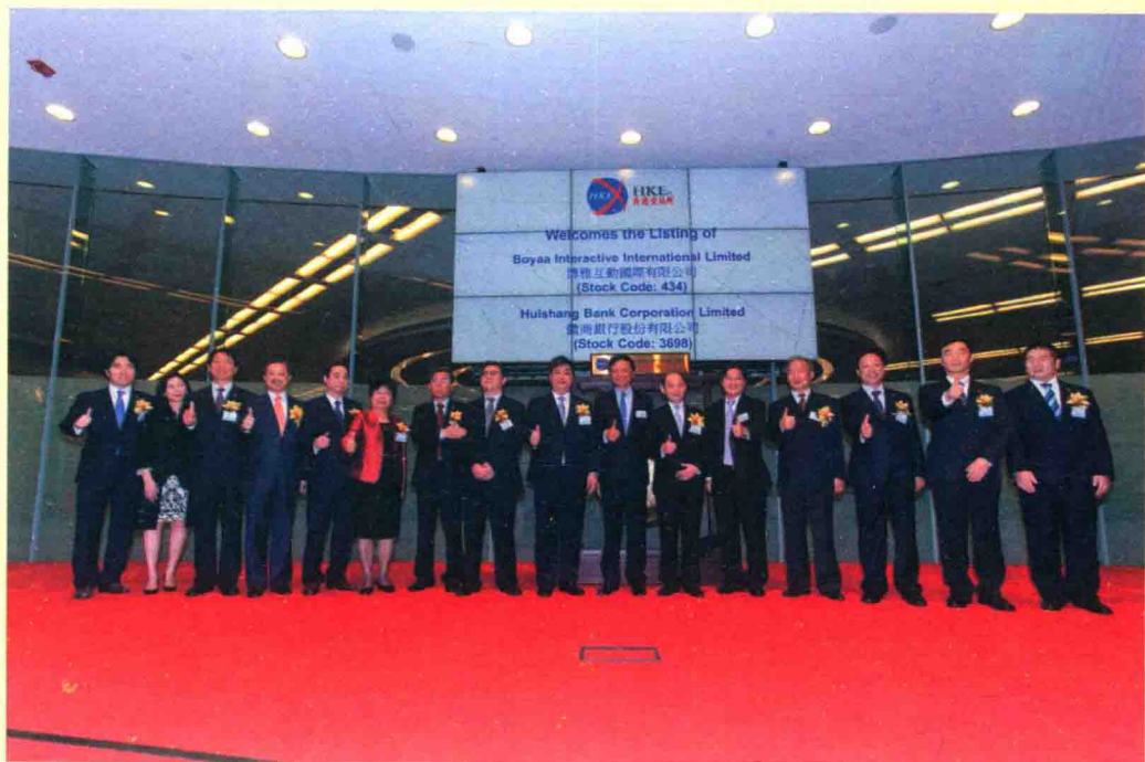
徽商银行全体董、监、高与香港联交所行政总裁李小加先生在上市仪式上合影