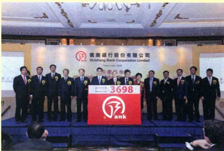
徽商银行全体董、 监、高在上市庆祝 晚宴上