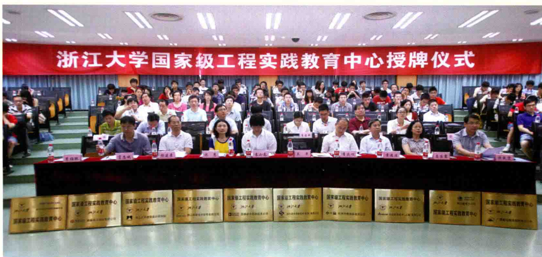
▲ 6月26日，浙江大学向14家共建企业授予“国家级工程实践教育中心”铜牌。