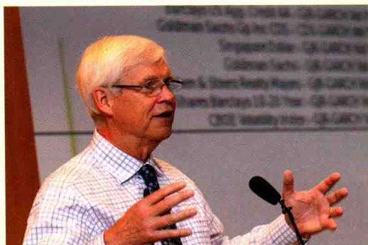
▲ 6月16日，诺贝尔经济学奖获得者罗伯特·索洛被聘为浙江大学名誉教授。