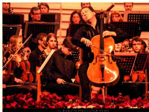
▲ 10月15日，德国卡尔斯鲁厄大学访问浙江大学专场音乐会在紫金港剧场举行。