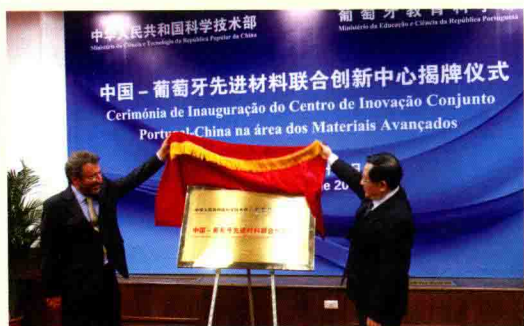
▲ 2月28日，“中国—葡萄牙先进材料联合创新中心”正式落户浙江大学。