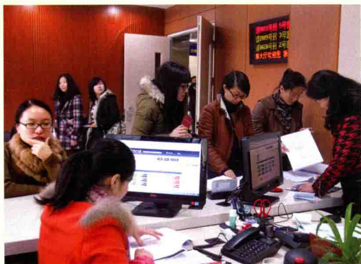
▲ 2月27日，浙江大学行政服务办事大厅正式启用。