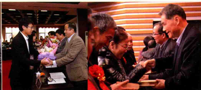
▲ 从6月份起，浙江大学陆续推出包括“浙大欢迎您”、“浙大祝贺您”、“浙大祝福您”的暖心工程。