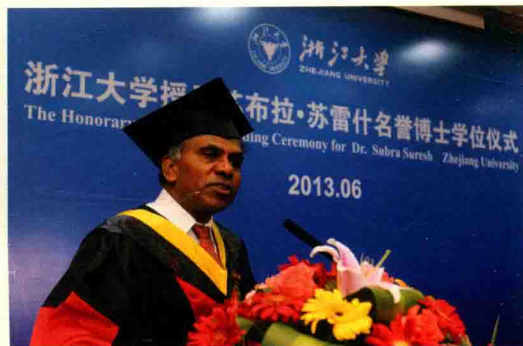
▲ 6月13日美国麻省理工学院Vannevar Bush讲座教授、美国卡耐基梅隆大学候任校长苏布拉·苏雷什被授予浙江大学名誉博士学位。