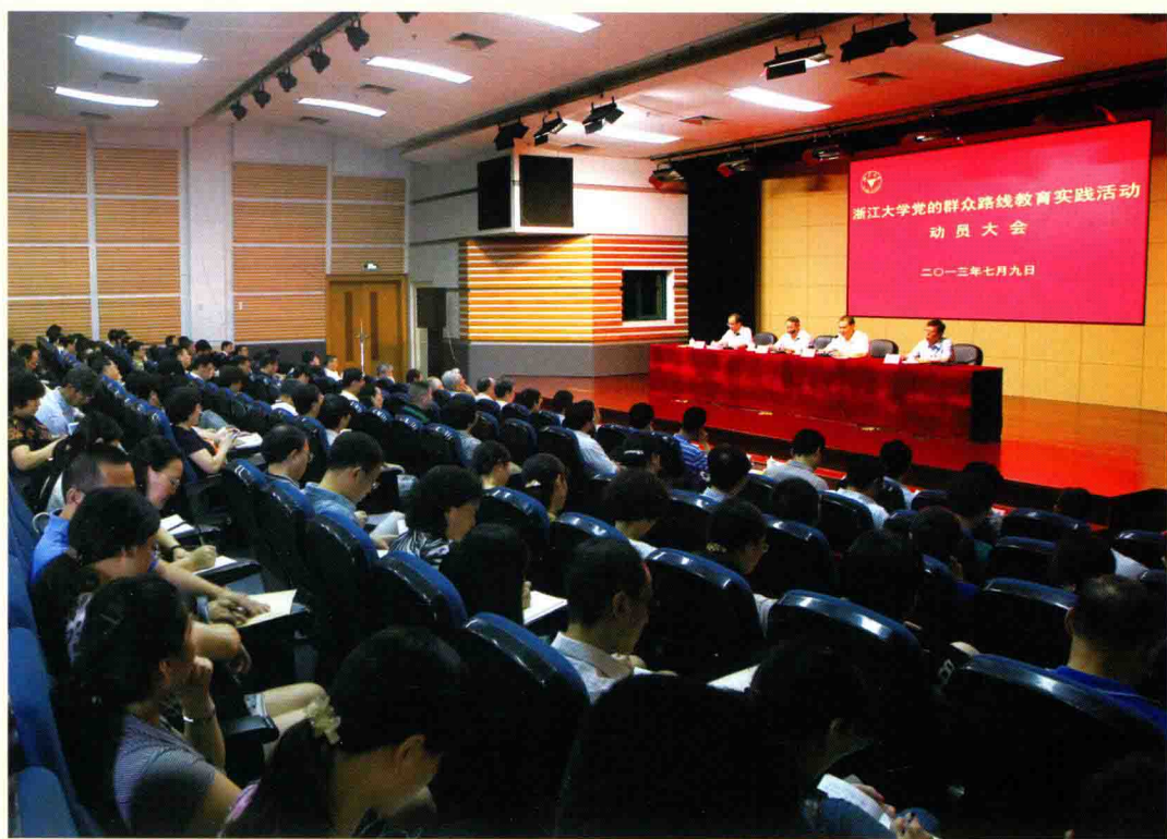
▲ 7月9日，浙江大学召开党的群众路线教育实践活动动员大会。