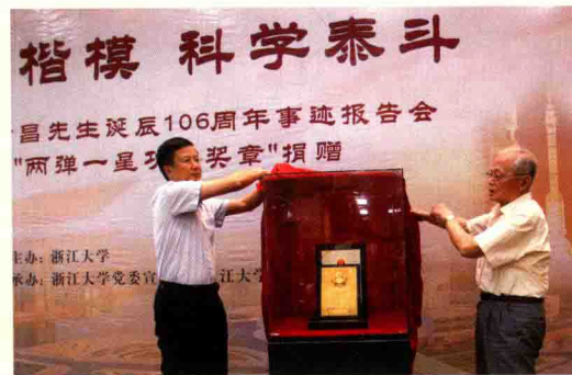
▲ 5月28日 在著名核物理学家、浙江大学杰出校友王淦昌先生诞辰106周年纪念日之际，王淦昌子女将“两弹一星功勋奖章”捐赠给浙江大学。