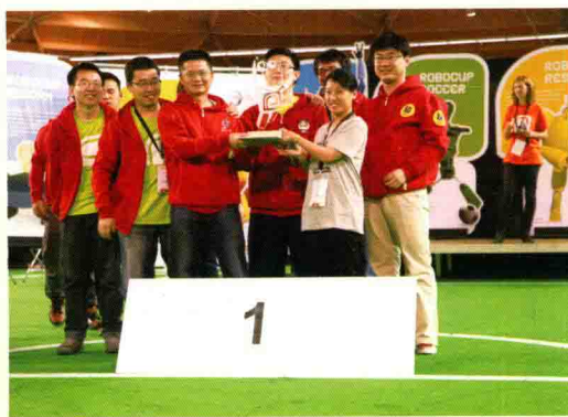
▲ 6月30日，浙江大学“ZJUNlict队”在2013年机器人世界杯足球赛（Robocup）中，获小型组机器人冠军。