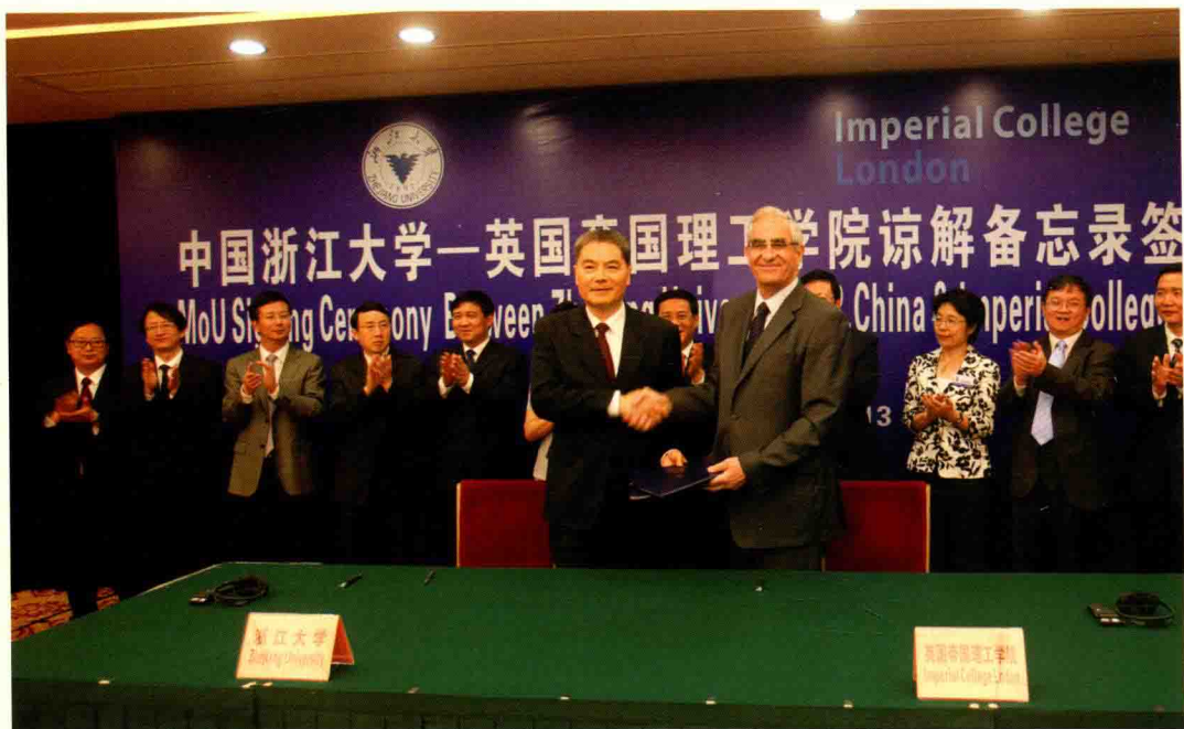
▲ 5月15日，“浙江大学—帝国理工联合学院合作谅解备忘录”仪式在浙江省人民大会堂举行。