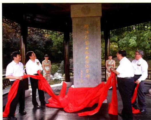
▲ 5月21日，“浙江大学西迁办学纪念碑亭”在浙大紫金港校区落成。