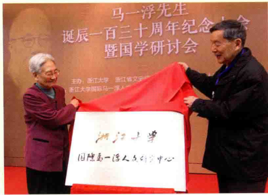
▲ 4月23日，马一浮诞辰130周年纪念会暨国学研讨会在浙江大学举行。