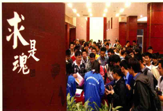
▲ 5月3日“共和国的脊梁——科学大师名校宣传工程”项目之话剧《求是魂》在北京演出。