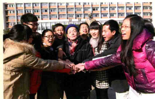
▲ 12月10日，地球科学系终身教授陈桥驿先生获由中国地理学会颁发的中国地理科学领域的最高奖——“中国地理科学成就奖”。