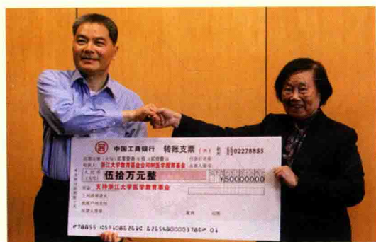
▲ 5月21日，由原浙江医科大学校长郑树教授发起设立的“浙江大学教育基金会郑树医学教育基金”启动仪式在医学部举行。