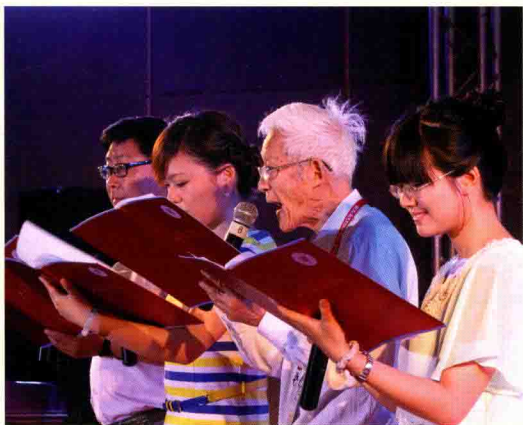
▲ 5月18日 浙江大学药学院迎来百年华诞。药学院几代人在庆祝会上表演诗朗诵。