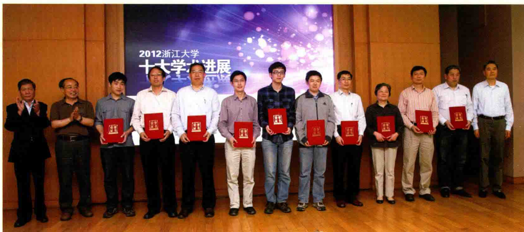
▲ 5月17日，浙江大学首届十大学术进展入围项目揭晓。