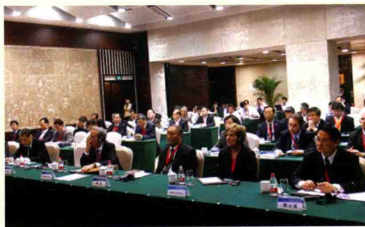
▲ 4月17日，由中国教育部与美国耶鲁大学合作举办的第七期“中国—耶鲁大学领导高级研讨班”在浙江大学开班。