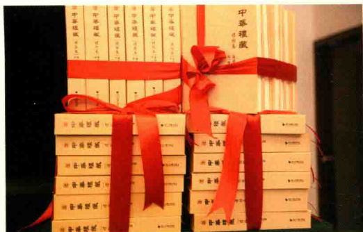
▲ 10月19日，浙江大学古籍研究所、浙江大学礼学研究中心举行《中华礼藏》部分成果首发式。