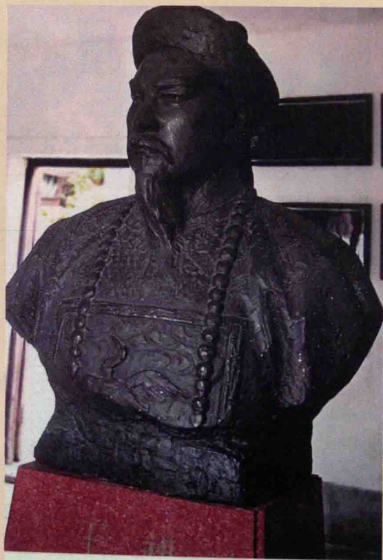
← 清代学者王昶塑像 ↓ 陈莲舫的诊台