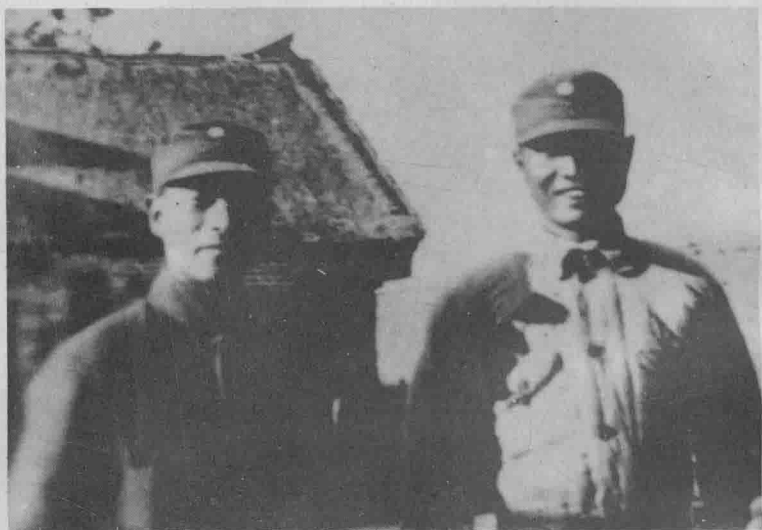
左起：彭雪枫、张爱萍