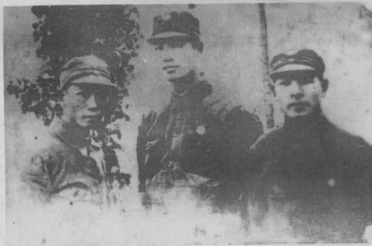
右起：彭雪枫、张震、肖望东