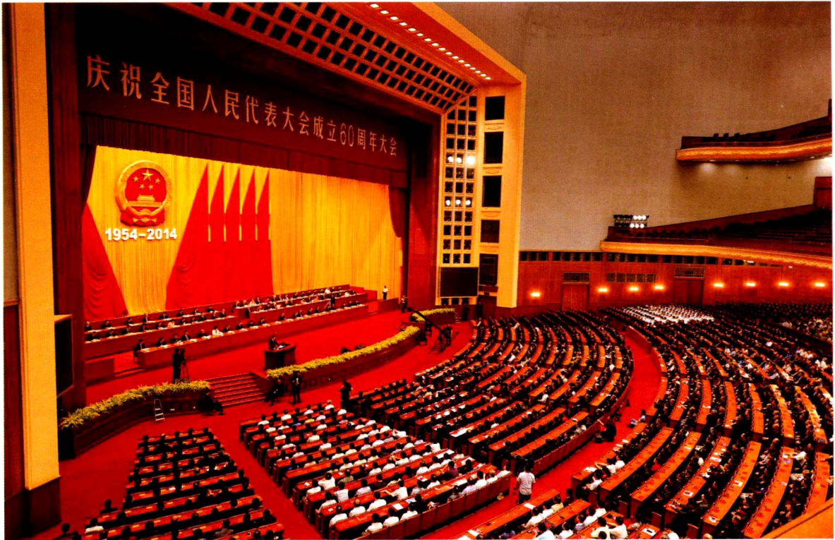
庆祝全国人民代表大会成立 60 周年大会。