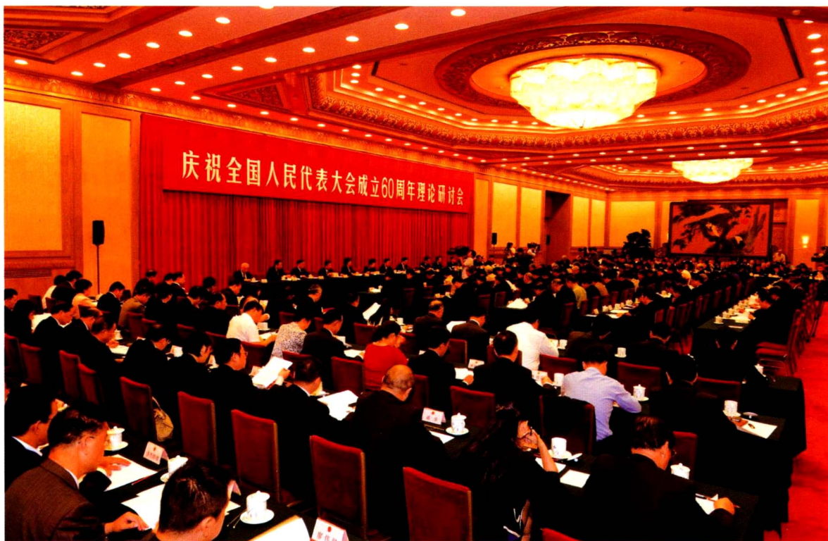
庆祝全国人民代表大会成立 60 周年理论研讨会。