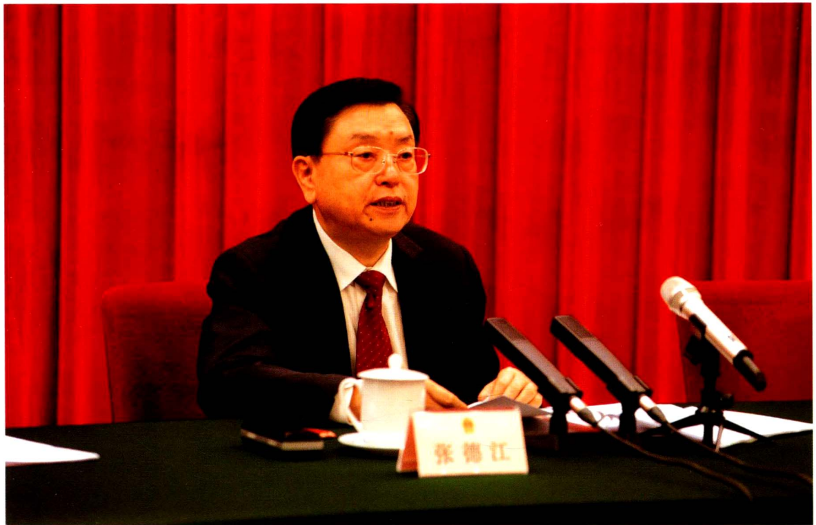
张德江委员长在庆祝全国人民代表大会成立 60 周年理论研讨会上发表重要讲话。