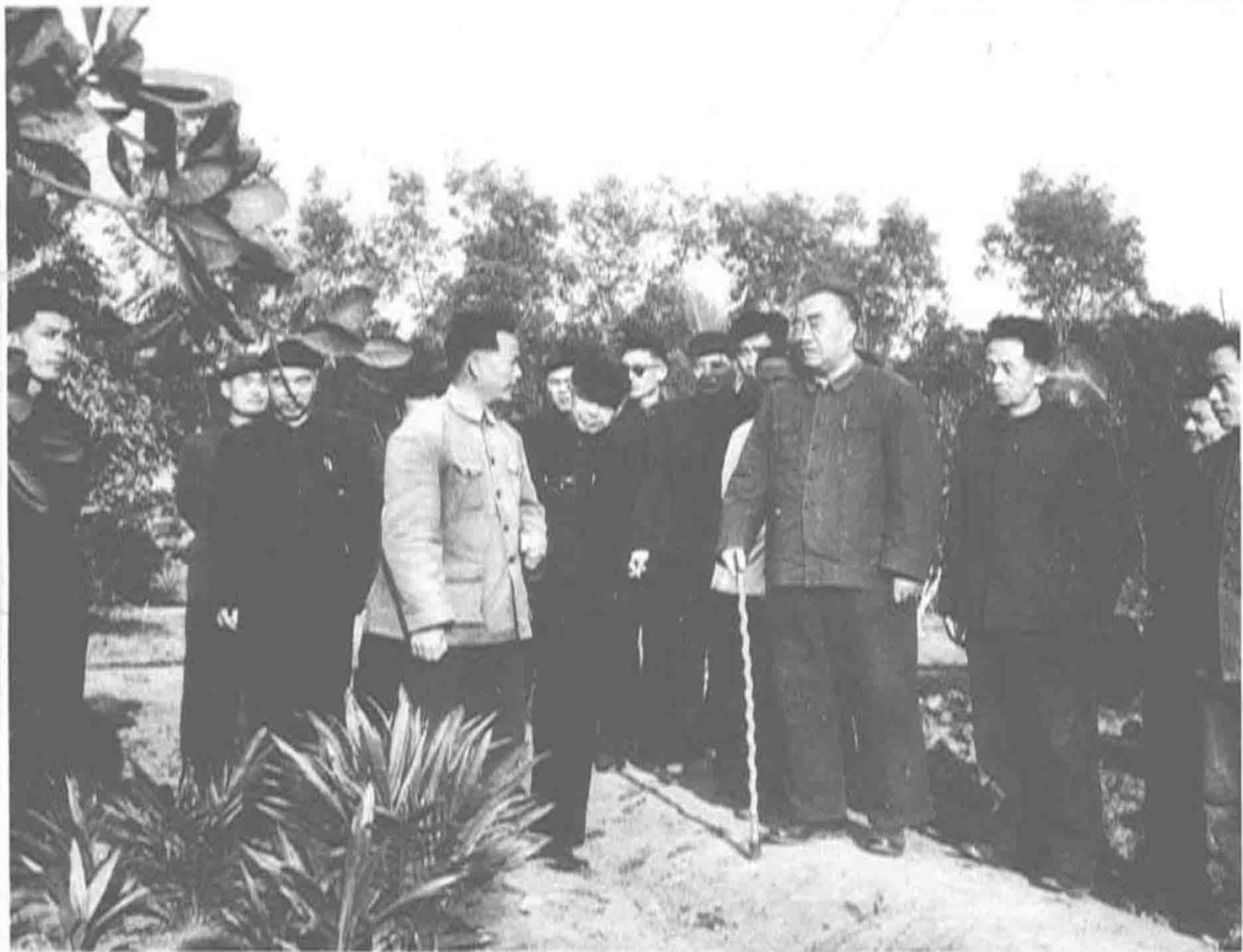
▲ 1957年，中央人民政府副主席朱德视察粤西试验站。