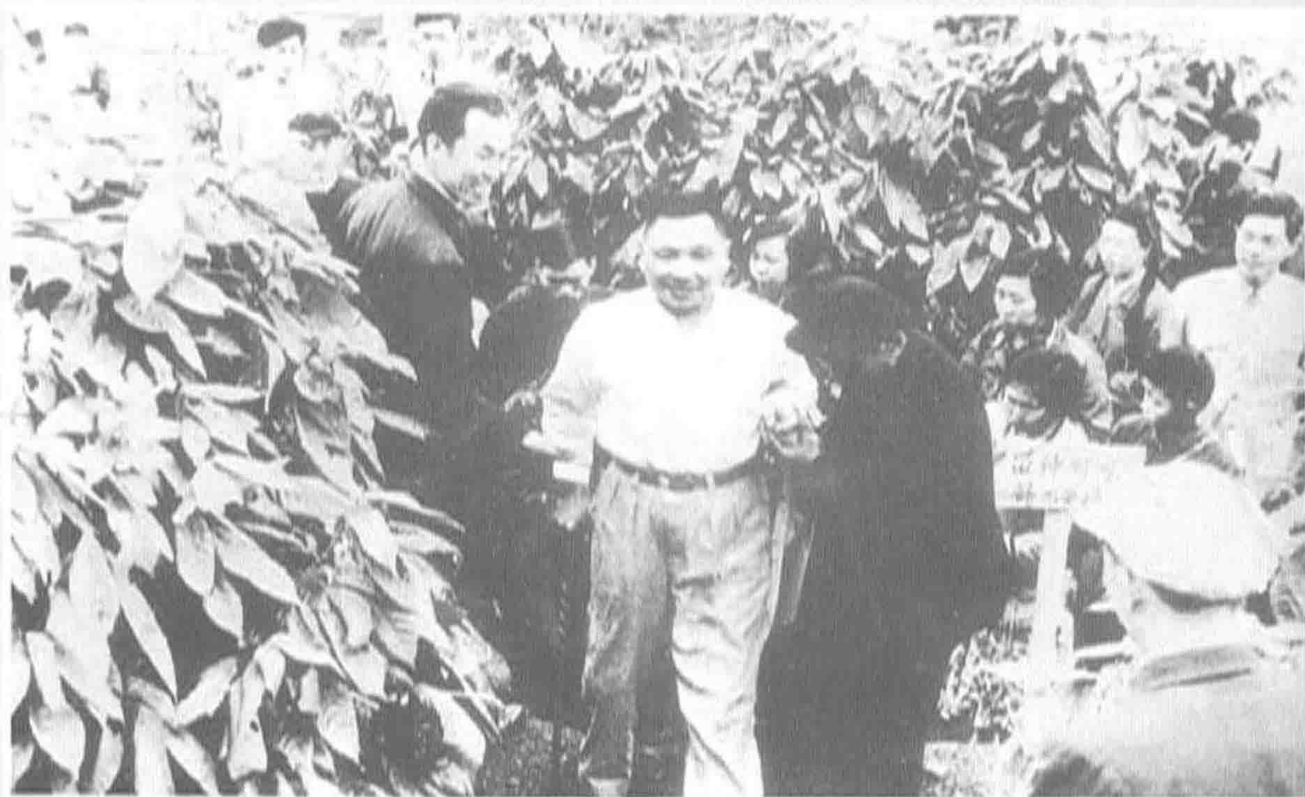
▼ 1961年，中共中央书记处总书记邓小平视察广东垦区咖啡园。