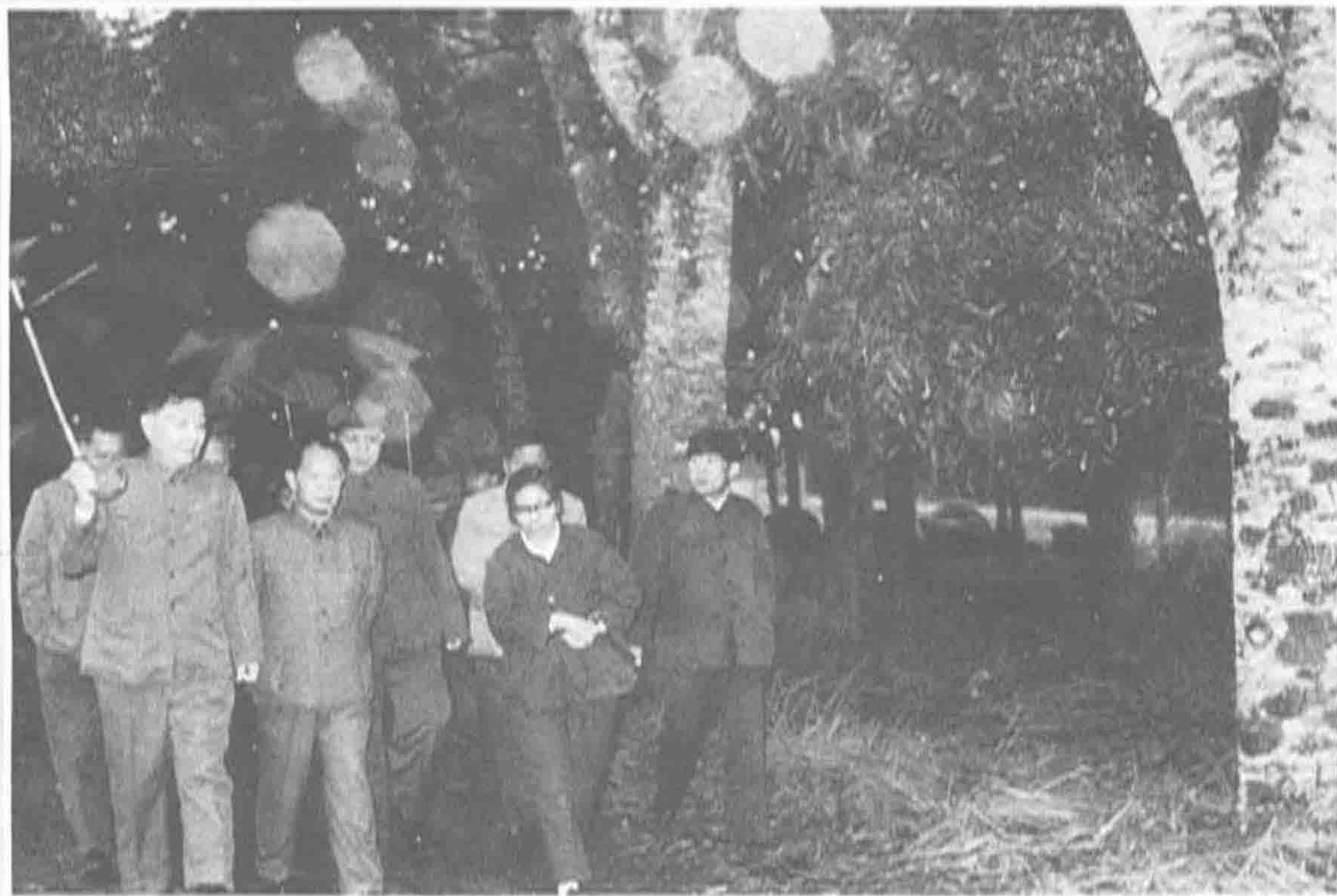
▲ 1983年，中共中央总书记胡耀邦视察广东农垦橡胶园。