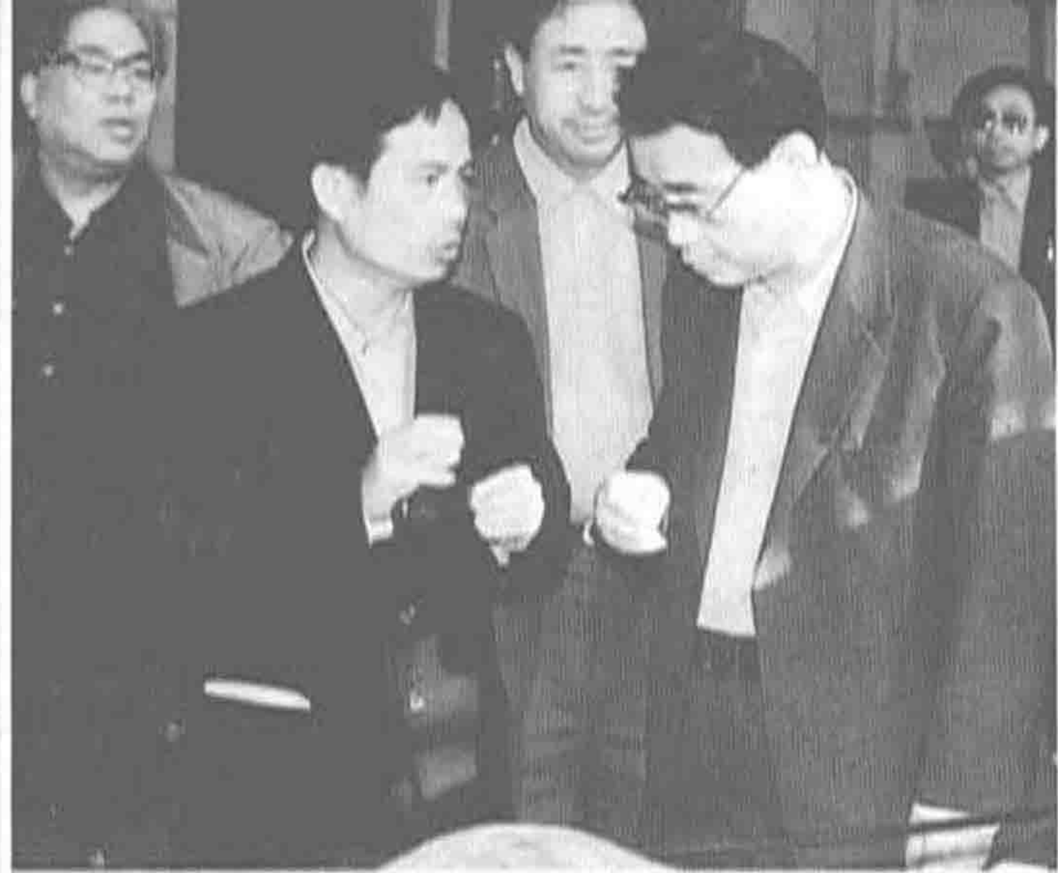
◀ 1986年12月，国务院副总理李鹏视察国营南海农场茶厂。