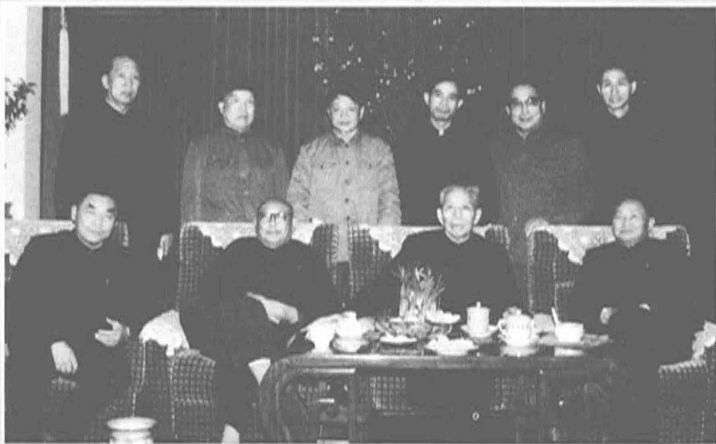
▲ 1984年春节，中共中央政治局委员王震与广东省农垦总局领导成员合影。