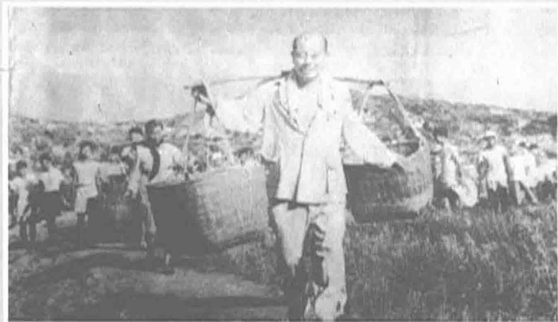
◀ 1959年，广东省省长陈郁在燕塘农场同职工一起劳动。