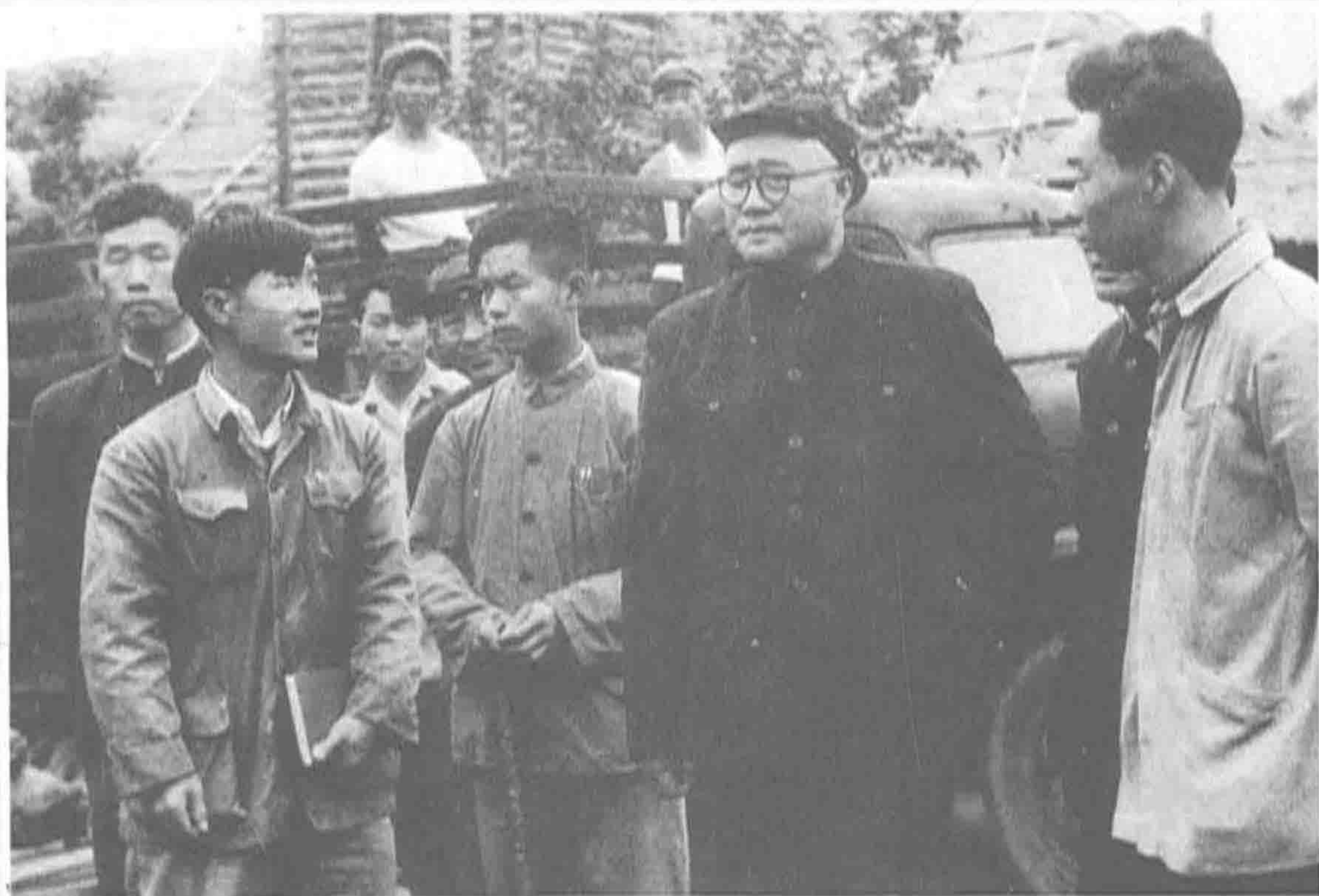
▲ 1957年，刘伯承元帅视察国营红光农场。