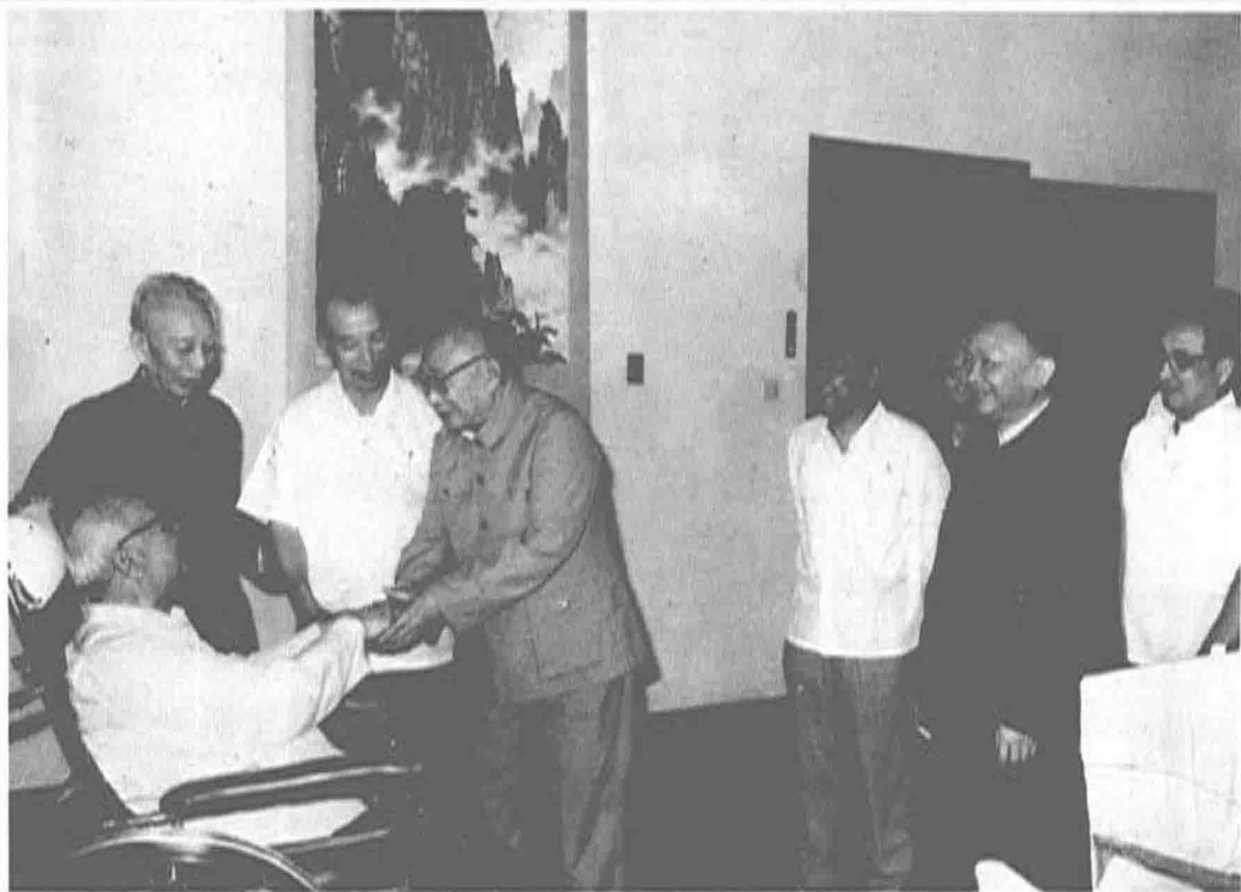
▲ 1983年，全国人民代表大会常务委员会委员长叶剑英，在王震陪同下于广州接见广东省农垦总局领导成员。