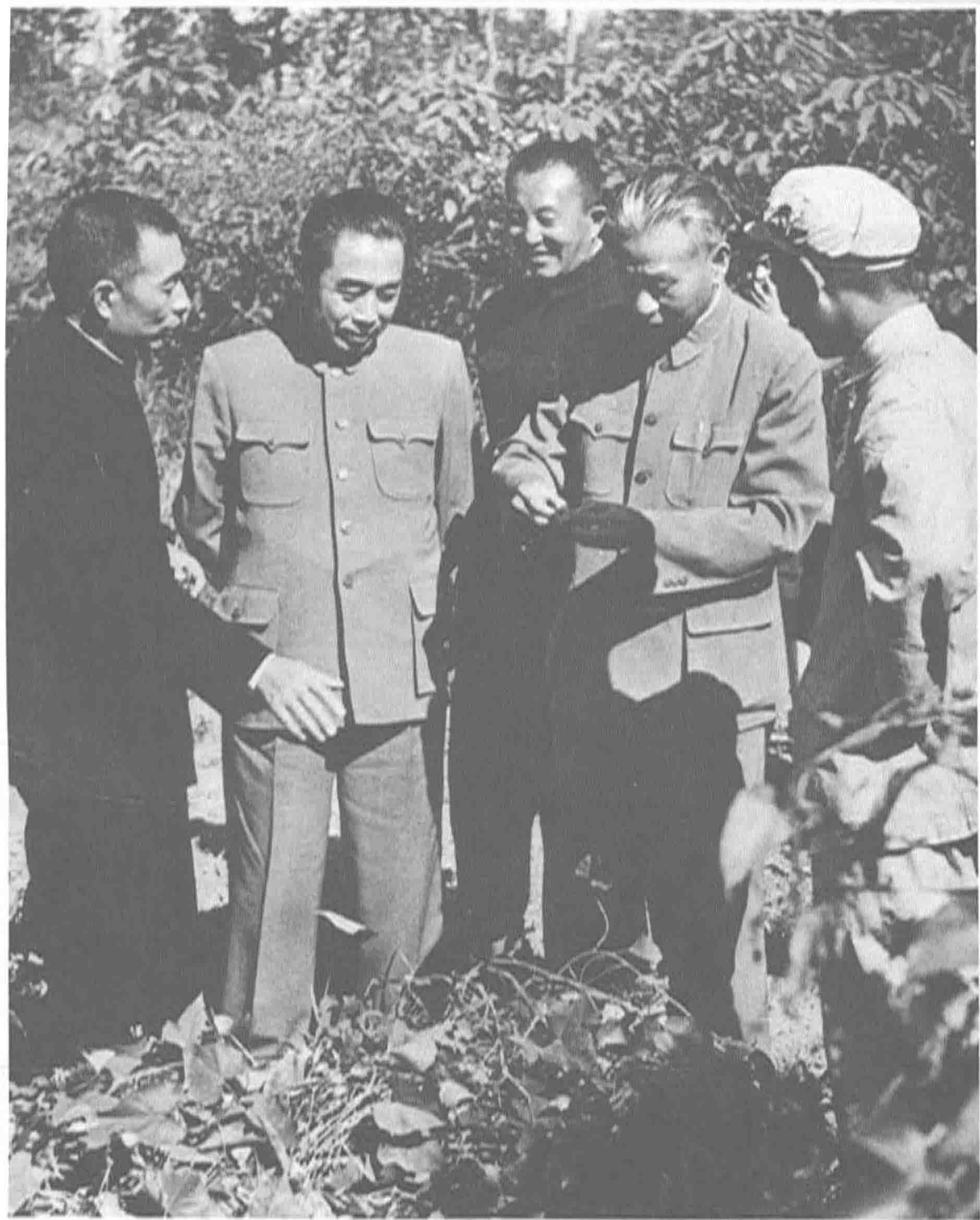
▲国家主席刘少奇、国务院总理周恩来在罗瑞卿大将、中共广东省委第一书记陶铸陪同下，于1959年11月2日视察海南垦区国营农场的橡胶园。