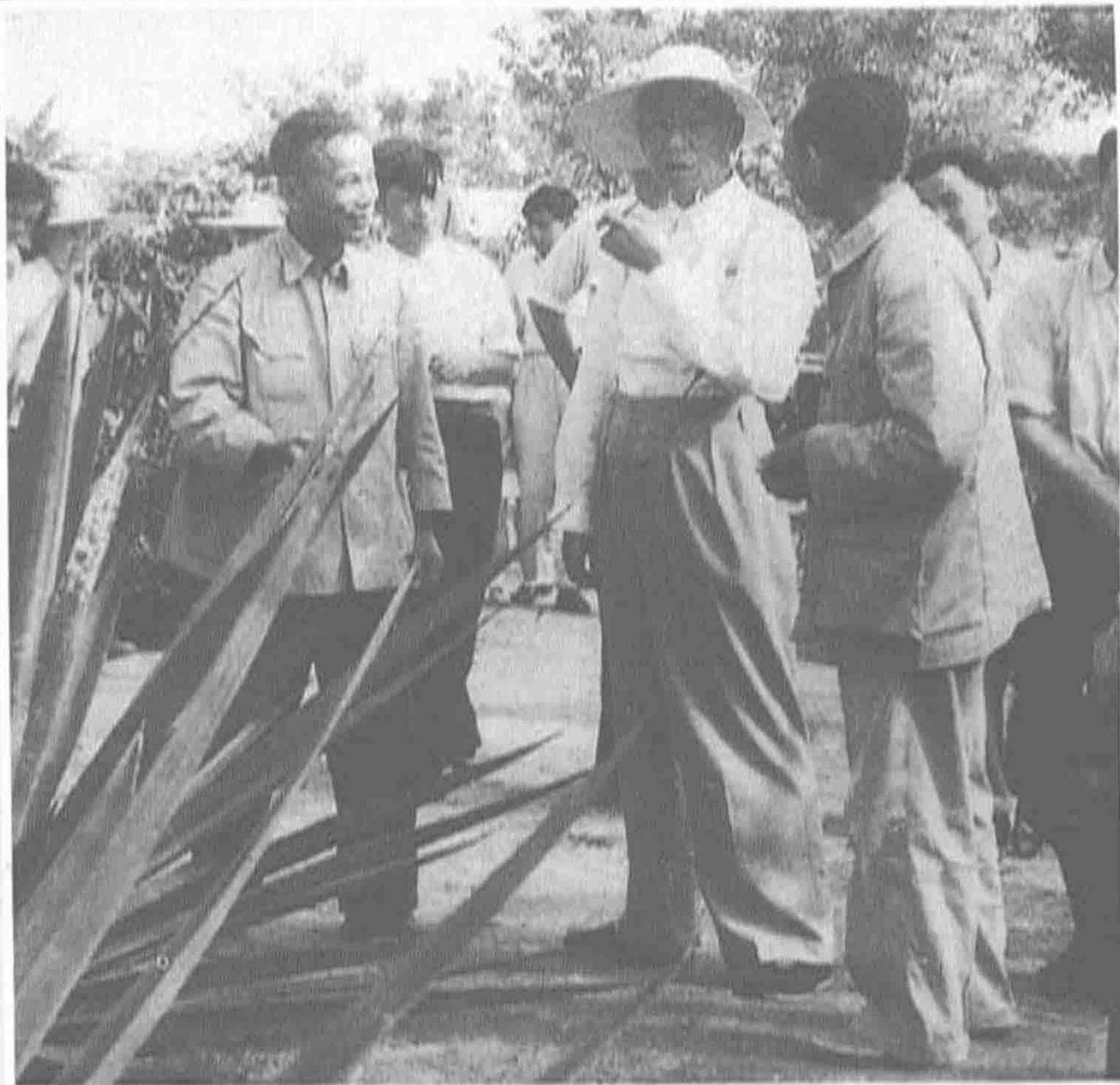
▼ 1960年2月9日，国务院总理周恩来在广东省省长陈郁陪同下，视察国营西联农场。