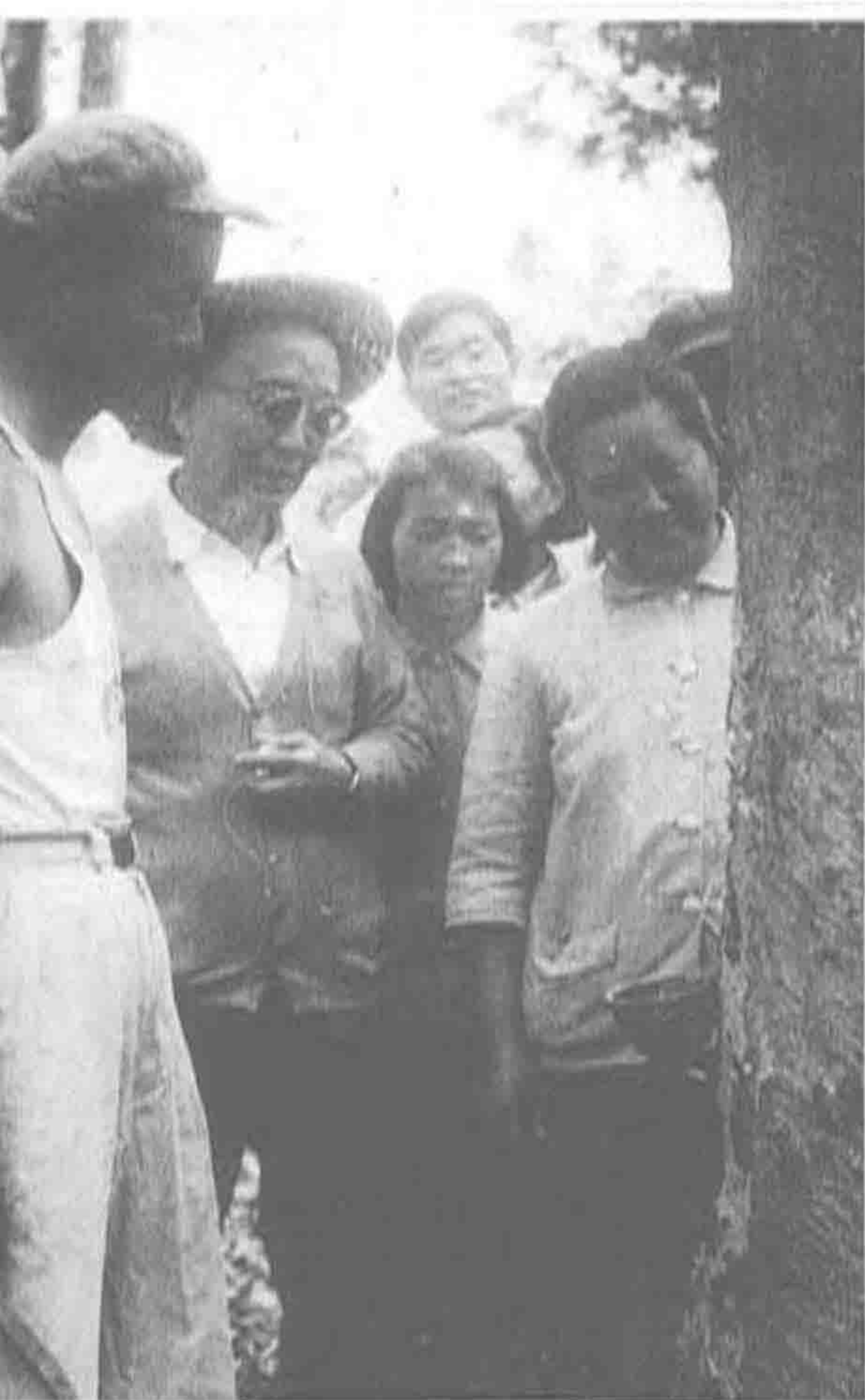
◀ 1961年，全国人民代表大会常务委员会副委员长郭沫若视察广东农垦橡胶园。