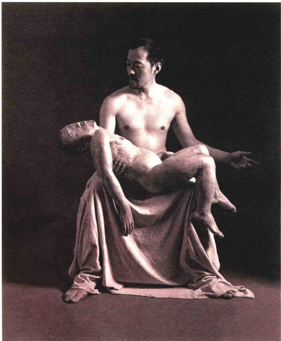
于凡 《怎样向你的童年解释未来》 招贴画 2001