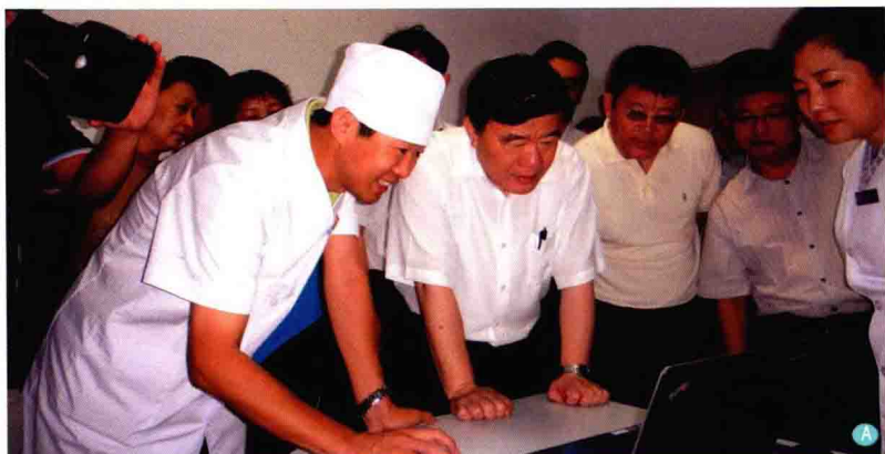
A. 全国人大副委员长、时任卫生部部长陈竺（右4）于2012年7月26日在内蒙古国际蒙医医院心身医学科考察调研