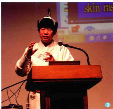
B. 作者等蒙医学专家应联合国人居署邀请在美国考察期间于2013年2月8日受美国石溪大学邀请做学术演讲