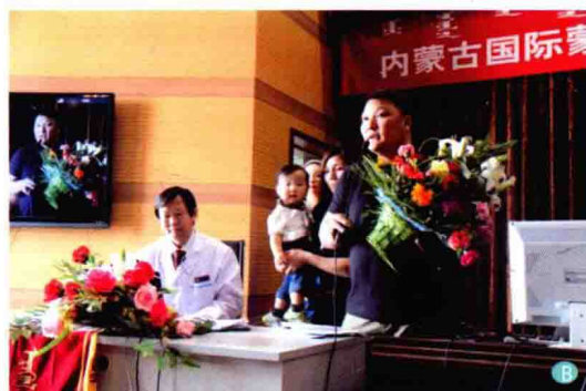
B. 2013年4月30日作者在内蒙古国际蒙医医院做心身互动治疗康复汇报