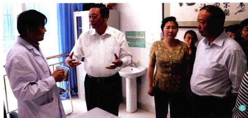
C. 国家卫计委副主任、中医药管理局局长王国强（右3）于2013年5月21日在内蒙古国际蒙医医院心身医学科考察调研