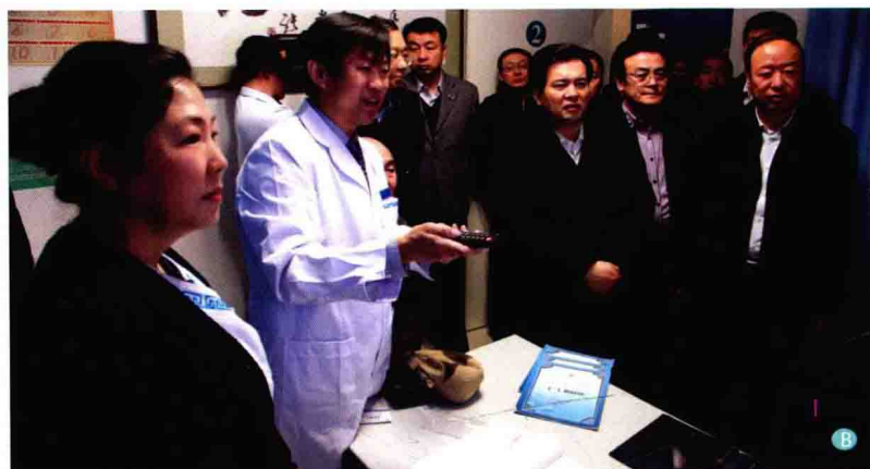
B. 全国政协副主席、国家民委主任王正伟（右3）于2014年2月17日在内蒙古国际蒙医医院心身医学科考察调研