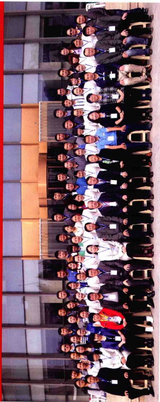
第二期蒙医心身互动疗法实用技术培训（2014年9月28日于内蒙古国际蒙医医院）