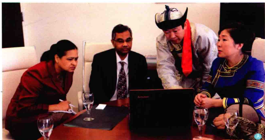
A. 作者等蒙医学专家应联合国人居署邀请在美国考察期间于2013年2月13日受世界卫生组织驻联合国大使库玛艾森（从右第3人）接见并做蒙医蒙药介绍