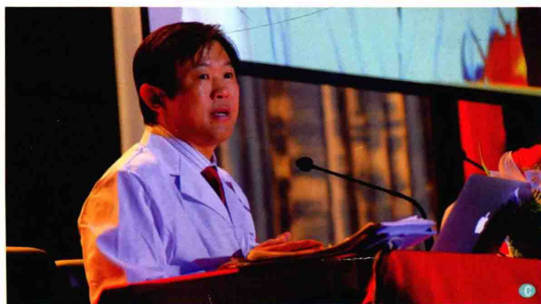
C. 2014年3月28日作者在锡林郭勒蒙医医院做健康教育讲座