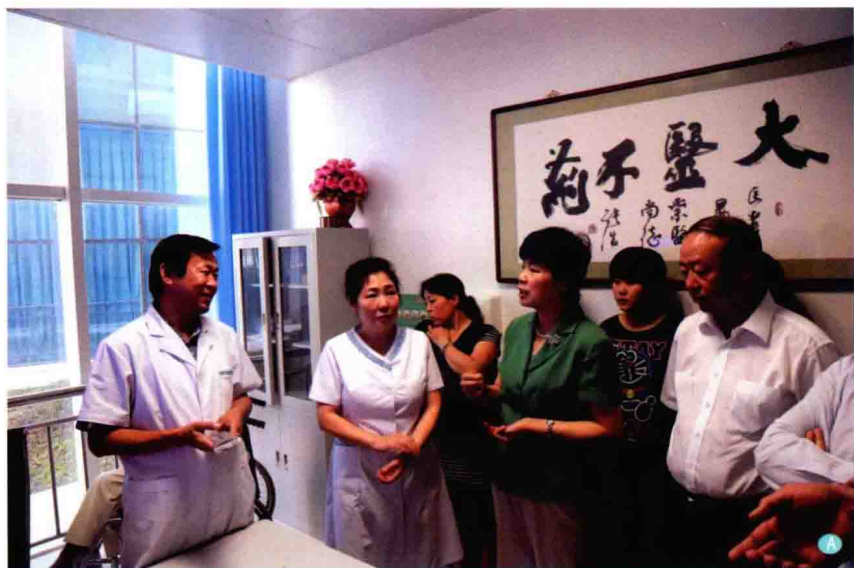
A. 国家卫计委副主任崔丽（前排右2）于2013年8月24日在内蒙古国际蒙医医院心身医学科考察调研