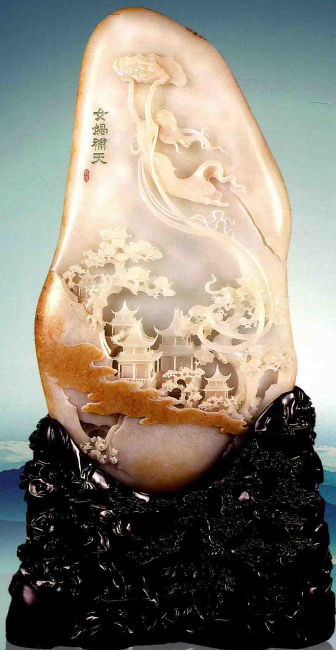
作品名称：女娲补天 作品奖项：2007年天工奖金奖 作者：汪德海