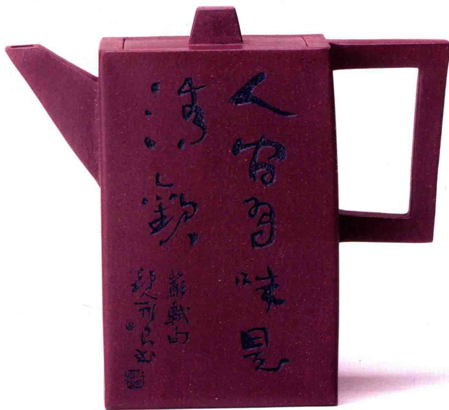
砖方 原矿紫泥 220cc