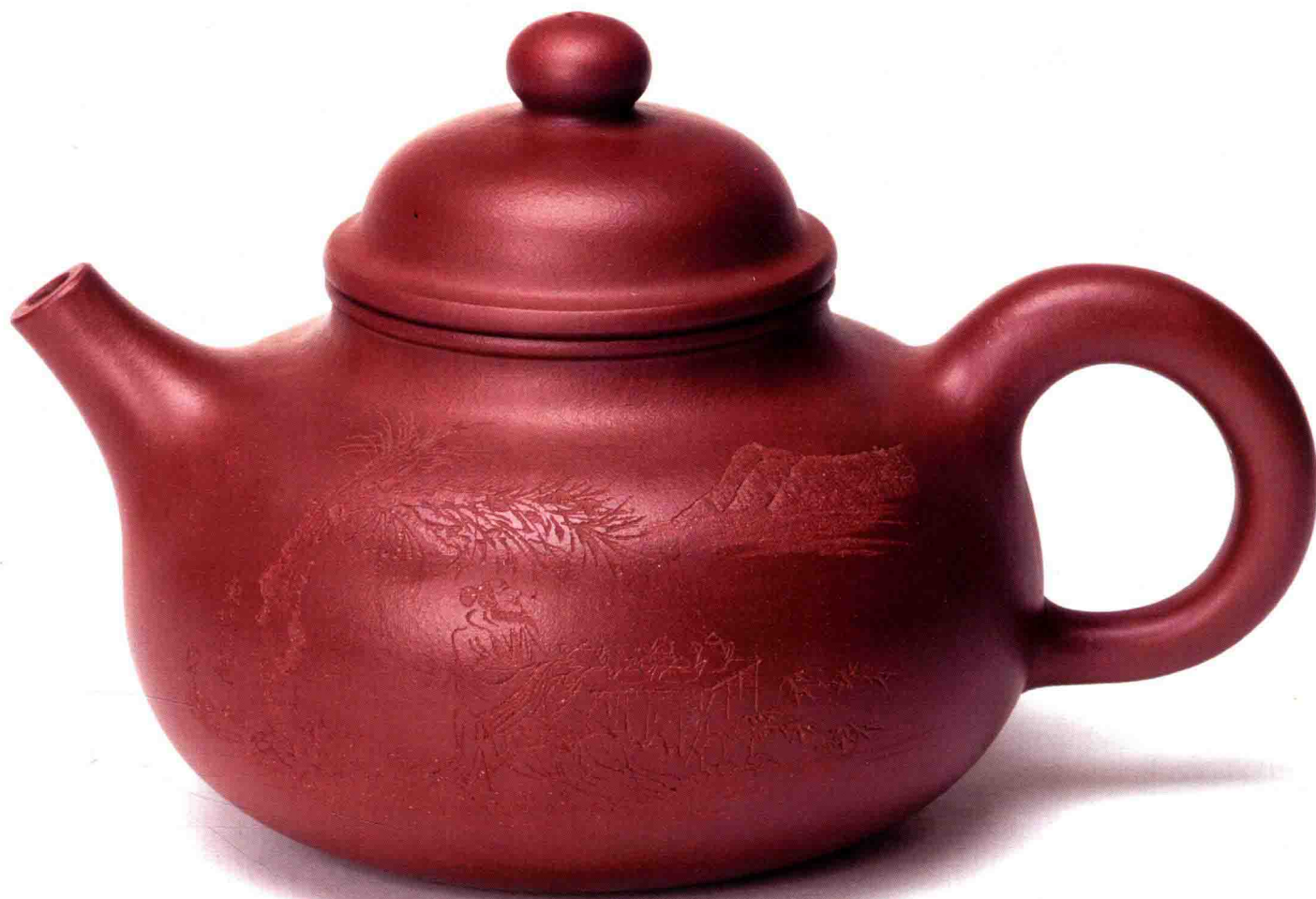
大容天 原矿紫泥 1280cc