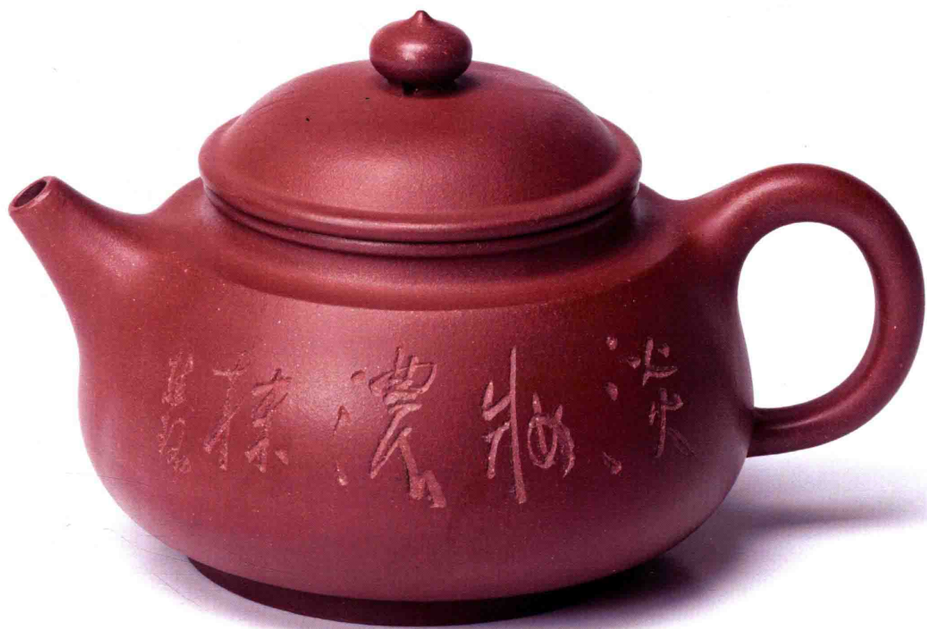
清风月影 原矿清水泥 330cc