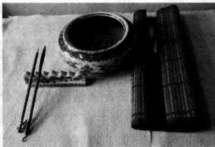
笔洗 笔帘 笔枕