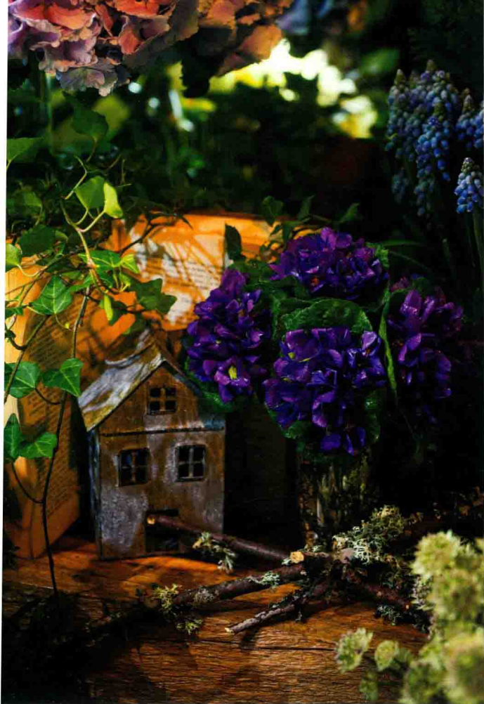
小房子的周围装饰了鲜花、绿植和树枝，呈现出童话中的世界。圣诞节时，让人真想远离现实，徜徉在梦想之国。

塞纳河左岸向学生街中心地区延伸的圣徒佩雷斯街，是世界闻名的古董店街。街道左右两旁的店铺，大都专门販售那些诉说着美好旧时光的古董，穿梭其中仿佛穿越时光，回到了过去。