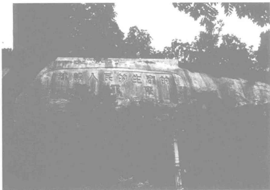
▲ 1951年12月,重慶市人民政府將奮鬥目標——“建設人民的生產的新重慶”鑿刻在重慶市區浮圖關的山岩上。