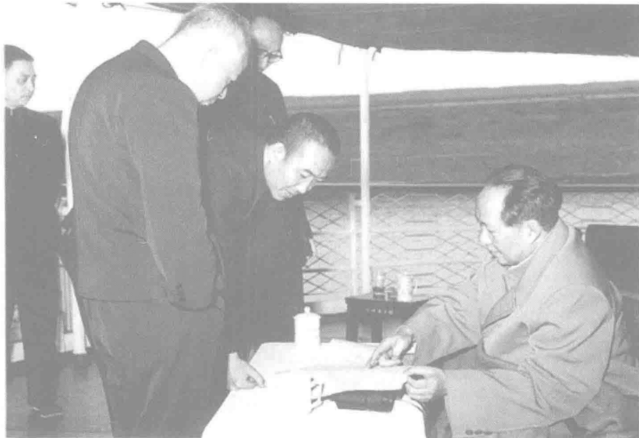
▲ 1958年3月29日,毛泽东视察长江三峡。