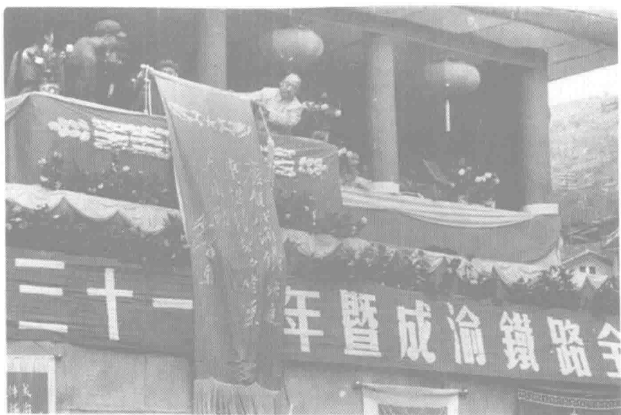
▲ 成渝铁路的建设和投入使用,对改善四川地区落后的交通状况,促进经济社会发展具有重要的战略意义。图为 1952 年 7 月在重庆火车站举行的庆祝中国共产党成立 31 周年暨成渝铁路全线通车大会上,铁道部部长滕代远将毛泽东主席亲笔题写的锦旗授给西南铁路局。