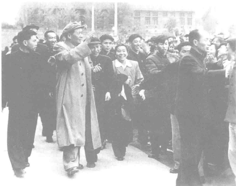
▲ 1958年3月28日,毛泽东视察重庆建设机床厂。