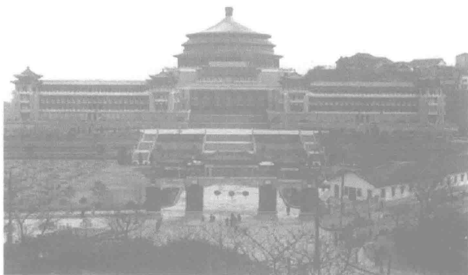
▲ 经济恢复时期,各项事业都得到恢复和发展。图为 1950 年兴建、1953 年建成的西南行政委员会大礼堂(今重庆市人民大礼堂)。