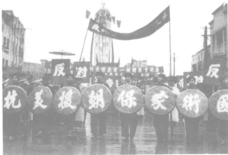
▲ 1950年6月，朝鲜战争爆发，中共中央作出“抗美援朝，保家卫国”的战略决策，重庆人民积极投入全国范围的抗美援朝运动。图为市民在解放碑游行集会。