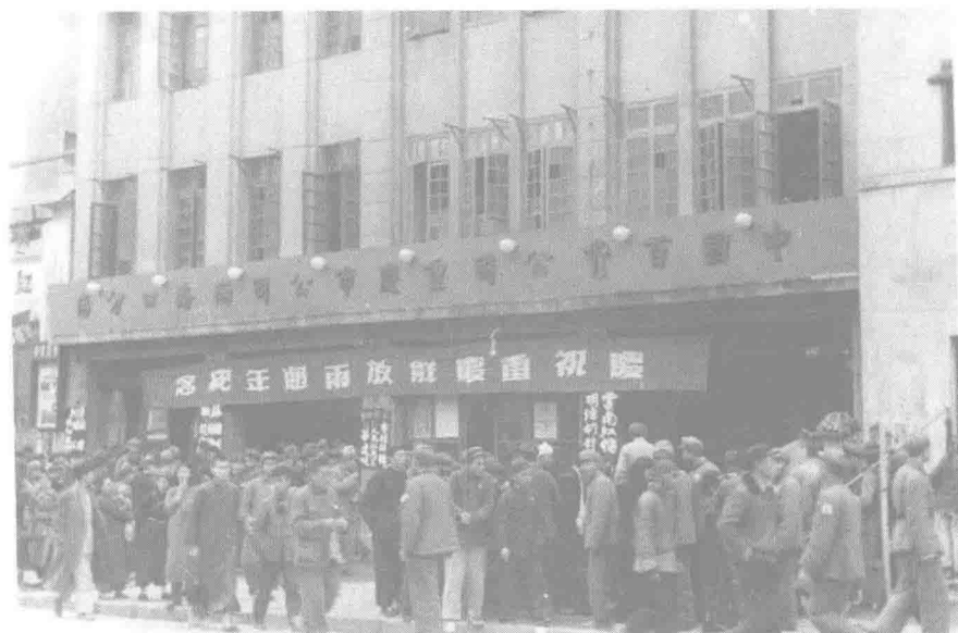
▲ 经过采取统一财政经济、调整工商业、恢复发展农业生产和交通运输、开展市政建设等一系列措施，经济得到恢复和发展。图为重庆市百货公司两路口分店庆祝重庆解放2周年的热闹景象。