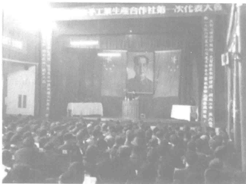
▲ 1954年3月,重庆市手工业生产合作社第一次代表大会召开。