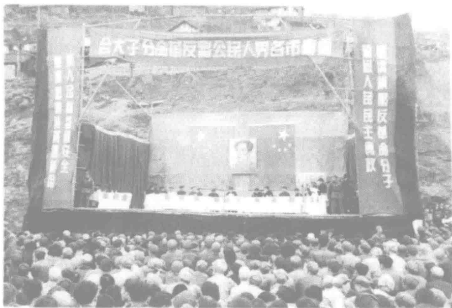
▲ 为巩固新生的人民民主政权，解放初期开展了为期 3 年的镇反运动。图为 1951 年重庆市各界人民公审反革命分子大会会场。