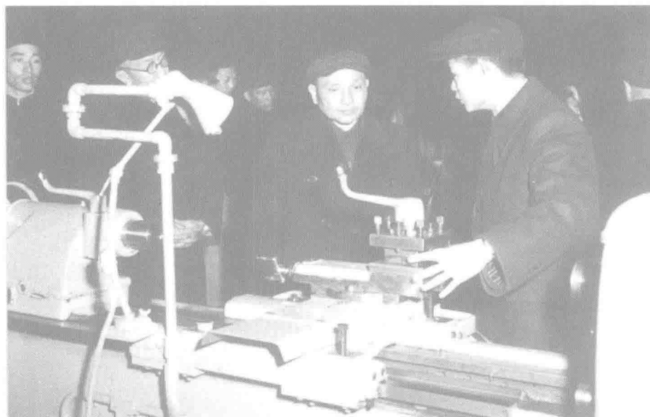
▲ 1965年,邓小平在重庆建设机床厂视察。