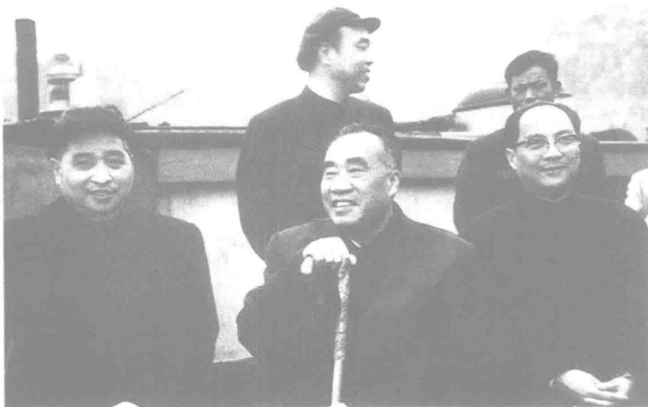
▲ 1963年,朱德在中共重庆市委书记任白戈(左1)陪同下视察重庆。