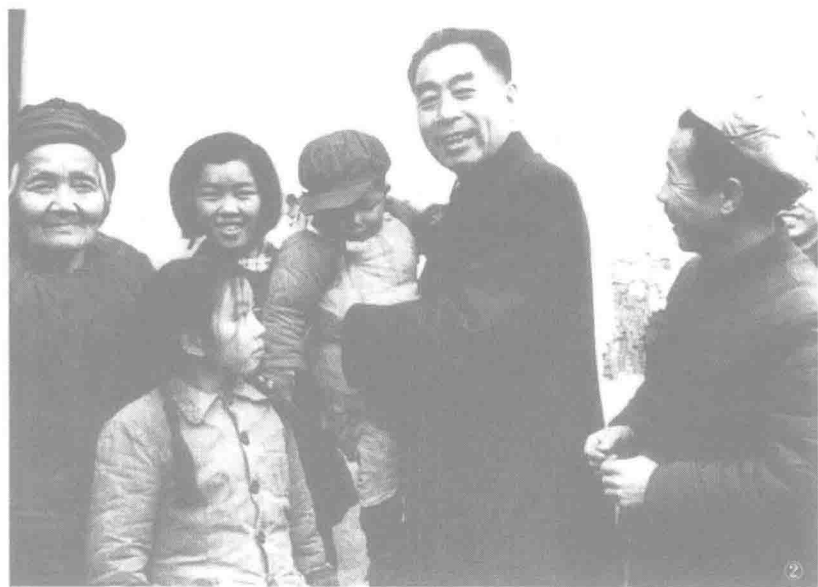
▲ 1957年2月17日,周恩来在重庆钢铁厂职工家里。