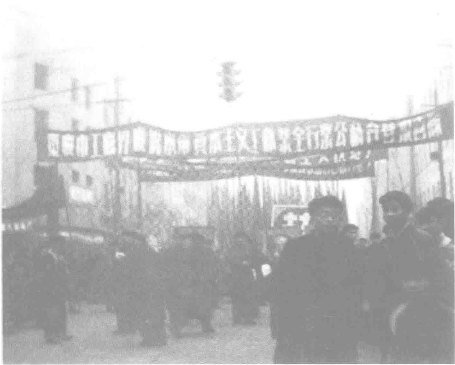
▲ 1956年1月17日,重庆工商界游行庆祝资本主义工商业改造胜利完成。