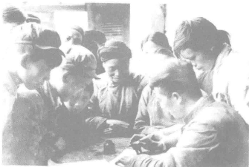
▲ 1953年开始进行农业合作化的社会主义改造。图为北碚三元村农民报名加入农业合作社。