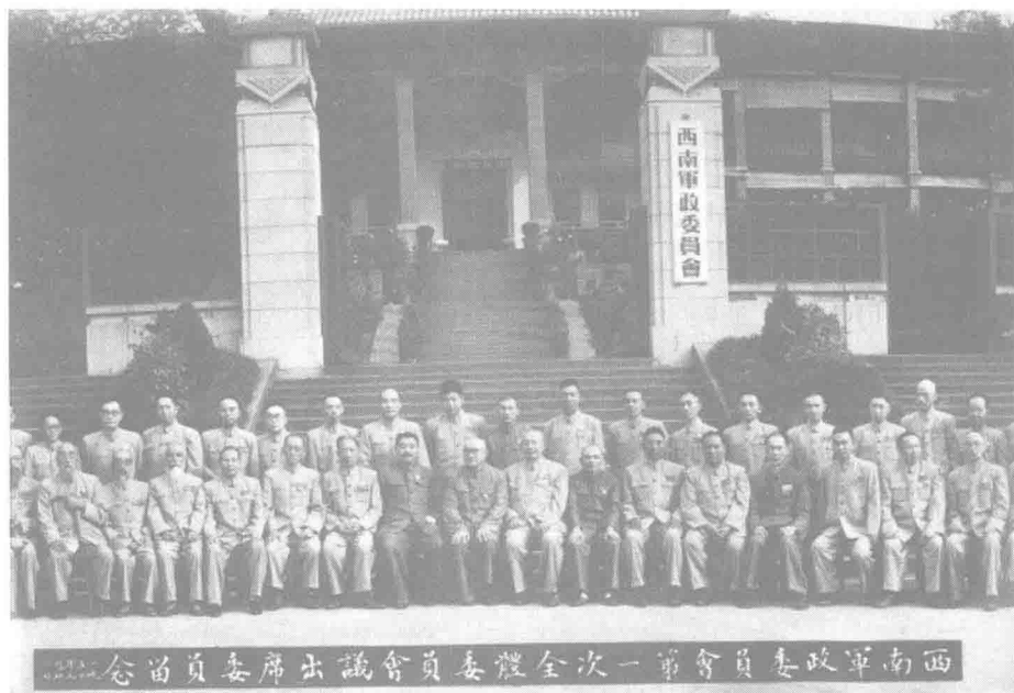
▲ 1950年7月31日,西南军政委员会委员合影。图中前排右7为邓小平,右9为刘伯承,右10为贺龙。