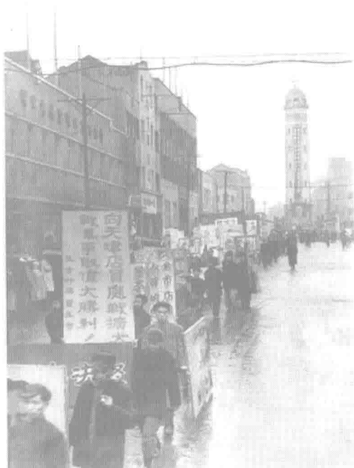
► 1951 年底到 1952 年上半年,全国开展了“三反”“五反”运动。图为重庆工商业工会会员举行“五反”游行。