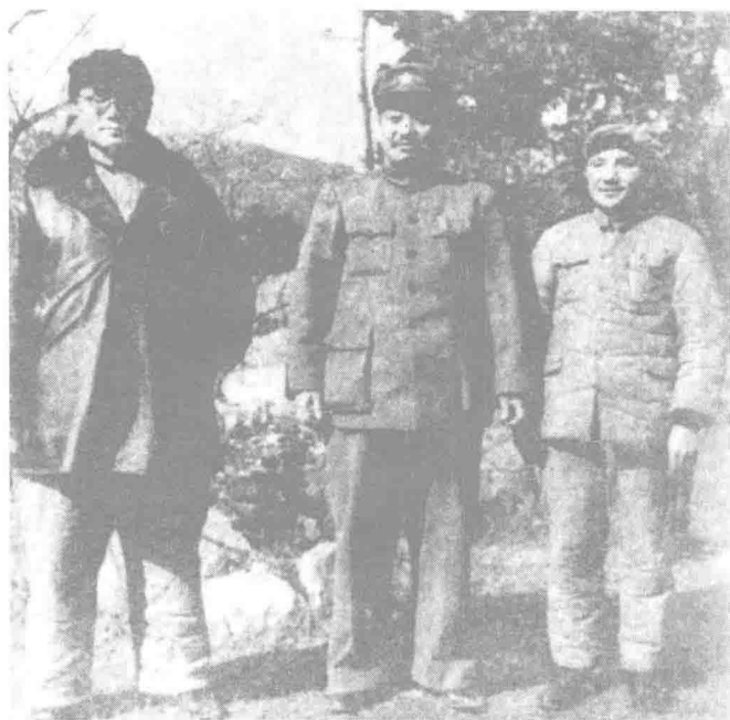
▲ 1950年2月4日,邓小平、刘伯承、贺龙在重庆林园合影。