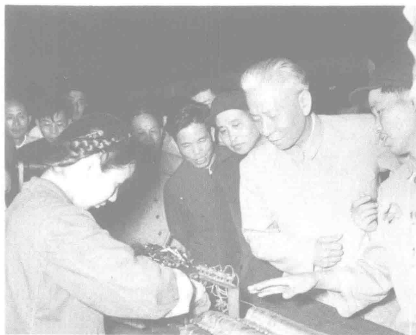
▲ 1960年5月14日,刘少奇视察重庆建设机床厂。