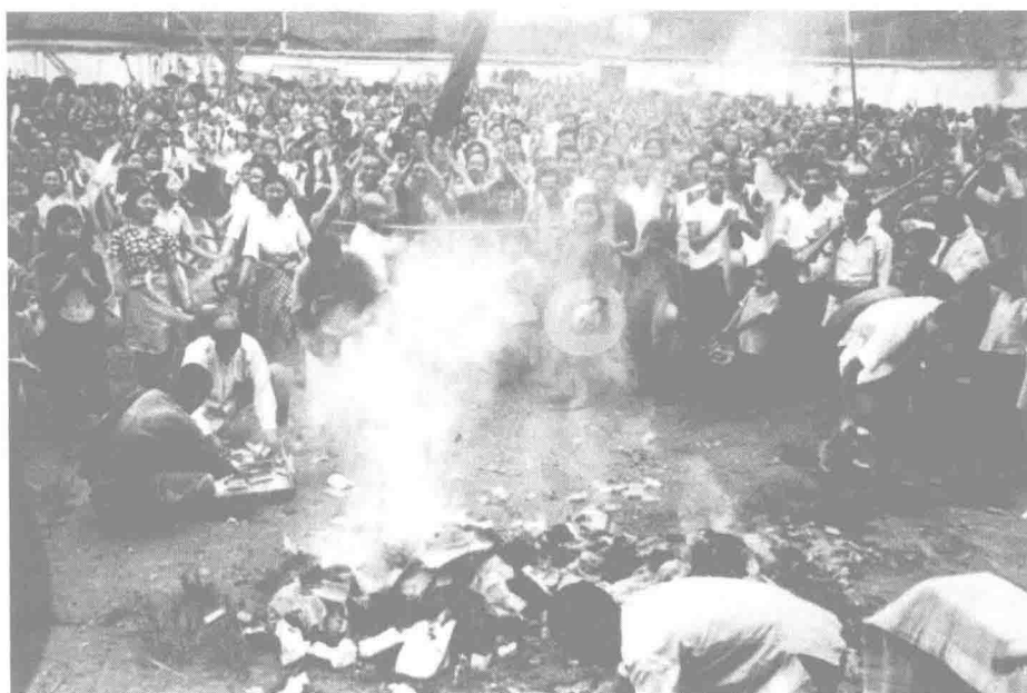
▲ 土地改革运动是新民主主义社会改革的重要内容。图为 1951 年 6 月，合川南屏乡举行土改胜利大会，焚烧地租契约。