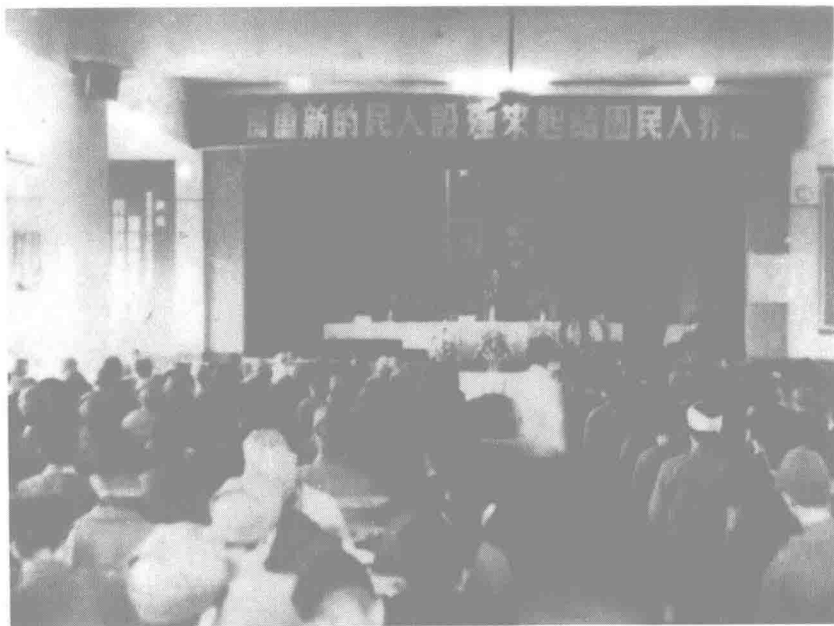
▲ 1950年1月23日至29日，重庆市第一届各界人民代表会议隆重召开，标志着接管工作胜利完成。图为大会会场。