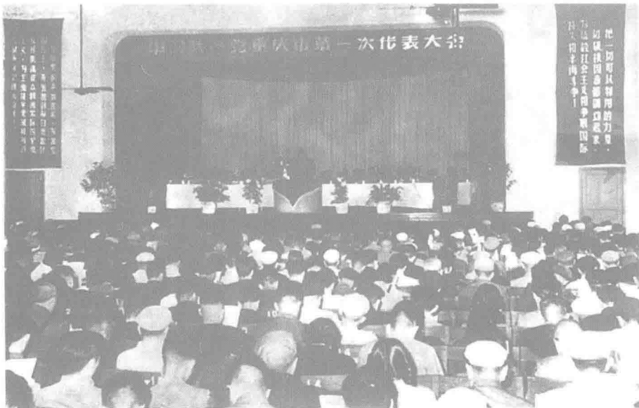
▲ 1956年5月,中共重庆市第一次代表大会召开。大会提出,重庆是一个工业城市,党的领导工作的重心是工业生产。图为大会会场。