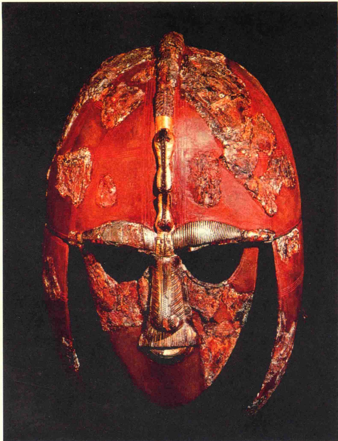
» 日耳曼族的盎格魯—撒克遜人獨行在不列顛群島東海岸定居下來，英格蘭由此而生。 圖中是薩福克郡薩頓胡（Sutton Hoo）古跡發現的武士頭盔，現藏于大英博物館。