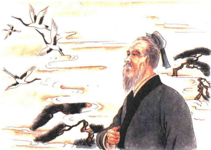
道可道，非常道；名可名，非常名。

道是中国古代哲学的重要范畴。老子是第一个把道作为一种哲学范畴提出和加以阐释、论证的思想家。道作为老子哲学的核心，贯穿其思想体系始终。关于对老子道的认识和诠释，历来众说纷纭。有的认为，道是精神性的本体，是脱离物质实体而独自存在的最高原理，主张老子的道论是客观唯心主义。有的则认为，道是宇宙处在原始状态中的混沌未分的统一体，主张老子的道论是唯物主义。一般认为道是宇宙的本原及万物运行的规律。陈鼓应在其《老子译注及评介》一书中引用杨兴顺的观点，将道的基本特点归结为：一、道是物的自然法则，它排斥一切神和“天志”。二、道永远存在，它是永存的物质世界的自然性。道在时间与空间上都是无限的。三、道是万物的本质，它通过自己的属性（德）而显现。没有万物，道就不存在。四、作为本质来说，道是世界的物质基础“气”及其变化的自然法则的统一。五、道是物质世界中不可破灭的必然性，