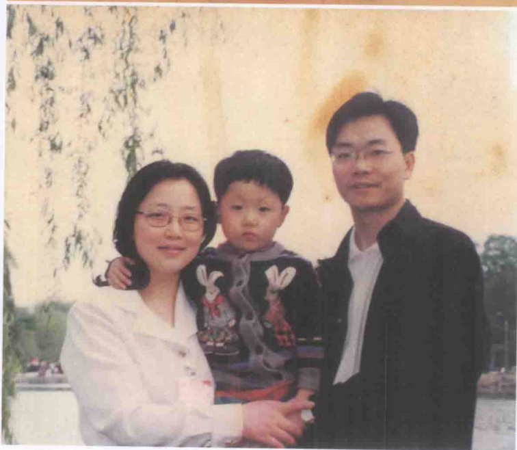
邹碧华与妻儿在北京大学未名湖畔合影