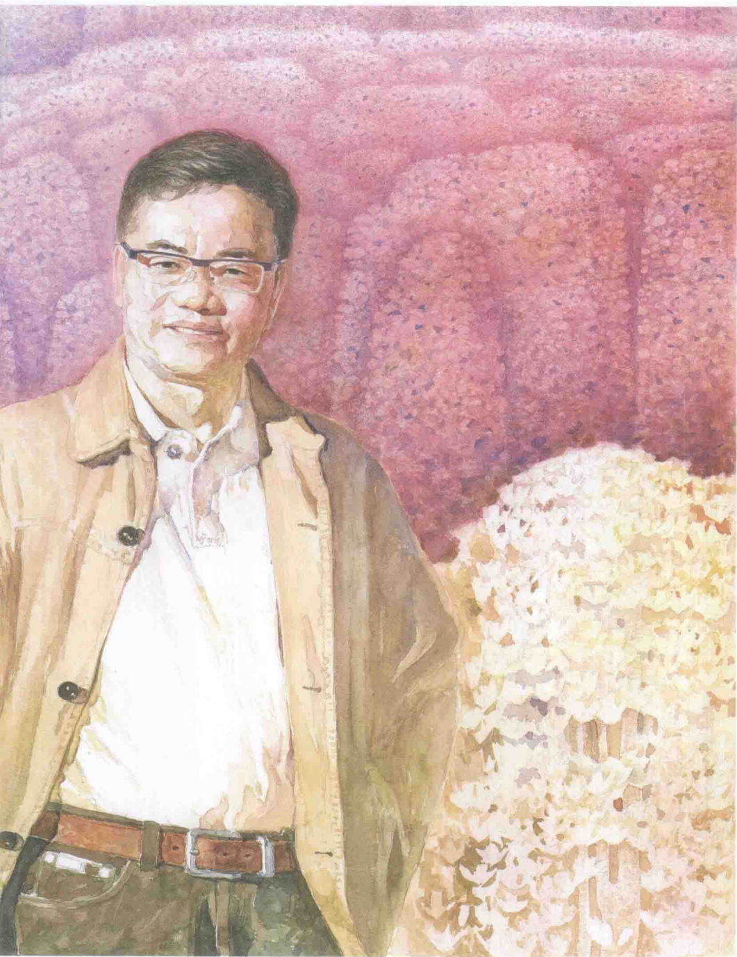
《他在春天里——纪念爱子碧华》 水彩·邹连德