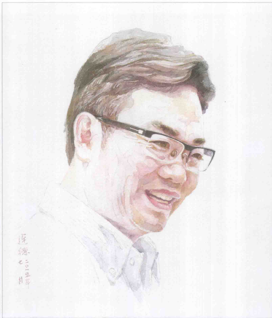
《碧华肖像》 水彩·邹连德