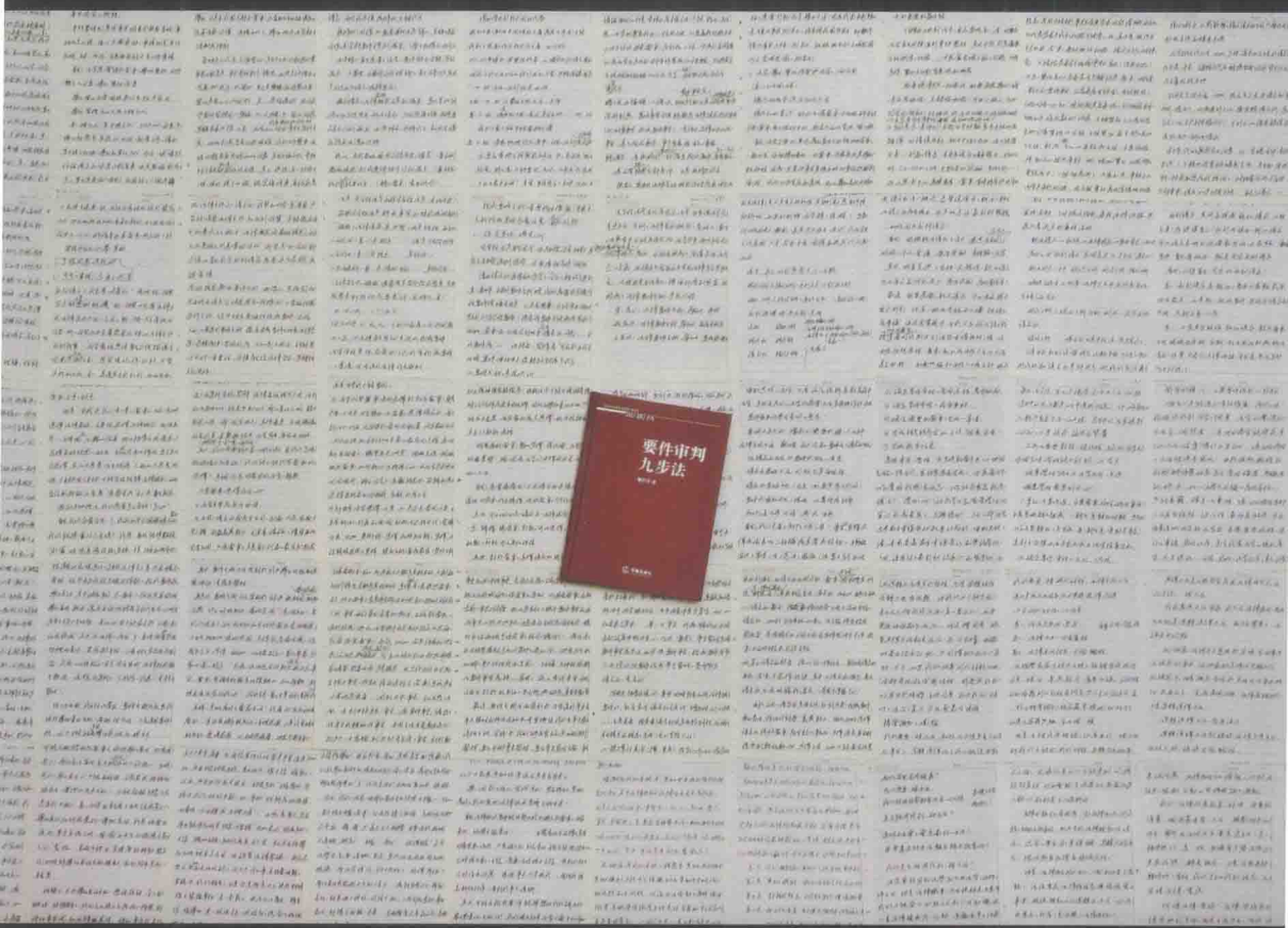
邹碧华生前专著《要件审判九步法》及手稿