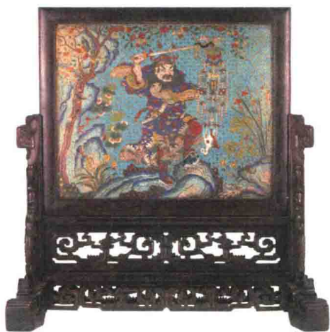
清代 紫檀景泰蓝五毒插屏 高 56.5 厘米 观复博物馆藏

这是一个插屏，插屏上是一个景泰蓝，图案中间的人物是钟馗。插屏是从最古老的家具——屏风演变过来的。最早的屏风是落地的，因为过去是席地而坐的。后来屏风的形制分开了，有大落地屏、折屏、放在炕上的炕屏、搁在桌子上的桌屏等。这件藏品是清代初年的桌屏。最早是为了给砚台挡风，后来逐渐演化成桌上的风景。钟馗的形象唐代开始