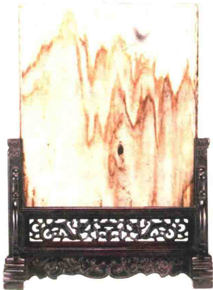
明晚期 黄花梨大理石“月下独行”插屏 高 60 厘米 观复博物馆藏