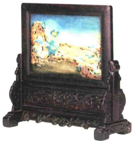
清代 紫檀琉璃画山水人物砚屏 高 27 厘米 观复博物馆藏