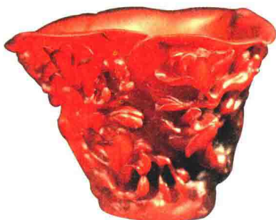
明末清初 玉兰形犀角杯

犀角杯在明末清初非常流行。现在我们加入了《濒危野生动植物种国际贸易公约》，犀牛、大象等都是禁止猎杀的，所有新的犀角、象牙不仅禁止买卖，而且禁止携带。在全世界范围内，买卖犀角或者象牙的交易都受到严格的限制。我曾在美国拍卖会上买了象牙文物，过了半年才运到中国，走完了全部的法律程序，花了很多钱，要求非常严格。古人认为犀角是一味中药，可以解毒，所以不管是用来盛酒还是盛水，古人都觉得喝下去对身体有好处，就做了很多犀角杯。犀角杯各式各样，有山子形的，有各种青铜器形的，更常见的就是这种玉兰形的。这是一个玉兰花瓣，碗心特别漂亮，意境全部表达出来了。底部做得也非常讲究，凹进去的那一块也是随外形走的。上面这一层玉兰雕得非常深，所有的翻转都很清晰，艺术水平非常高。按照过去古董行里的一句话，这就叫“真赛假”，就是说这个东西太好了，看着都像假的。这个犀角杯无疑是明末清初的，它跟一般的犀角杯相比有一点儿不同，颜色属于比较淡的。人是有差异性的，比如同为黄种人，皮肤的颜色有很大的差别，黄种人里皮肤最黑的和皮肤最白的，有天壤之别。动物跟人一样也是有差异性的，犀角也是这样，大部分犀角的颜色都比这个要重一些，在自然光线下看颜色还是非常温润的。