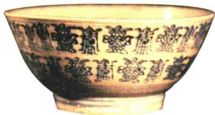
清晚期 青花寿纹碗

这件藏品与鲁迅博物馆的一个大碗很相似，尺寸、大小都一样，碗心、碗壁很接近。鲁迅是伟大的思想家、文学家、革命家，还是一个文物收藏家，《鲁迅日记》上记载他买过很多钱币。这个碗中间有一个圈，圈是涩的而且没有施釉，所以叫涩圈。碗烧造的时候是摆着一个一个地烧的，为了省钱，就在质量上打了折扣。碗如果设施釉很不容易清洁，所以好碗里头一定是有釉的。从这个角度判断，这个碗属于粗瓷大碗。青花的颜色是用一个橡皮戳子印的，上有两个图案，一个表示长寿，另一个寓意团寿，都是“寿”字。这种带有一点装饰的粗瓷大碗是过去民间常用的，清代后期特别常见。以前我去陕北农村的时候还碰到过老乡端着它吃面，就是这么大的碗。这个碗的年份与鲁迅博物馆里的相比，时间长不了多少。青花瓷从诞生以后就是中国陶瓷中的“领军人物”，统治中国陶瓷几百年，所以青花瓷对民间有很大的影响，这个就是北方人烧造的。瓷比较粗糙，不是一个正经的窑口，不是景德镇烧造的，所以感觉质量非常差，有点儿像陶土，但是瓷质尚可。这是民间使用的大碗，鲁迅博物馆有一个，这儿有一个，估计这俩是一对。里面的图形不是字，是“天书”，就是象征意义的戳子，是为了好看，也是为了区分。一看就知道这个窑是某人烧的，就是一个画押。这件东西是有100多年历史的粗瓷大碗。