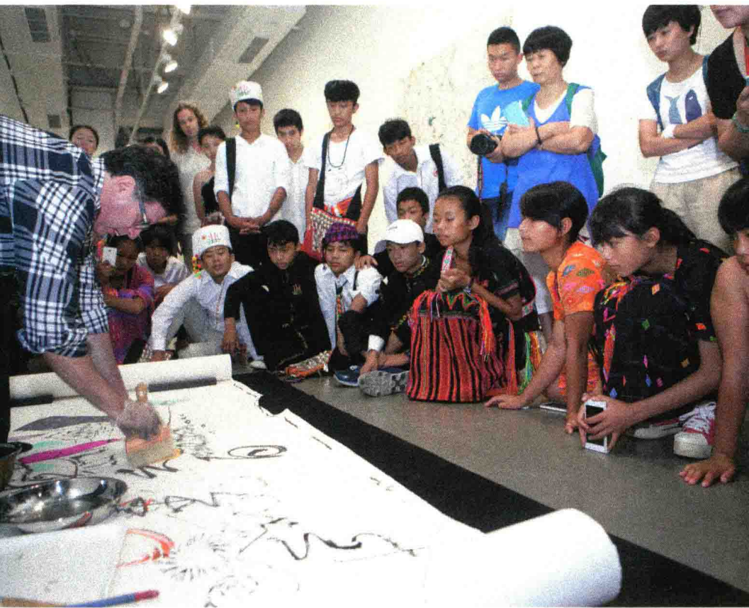
2015年8月,北京今日美术馆,美国艺术家李如侠在向孩子们演示如何用绳子作画

当然,来到大都市,孩子们也看到了自己身上的不足,那是城乡文化发生激烈碰撞之后带给他们的启迪和思考。