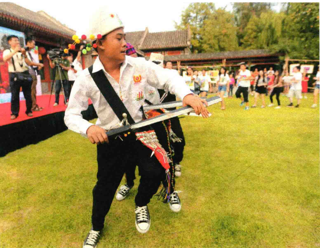
2015年7月，北京宋庆龄故居，孩子们带领观众一起跳目瑙纵歌

有1101名支持者在线参与，筹得14万元，再加上线下个人、企业及基金会的资金、物资及场地捐赠，18个景颇孩子终于来到了北京。