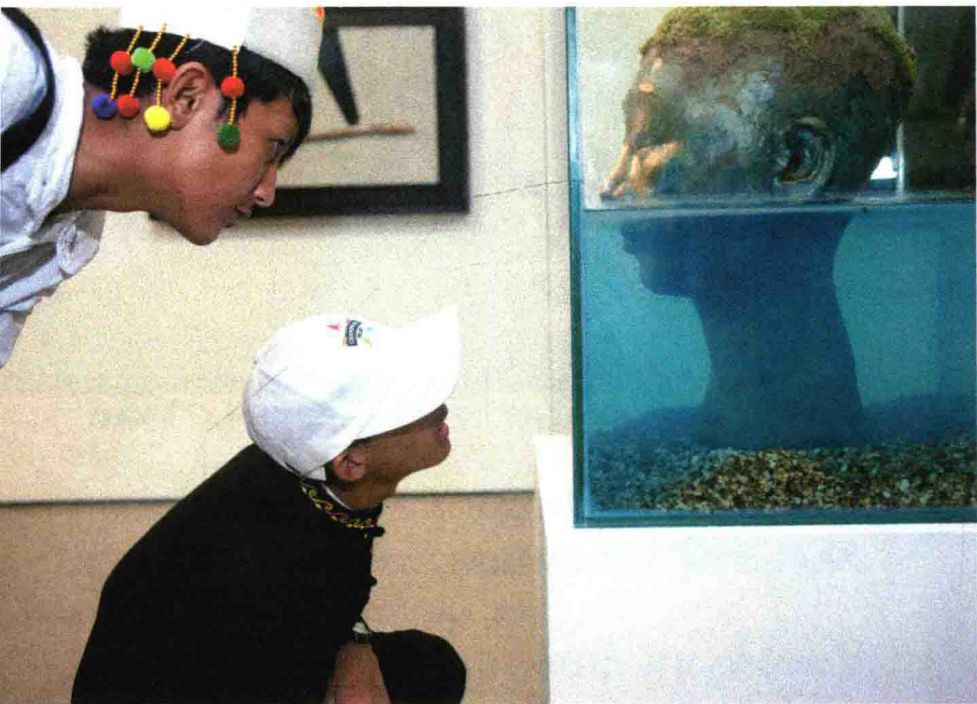
2015年8月，北京今日美术馆，两个景颇孩子在看雕塑

舞台上，孩子们是焦点。他们穿着景颇华服，表演歌曲、街舞和民族刀舞……成为这场盛大演出的主角。这在孩子们人生中还是