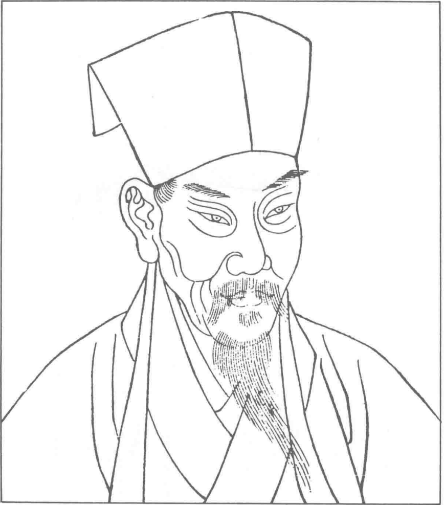
圖一 蘇文忠公真像（王文誥摹刻）