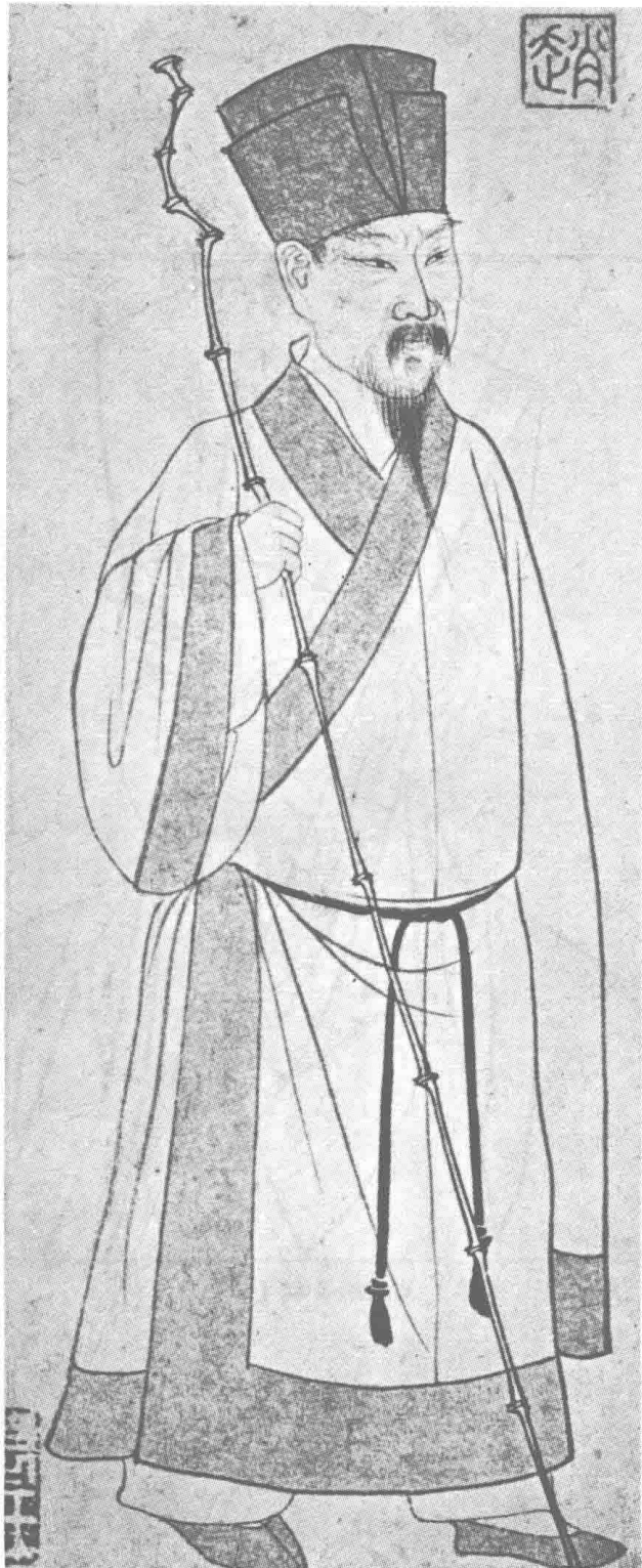
圖二 元·趙孟頫畫蘇軾立像 頭戴蘇軾首創之「東坡巾」，是一個方型帽筒， 外有低矮之上折檐。