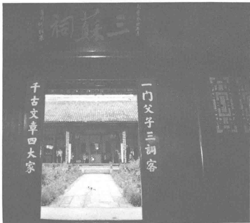
圖四 蘇氏故居（眉山三蘇祠）