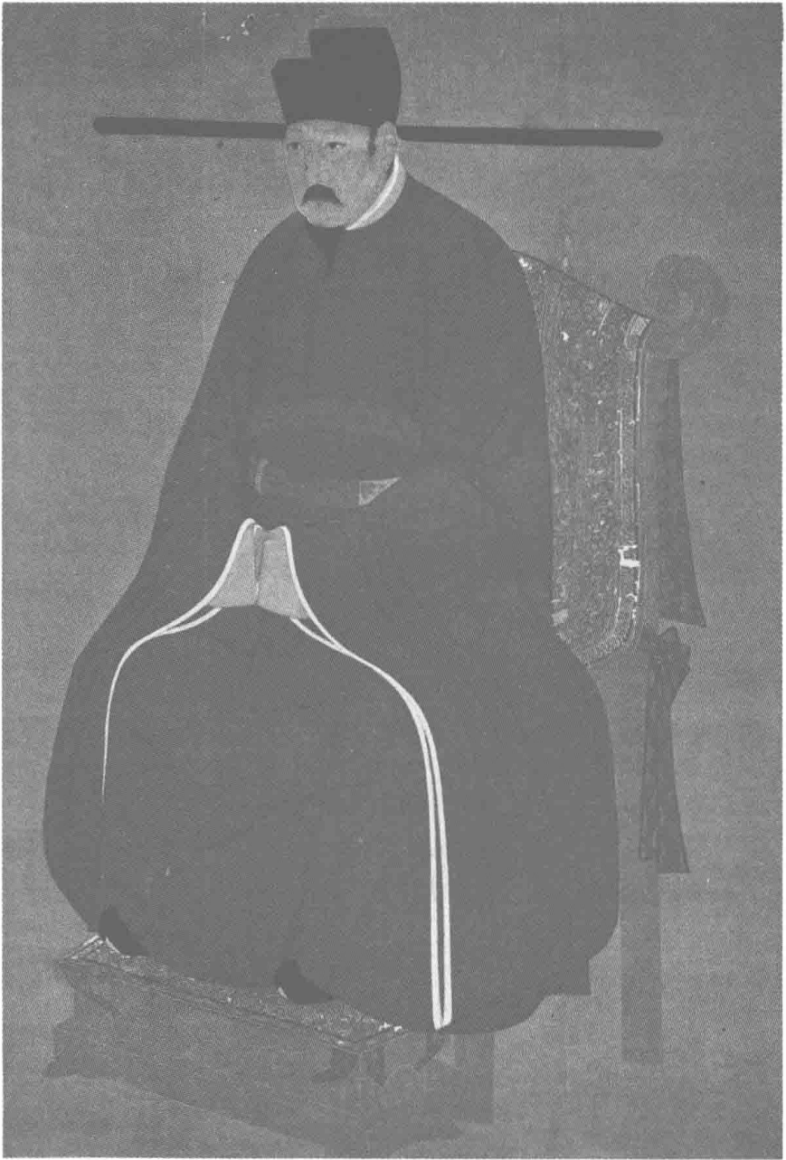
圖六 宋仁宗皇帝像