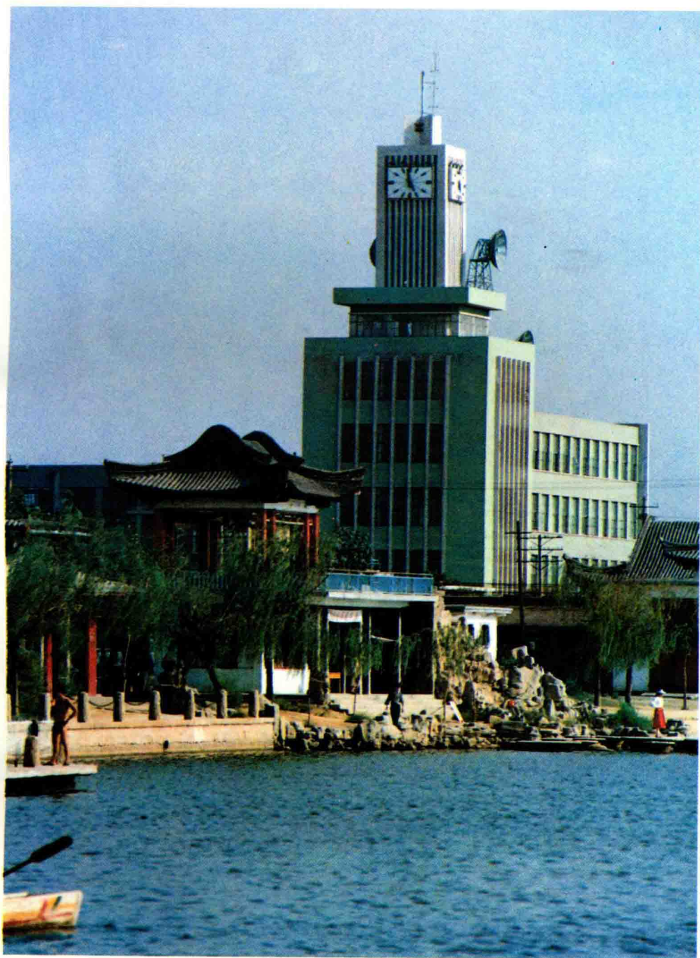
▲ 德州地區郵電局電信大樓遠眺