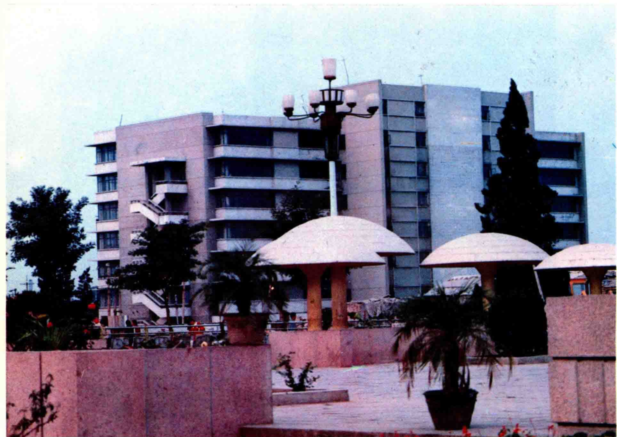
▲德州地區郵電局郵政大樓遠眺