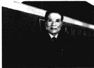
▲ 1999年10月1日国庆五十周年，本书作者在天安门观礼台留影。