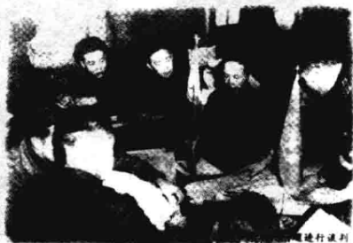
▲ 1953年7月，朝鲜停战谈判双方参谋人员就军事分界线划分问题进行谈判。正面左起第一人为本书作者，背面为美方代表。