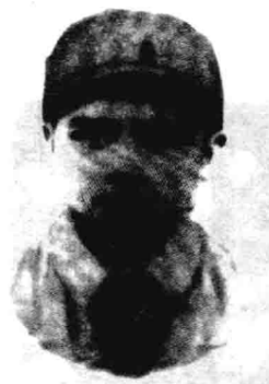
▲ 1938年2月，本书作者10岁，在山西省昔阳县参加八路军时留影。