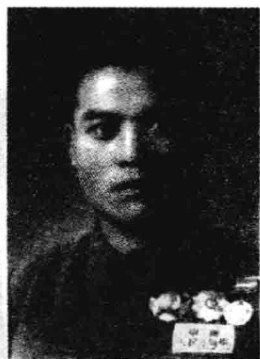
▲ 1950年10月，本书作者参加中国人民志愿军，于朝鲜开城留影。