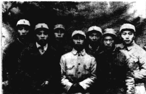
◀ 1945年8月抗日战争胜利后与战友在邯郸合影。前排左起第一人为本书作者。