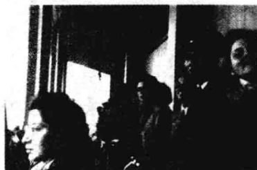
▲ 1956年5月，本书作者(右起第二人)应邀出席捷克斯洛伐克国庆阅兵观礼留影。