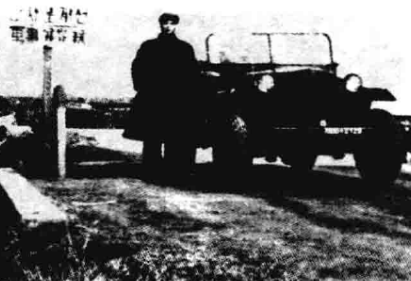
▲ 1953年7月，本书作者于朝鲜军事分界线留影。