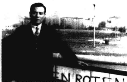
▲ 1976年8月，本书作者在德国“柏林墙”留影。