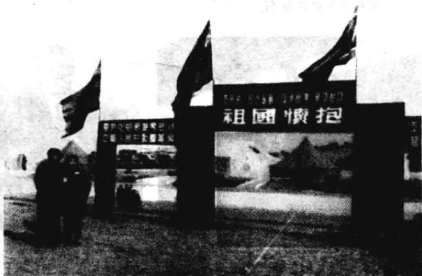
▶ 1953年4月，本书作者夫妇在朝鲜板门店“祖国怀抱”彩门前留影。