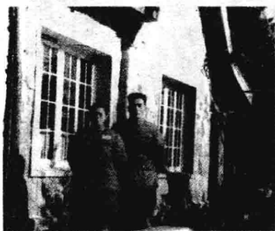
▲ 1954年中秋节，本书作者夫妇在朝鲜停战谈判代表团驻地结婚留影。