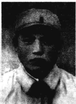
▲ 1945年8月抗日战争胜利后，本书作者在河北武安县留影。