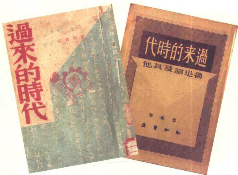
《过来的时代》，1946年初版；1948年再版