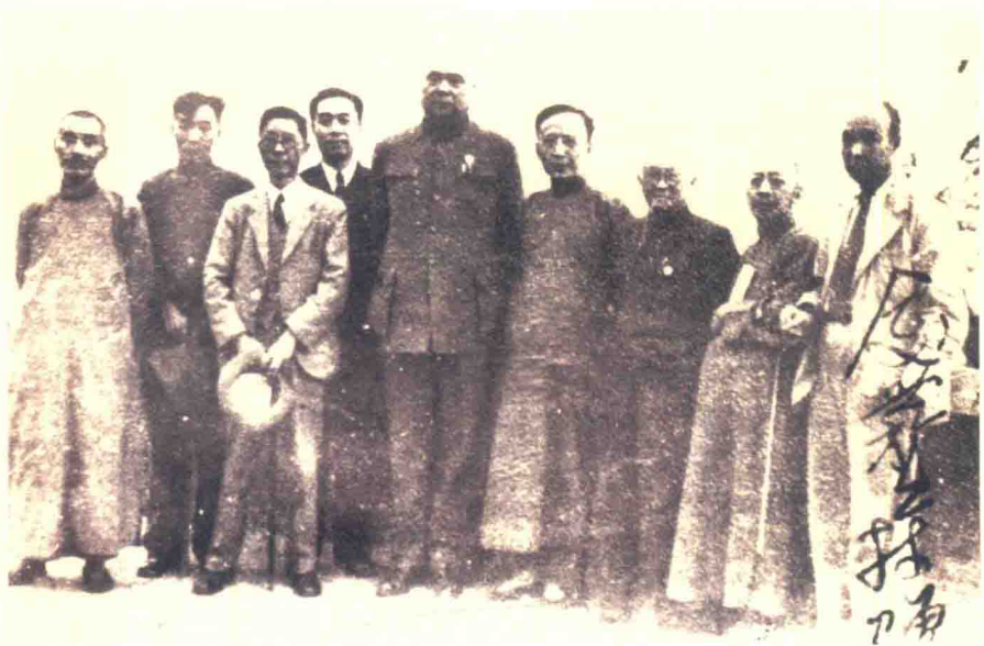
1945年鲁迅逝世九周年纪念大会主席团成员在重庆合影（自左向右：叶圣陶、冯雪峰、老舍、周恩来、冯玉祥、郭沫若、邵力子、柳亚子、胡风）