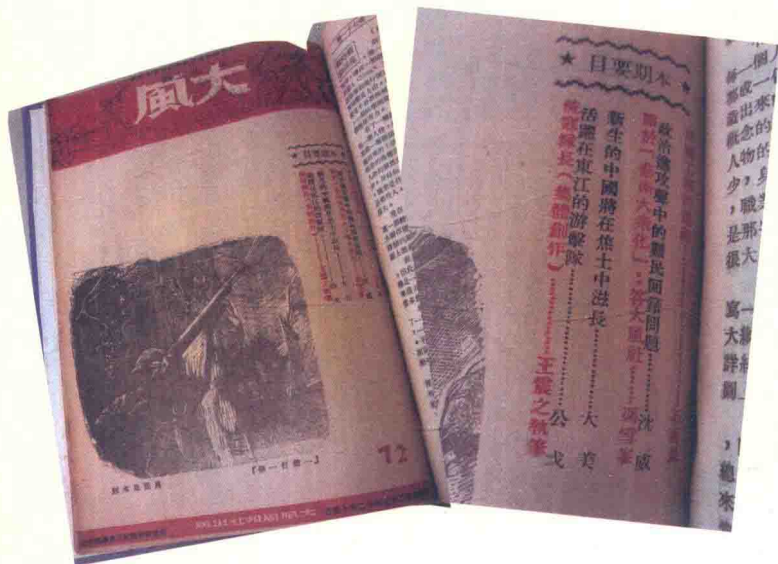
冯雪峰《关于“艺术大众化”——答大风社》发表于1938年12月《大风》周刊