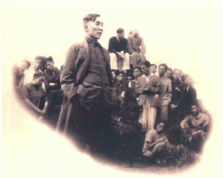
1946年鲁迅逝世十周年时，冯雪峰在上海鲁迅墓地演讲