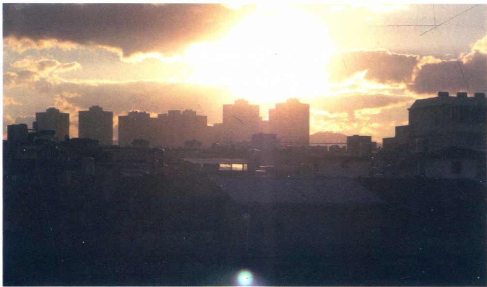
◇玉溪的清晨，这般的静