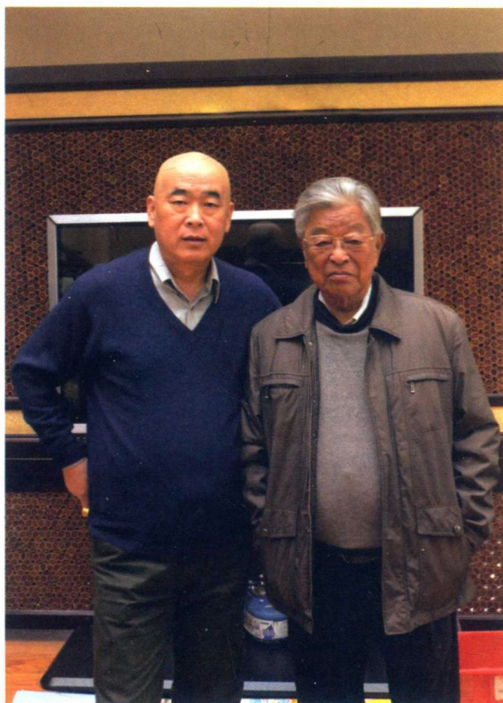
◇ 2014年11月23日，褚时健（右）与作者摄于其家中

“如果你认为人生是各种突如其来的事件之组合，那么你就错了。在人的头脑里会不断地产生如暴风骤雨般突如其来的想法，因此，才有了人生。”这是马克·吐温曾经说过的一句名言，在此愿与读者们共勉。