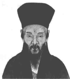
王守仁（1472—1529），字伯安，尝筑室故乡阳明洞中，世称阳明先生，余姚（今属浙江）人。明代哲学家、教育家。早年因反对宦官刘瑾，被贬为贵州龙场驿丞。后以镇压农民起义，官至南京兵部尚书。初学程朱理学和佛学，后转陆九渊心学，并发展了陆九渊的学说。著作有门人辑成《王文成公全书》三十八卷，其中在哲学上最重要的是《传习录》和《大学问》。

为了这番乱事，遂引出一位允文允武的儒将，削平叛藩，建立奇功，这位儒将是谁？就是前时反对刘瑾、谪戍龙场驿的王守仁。大书特书。守仁自谪居龙场，因俗化导，苗黎悦服。当刘瑾伏诛，调任庐陵知县，未几召入京师，累迁鸿胪寺卿。寻因江西多盗，擢他为佾都御史，巡抚南赣、汀、漳。既莅任，即檄闽、广两省会兵，先讨大帽山贼，连破四十余寨，擒贼首詹师富。复进讨大庾、横水、左溪诸贼，逐去贼首谢志山等，所在荡平。赣州知府邢珣，吉安知府伍文定，亦奉檄平定桶冈，招降贼首蓝廷凤，破巢八十有四，俘斩六千有奇。守仁又诱斩浚头贼首池仲容及弟仲安，追余贼至九连山，扫清巢穴，芟雉无遗。数十年巨寇，一并肃清，远近惊服如神明。守仁因境内大定，往谒宸濠。濠留他宴饮，适李士实亦同在座，彼此谈论时政得失。士实道：“世乱