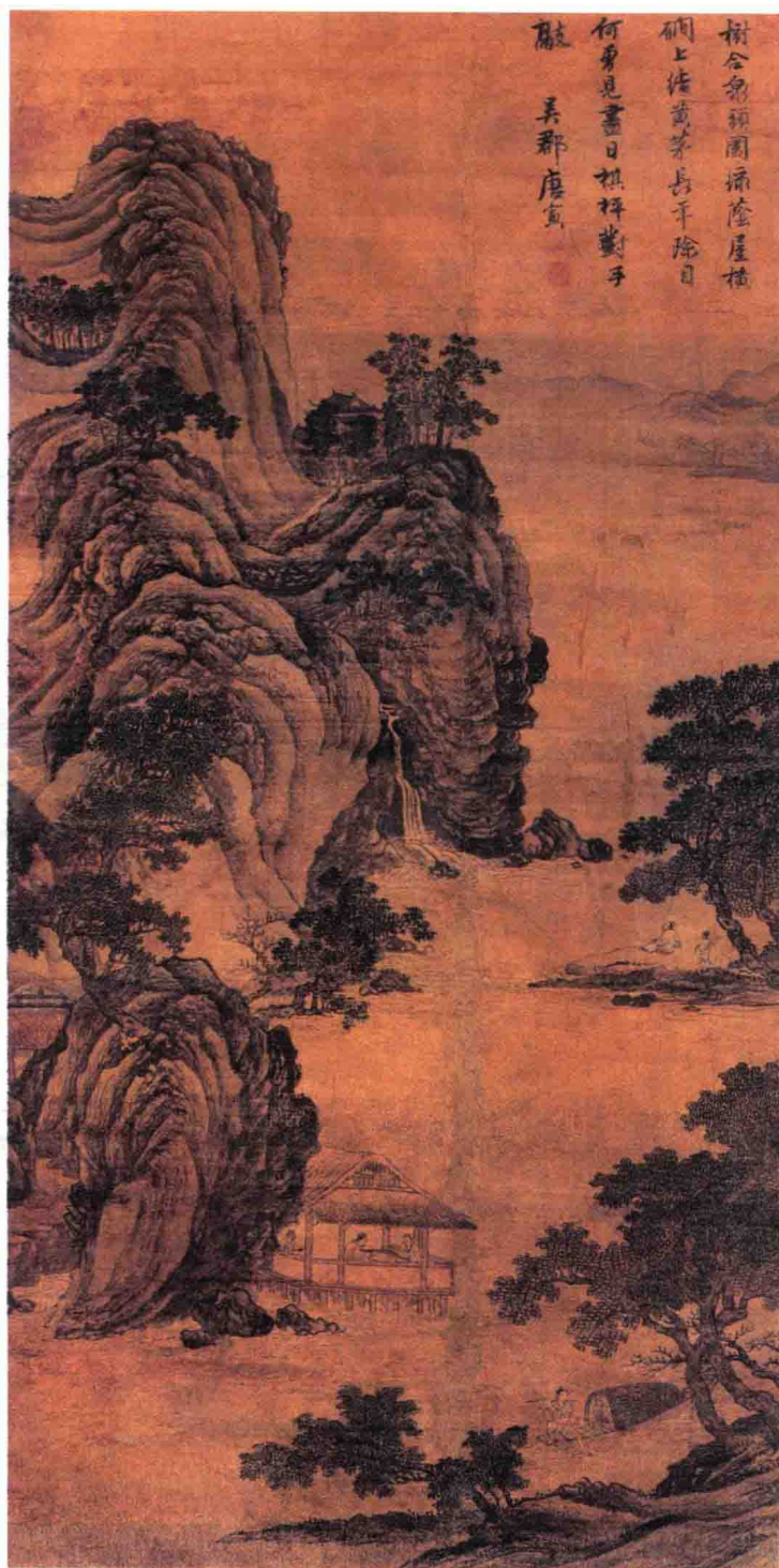
唐伯虎《溪亭对弈图》