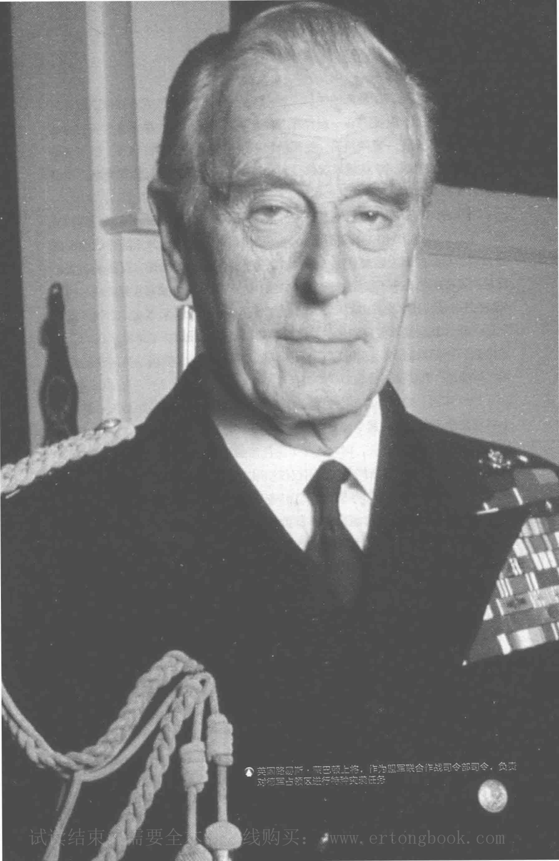
▲ 英国陆军元帅，蒙巴顿上将，作为盟军联合作战司令部司令，负责对德军占领区进行特种实战任务