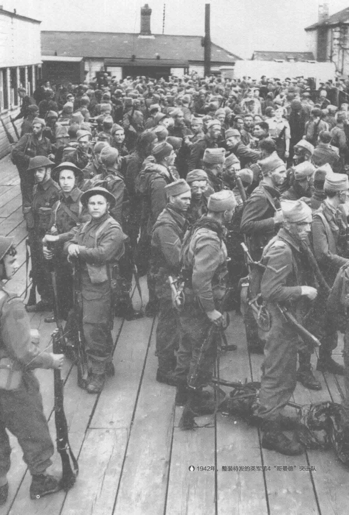
1942年，整装待发的英军第4“哥曼德”突击队