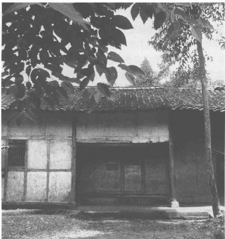
■ 朱德的诞生地——地主丁邱川家的破仓房

私塾的先生是个姓丁的秀才。他对富家子弟不敢惹,对朱家兄弟却动不动就拿戒尺打手板。那些有钱人家的少爷,根本看不起穿草鞋的农家子弟,时常寻机挑衅,还给他们起外号,骂他们“三头水牛”,还借用同音字“猪”来羞辱朱家兄弟。为了读书,他们只得忍气吞声。有一次,朱德上学前帮家里拾柴,没来得及吃饭,妈妈让他带了一个烤红薯。丁家少爷看到朱德的口袋鼓鼓囊囊,非