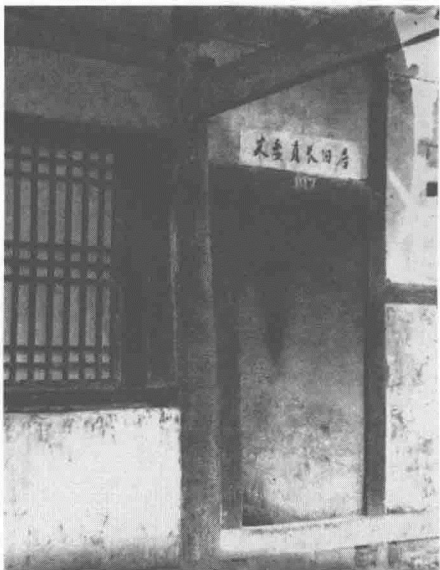
■ 朱德在仪陇县高等小学堂任教时的住所

而来的朱德带来了希望。有一次，不知是谁把一本同盟会的机关报《民报》塞在他的枕头底下，他仔细阅读之后，又悄悄塞到另外一个同学的枕头下。他希望自己也成为同盟会会员，但经多方探听，没有谁告诉他有关同盟会的情况，他感到很失望。这时，“推翻皇帝建立一个好国家”的思想已在他脑海里悄然产生了。