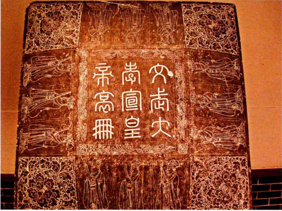
辽圣宗哀册，上书“文武大孝宣皇帝哀册”