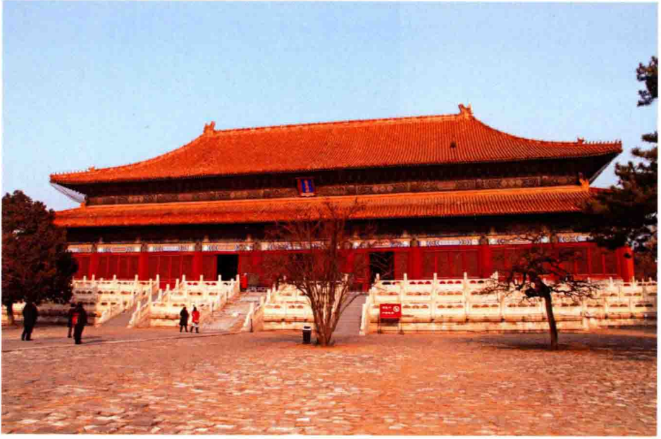
明成祖长陵祔恩殿