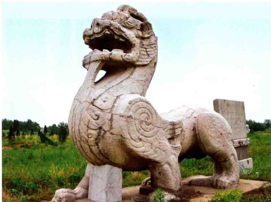
南朝梁武帝修陵石刻