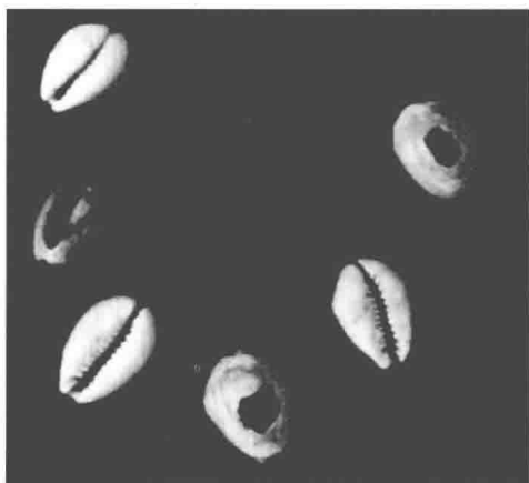
图1-5 环纹货贝·马厂型

首先发现于青海民和县马厂塬而得名，持续时间为公元前2330~公元前2055年。马厂型是继半山型之后发展的另一种艺术风格的彩陶。色彩还是以黑、红两色为主，也有单用黑色的，同时马厂型在装饰上又有一种新的创造，就是以两条红色线和镶一条黑线的画法，使花纹呈现浮雕感。特点是先施红白陶衣，纹饰的母题有圆圈网格纹、螺旋纹、菱形纹、回纹、连弧纹、人形纹等，而以人形纹最为流行，人形纹在学术界称为蛙纹、谷神纹。早期的人形纹有头、身、双手和双足，手和足还有五指，双手伸举，屈腿直立。中期的人形纹头部消失，只留躯干，肢体增多。晚期则仅留爪指或变成三角折线纹，人形纹的变化大体是从繁到简，不断的样式化和符号化。马厂型彩陶壶早期较矮肥，以后逐渐变瘦，颈部加长，单把直筒杯，造型别致。纹饰粗的较粗，细的