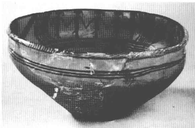
图1-4 舞蹈人纹彩陶盆·马家窑型

半山型因首先发现于甘肃宁定半山地区而得名，持续时间约公元前2655~公元前2330年，色彩以黑红两色为主，或有橙黄色陶地，装饰纹样以黑红两