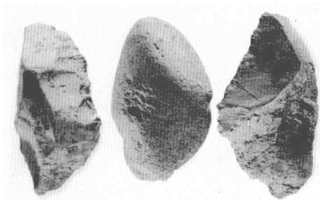
图 1-1 北京猿人使用的石器·旧石器时代初期

一般认为，人类的历史始于 180 万年之前。从距今 180 万年到 1 万年之间的漫长时期，就是旧石器时代。根据其发展状况，旧石器时代又可分作早、中、晚三期。人类早期的造物活动与设计艺术的萌芽，也大致经过了这样三个阶段。距今 180 万年到 20 万年前，是旧石器时代早期。这一时期，人类赖以生存的工具是极为粗糙的石器，甚至很难看出人为加工的痕迹。从这一点看，人类的早期造物活动很可能