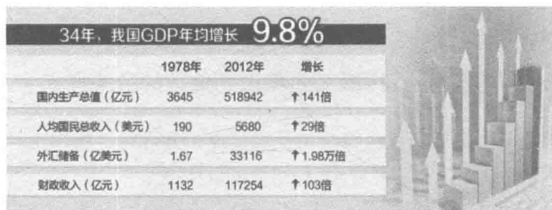
图1-1 改革开放30年来中国的经济总体指数情况

国家财政实力明显增强。1978年国家财政收入仅1132亿元，2012年，我国财政收入达到117254亿元，比1978年增长103倍，年均增长14.6%，如图1-1所示。财力的增加对我国促进经济发展、加强社会保障、减小城乡差距、切实改善民生、有效应对各类冲击提供了有力的资金保障。