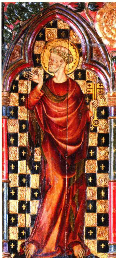
► 《圣施洗约翰》(索海姆帕尔瓦祭坛后部装饰局部)。1325—1330 年。索海姆帕尔瓦 (英国)。圣马利亚教堂

“哥特式 (Gothic)”一词，用于描述出现在罗马式风格后的一种艺术风格，形容一种艺术现象。这一风格从 1140 年左右开始在法国出现，12 世纪中后期盛行于英国和西班牙，13 世纪之后才流传到德国，直至更晚才在意大利产生影响。人们试图通过这种传统的定义方式将那些传世的建筑区分开来，并从形式上分析它们。但这种做法并不能解释这些作品在历史上和思想上的重要性。把中世纪艺术根据形式上的特征划分时期，是从建筑学开始的，但艺术史学家们后来将这种划分方式沿用到绘画、雕塑和装饰艺术领域，因为他们认为一个真正的文化个体是可以跨越不同的时代而存在的。学者们以他们定义的复合墩柱 (compound piers)、尖塔、玫瑰花窗 (rose window) 等特定形式，来界定带有国家和地区特色的不同哥特式建筑，追溯它们发展的不同阶段，并由此划分了辐射式时期 (Rayonnant period)、火焰式时期 (Flamboyant period) 及英国的垂直式风格 (Perpendicular style)。从 14 世纪七八十年代到 15 世纪 30 年代出现了“国际哥特式 (International Gothic)”一词，用于形容一种起源于贵族圈子，随后席卷整个欧洲的国际化风格，这种风格倾向于在绘画中大量地运用箭形线条，以达到一种奢华的效果。