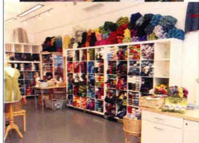
上 / Donegal Tweed含100%美利奴羊毛 下 / 想尽情地在广阔的空间里迷路 Litet Nystan www.litetnystan.se

撰稿 / 松原裕子(happysweden) 左 / 从精致的线到个性的线，应有尽有 下 / Garnverket商店外部一览