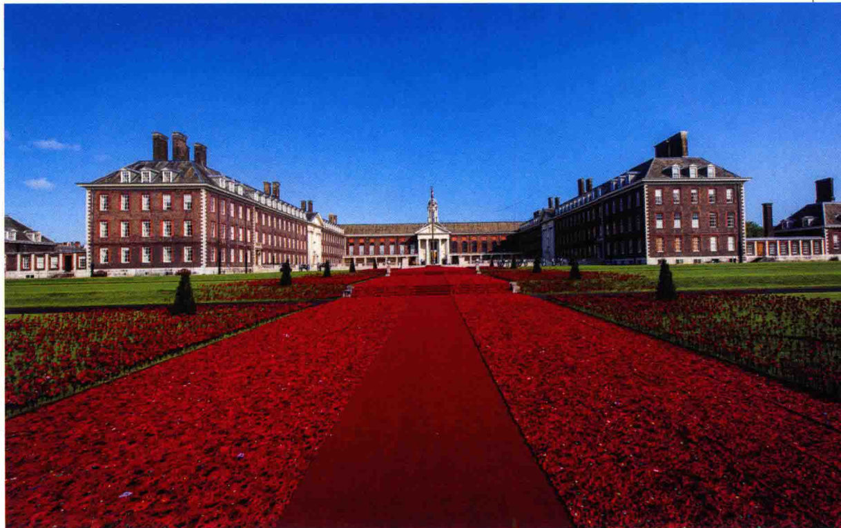
铺在切尔西画展会场荣军医院前庭的手工罂粟花做成的红地毯

在英国以及其他英联邦各国，11月11日是阵亡将士纪念日(Remembrance Day)，各地的英雄纪念碑前都会举行悼念活动。供奉在纪念碑前的就是火红的钩织罂粟花。第一次世界大战时，法国北部以及比利时的荒野曾有激烈的战斗，战争结束后，战场上开满了鲜红的罂粟花，罂粟花也因此被作为在战争中牺牲的兵士的象征。到了20世纪20年代，英国退役军人协会出售红罂粟花纪念章，开展针对战死者及其亲属的慈善活动和捐赠。现在，每年11月前后，车站前都会