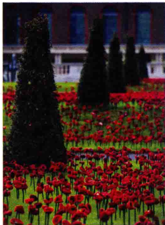
将一枝枝手工编织的罂粟花插在精心打理过的草坪上

英国伦敦每年夏天的例行活动——切尔西花展，今年在5月23~28日举行。这场活动不仅有人气设计师设计的精美园林欣赏，还有园艺工具的销售等，吸引了英国王室伊丽莎白女王、凯特王妃前往，也受到了国内外众多园艺爱好者的关注。今年的主角是铺在会场荣军医院（退役军人的疗养场所）前庭的约30万朵鲜红的罂粟花。这些罂粟花大部分是用钩针或棒针织成，也有用羊毛毡或布料做成。