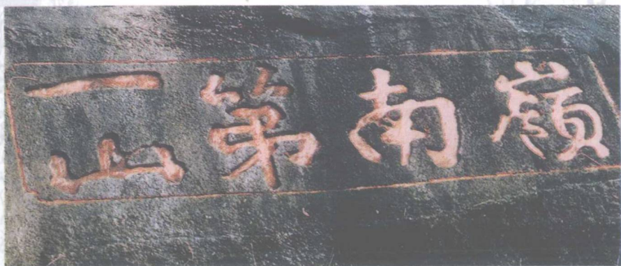
嶺南第一山（华首台摩崖石刻）