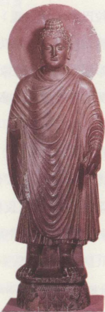
0-1 公元1~2世纪的犍陀罗造像

佛教东传的过程也是一个佛教艺术流传各地逐渐本土化的过程。在一些无法采集到适宜雕刻的石材的地区，人们因地制宜地采用了金铜、泥塑、木雕、陶塑等方法来塑造佛像。如巴米扬（Bamiyan，今阿富汗喀布尔市西北230公里）石窟即为泥塑，具有印度笈多王朝时代的特点，壁画