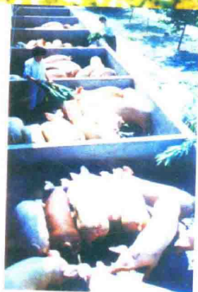
十月村外贸杜湖猪