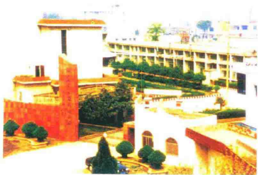
十月村装饰材料厂