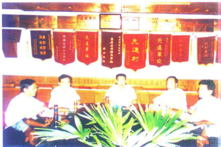
十月村党总支一班人