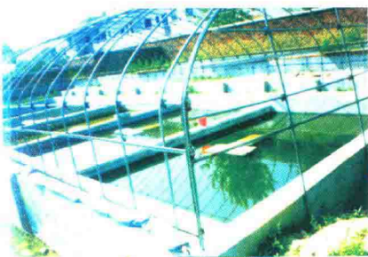
十月村特种水产基地