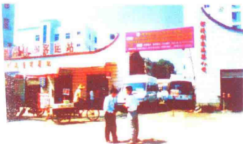
十月村都得利客运公司