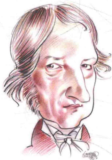
漫畫家筆下的青年黑格爾