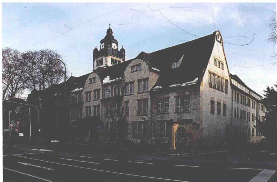
黑格爾出生地連結成一大博物館