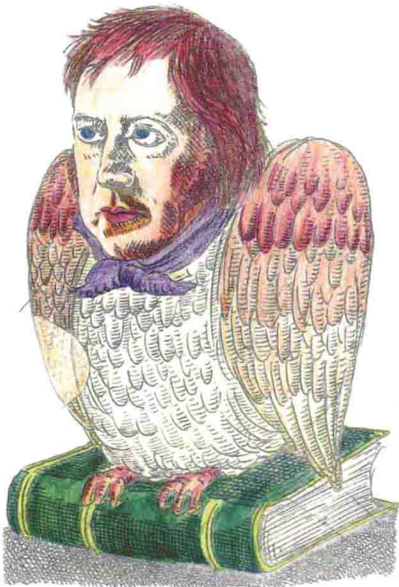
黑格爾不愧為米內瓦的夜梟之化身