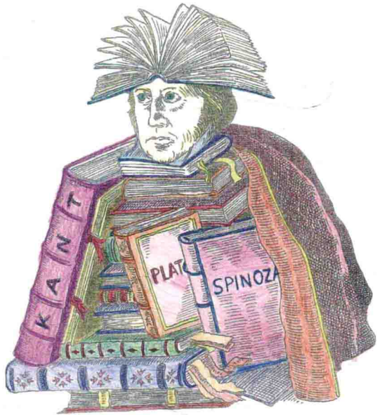
博覽群書的大學者