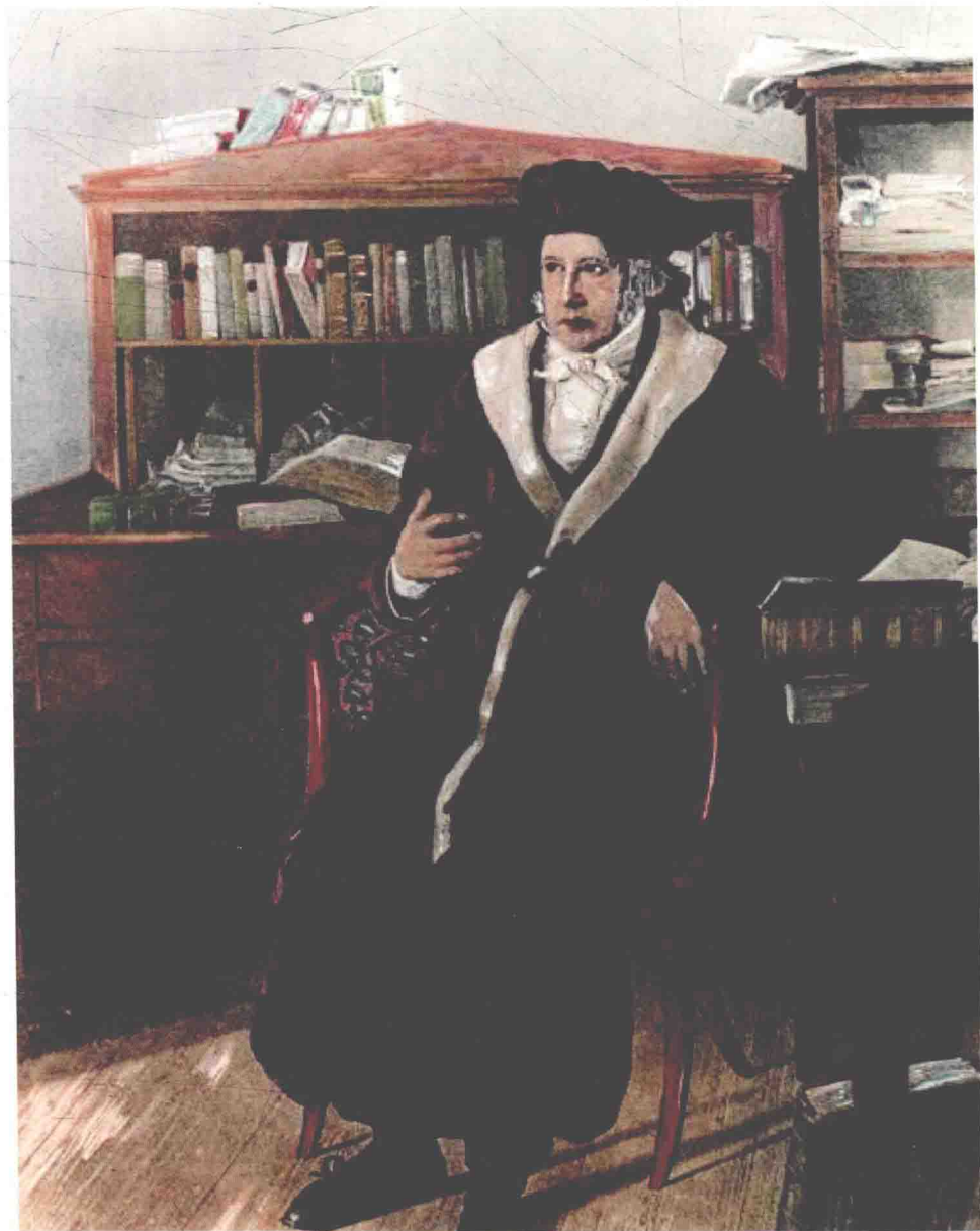
對黑格爾而言，最終的真理乃為意識，而意識非實體，卻是形而上的概念