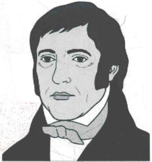
傳統式的黑格爾素描