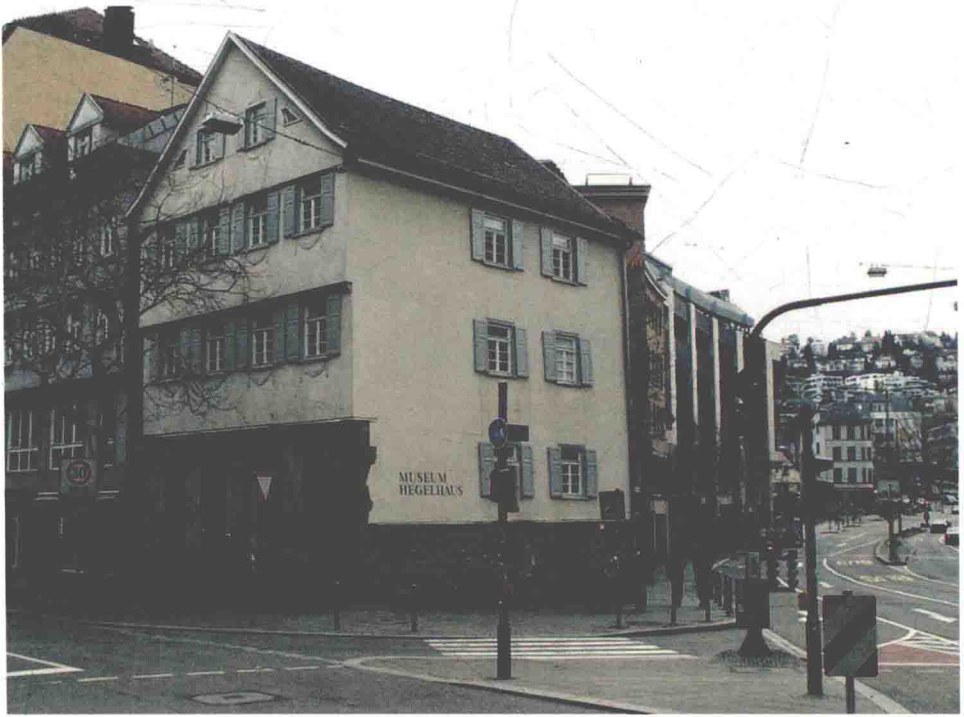
位於斯圖嘉特黑格爾的故居，今改為紀念館